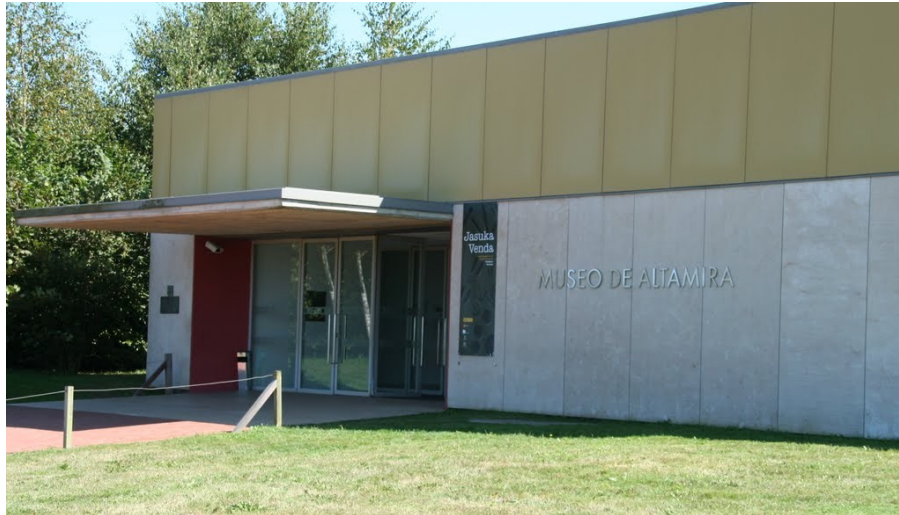
Ил. 5. Музейный комплекс Альтамира-2

различных «чуждых» микроорганизмов, пыли, ороговевших чешуек кожи и прочего, что служит питательной средой для бактерий и плесени [5]. В 2002 г. пещеру пришлось вновь закрыть. В этом же году, по примеру французской пещеры Ласко, была создана пещера-дублер Альтамира-2, призванная «оттянуть» на себя внимание туристов и спасти памятник от гибели.