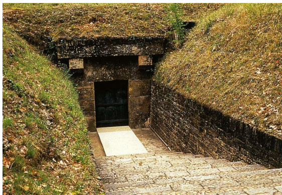
Ил. 9. Вход в пещеру Ласко

палеолитической пещерной живописи. В Ласко, впервые для такого рода объекта, была создана ав-