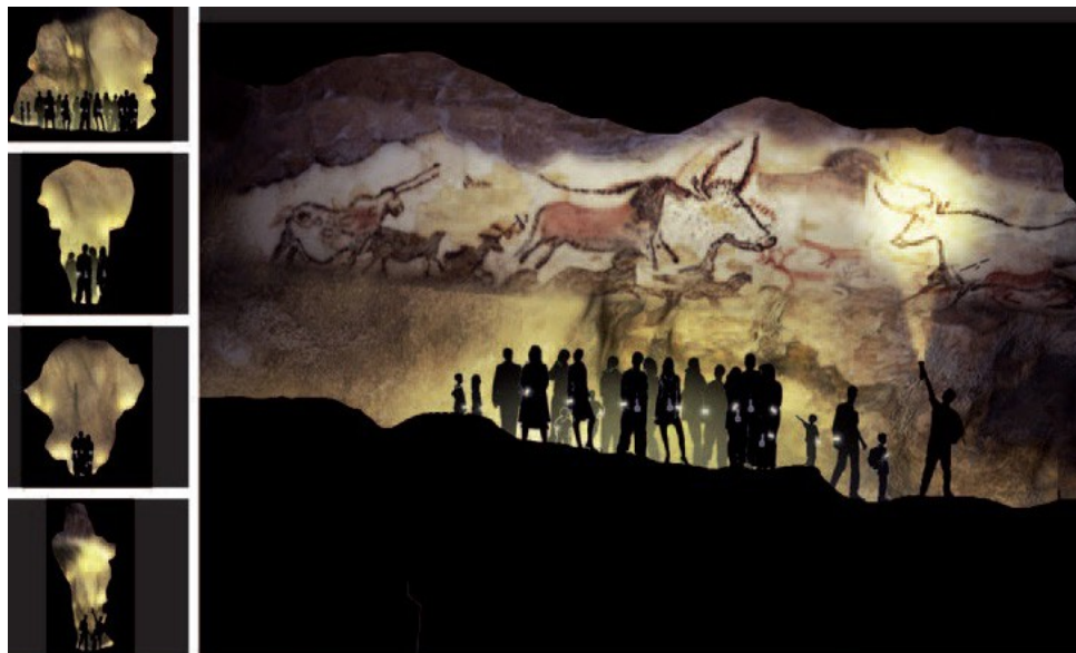
Ил. 11. Проект Ласко IV

ного воспроизведения первобытной живописи, была открыта в 1983 году. С тех пор ее ежегодно посещают до 250 тыс. туристов [11].