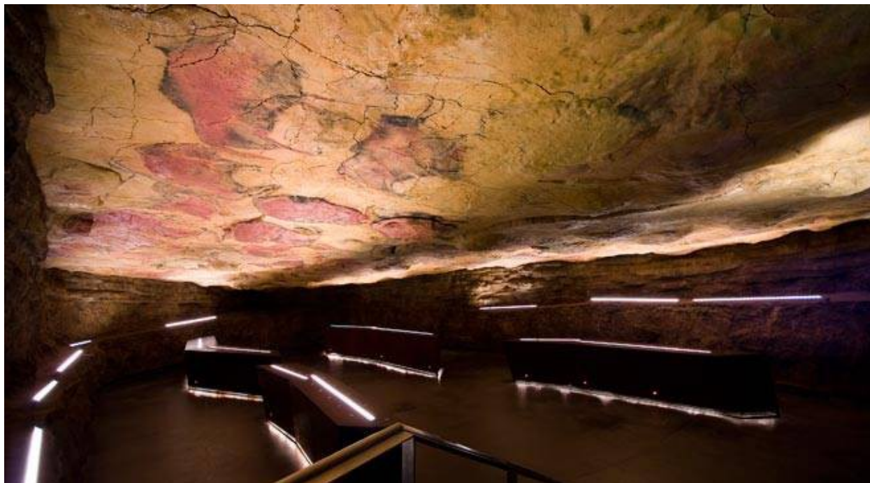
Ил. 6. Музейный комплекс Альтамира-2

Надо отметить, что к этому времени уже был накоплен достаточный мировой опыт копирования целых комплексов первобытной живописи. Пионерами в этой области выступили французы. Были выполнены факсимиле росписей знаменитых пещер Ласко в департаменте Дордонь и Нио в Арьеже. Копии потолка Альтамиры установлены в Немецком музее в Мюнхене, Национальном музее археологии в Мадриде, а также в Японии.