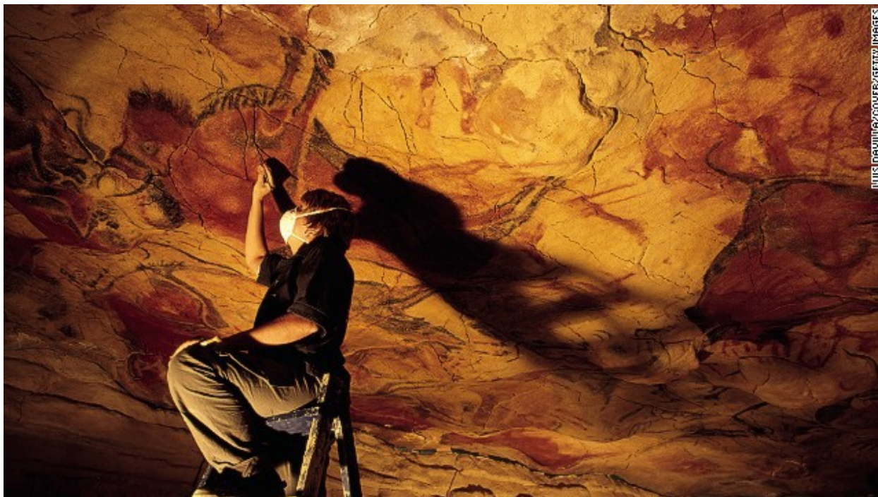
Ил. 7. Работа над созданием копии росписей Альтамиры

Альтамирой-2 появился музей, проведена дорога и создана необходимая инфраструктура для приезжающих. Комплекс приобрел популярность, количество туристов увеличилось до 250 тыс. человек в год (в 1,5 раза больше по сравнению с «бумом» начала 1970-х гг.) [7]. Но страсти вокруг пещеры не улеглись.