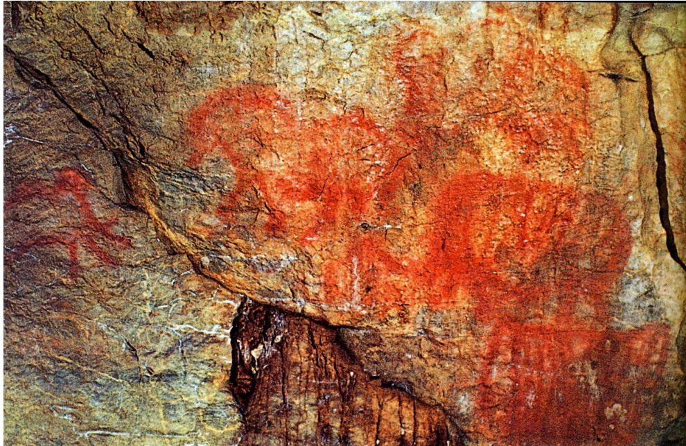
Ил. 15. Изображения в Каповой пещере

натуральную величину. В июле 2010 г. Президент РФ В.В. Путин отдал распоряжение о развитии музейного комплекса на базе Каповой пещеры [15, с. 280]. Однако крайне низкие объемы финансирования не позволяют даже думать о создании чего-то, хоть издали напоминающего Альтамиру-II или Ласко-II, не говоря уже о Ласко IV.