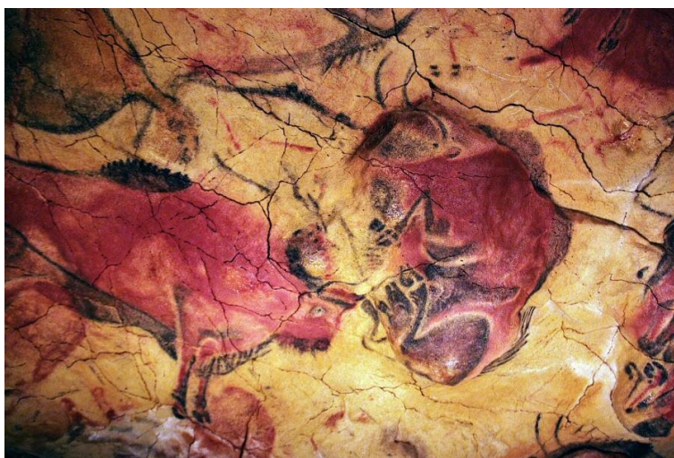
Ил. 3. Фрески Альтамиры

художественный уровень открытых в ней палеолитических фресок, созданных от 20 до 14 тыс. лет тому назад (солютрейская и мадленская культуры), прочно закрепил за памятником название «Сикстинской капеллы первобытного искусства». Пещера простирается на 280 метров и состоит из серии двойных коридоров и «залов». В главном «зале», длиной в 18 метров и высотой от 2