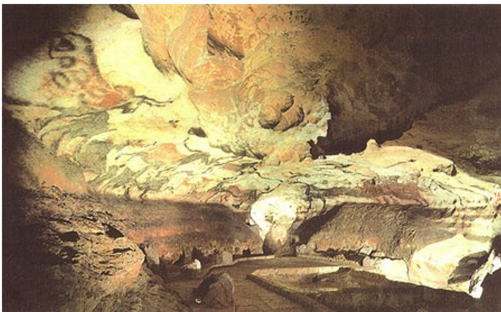
Ил. 8. Пещера Альтамира

Насколько следовало рисковать в случае с Альтамирой, покажет самое ближайшее будущее. А пока интересно обратиться к опыту французской стороны, в частности, по обеспечению сохранности уже не раз упоминавшейся пещеры Ласко. Тем более что там тоже грядет открытие.