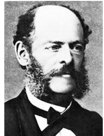
Ил. 2. Марселино де Саутуола

В 1879 г. археолог-любитель Марселино де Саутуола решил исследовать пещеры в окрестностях Сантандера, где находилась его усадьба. В одной из пещер сопровождавшая Саутуолу девятилетняя дочь Мария обратила внимание своего отца на трудно различимые в темноте странные изображения на потолке. «Смотри, папа, быки», – сказала девочка, – впоследствии эта фраза вошла во все учебники истории искусств. Год спустя, преодолев свои сомнения, Саутуола выступил с публичным заявлением о том, что рисунки являются художественным созданием палеолитического человека. С этого дня начались длительные злоключения археолога. Ему не поверили, более того, его обвинили в фальсификации. Высказывалось подозрение, что автором пещерных росписей мог быть один французский художник, друг Саутуолы, гостивший у него в имении. Все попытки Саутуолы доказать подлинность памятника не вызывали ничего кроме насмешек. Тем временем открытия настенных изображений в пещерах множились. Поступали сообщения из Франции об обнаружении росписей в пещерах Шабо, Ла Мут, Пэр-нон-Пэр, Комбарелль, Фон де Гом... Через пятнадцать лет «гонителям» Саутуолы пришлось признать свою ошибку, но сам археолог до этого дня, к сожалению, не дожил [2, с. 277–280].