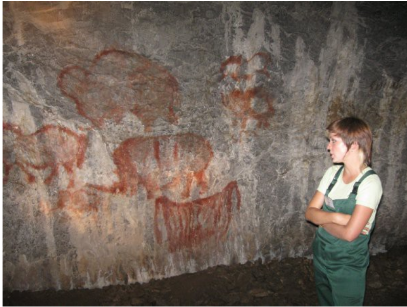
Ил. 14. Капова пещера

сильно, что их нельзя однозначно интерпретировать. По сути, изображения уже стали реликтами рисунков или знаков и выглядят как пятна [15, с. 58]. Около 15% изображений имеет промежуточную или плохую сохранность, т. е. они еще различимы и дешифруются с помощью компьютерных методов. И лишь 14% имеют удовлетворительную сохранность. К ним относятся практически все палеолитические рисунки «Зала рисунков» [15, с. 58].