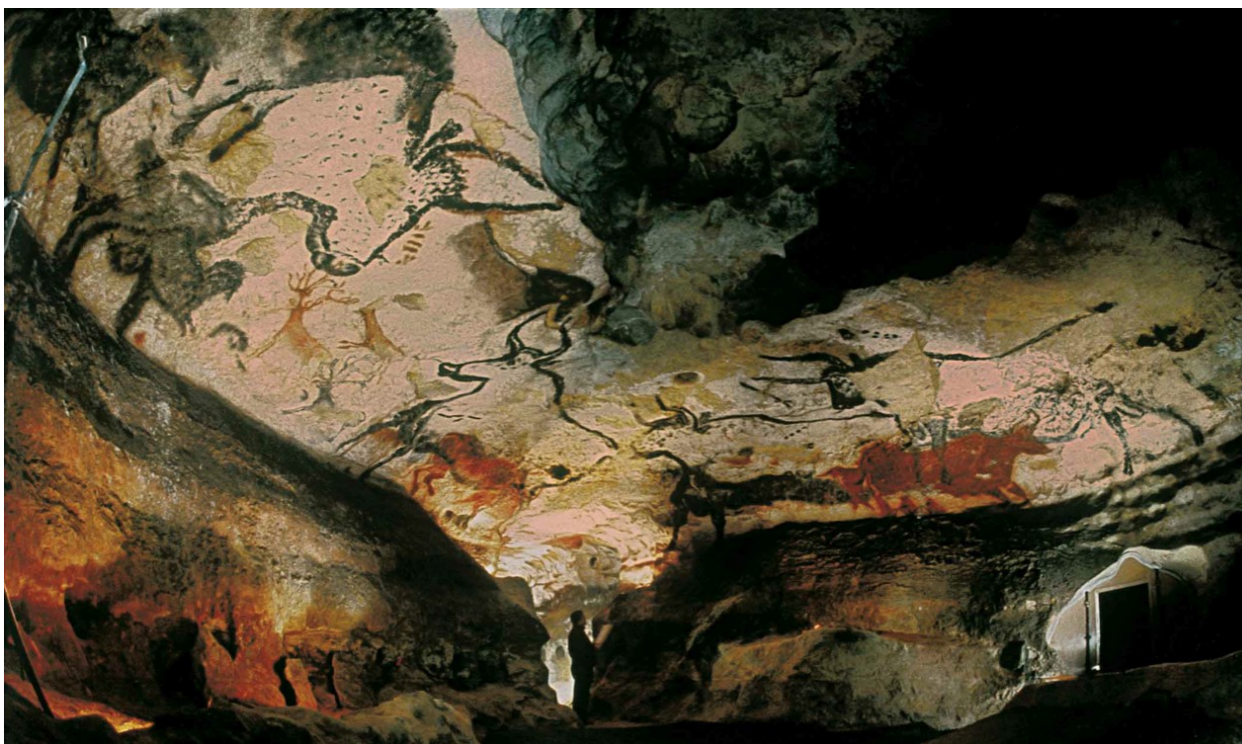
Ил. 10. Ласко. «Зал быков»

Еще в конце 1960-х гг. Национальный географический институт Франции (IGN) провёл стерео-фотограмметрическую съёмку всех расписанных поверхностей пещеры.