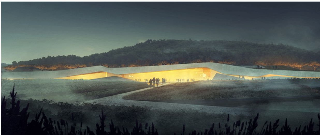
Ил. 12. Ласко IV

Под эгидой Центра наскальной живописи Ласко был объявлен конкурс на лучший проект, который выиграла известная норвежская архитектурная фирма Snøhetta. Общая стоимость проекта 50 млн. евро. В связи с кризисом государственная поддержка строительству существенно сокращена, и местные власти делают ставку на альтернативные источники финансирования [11]. Уже можно сказать, что новое, необычной архитектуры здание со стеклянным фасадом настолько органически вписывается в окружающий пейзаж, что уже само по себе становится культурной достопримечательностью. Что касается интерьеров, то авторы не только стремятся создать «идеально точную» копию пещеры и ее росписей, но и погрузить зрителей в атмосферу таинственности и сакральности древнего места, для чего будут использованы новейшие аудиовизуальные технологии [12]. Кроме того, в Ласко IV предусматривается выделение особого выставочного пространства под экспонирование произведений современного искусства, сюжеты которых навеяны рисунками первобытных художников. Открытие нового комплекса запланировано на 2016 год [13].