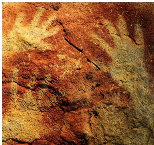
Ил. 4. Росписи Альтамыры. «Ладони»

Основной пик паломничества туристов в Альтамыру пришелся на 1960-е – начало 1970-х гг. Так, только в 1973 г. пещеру посетили 177 тыс. человек, что не могло не сказаться на ее состоянии. В 1977 г., после обнаружения на рисунках плесени, возникшей из-за серьезных нарушений микроклимата и светового режима, пещера была в первый раз на реставрацию. Более того, исследователи, к своему ужасу, увидели многочисленные повреждения красочного слоя на фресках из-за попаданий монет и других мелких предметов, которые посетители бросали либо «на счастье», либо в надежде «отбить кусочек» на память. В 1982 г. после недолгих дебатов Альтамыру вновь открыли, ограничив количество гостей до 8500 человек в год, т. е. не более 35 человек в день. Из-за огромного числа желающих увидеть знаменитый комплекс в разгар туристического сезона экскурсии оказались расписанными на три года вперед [8]. В 1995–1997 гг. по настоянию ученых были проведены очередные исследования влияния посетителей на экосистему пещеры. Результаты оказались неутешительными: экспертиза показала, что даже малые, строго организованные по времени, группы из пяти человек существенно меняют температуру, влажность и содержание углекислого газа в пещере. Не говоря уже о «проносе» на обуви и одежде