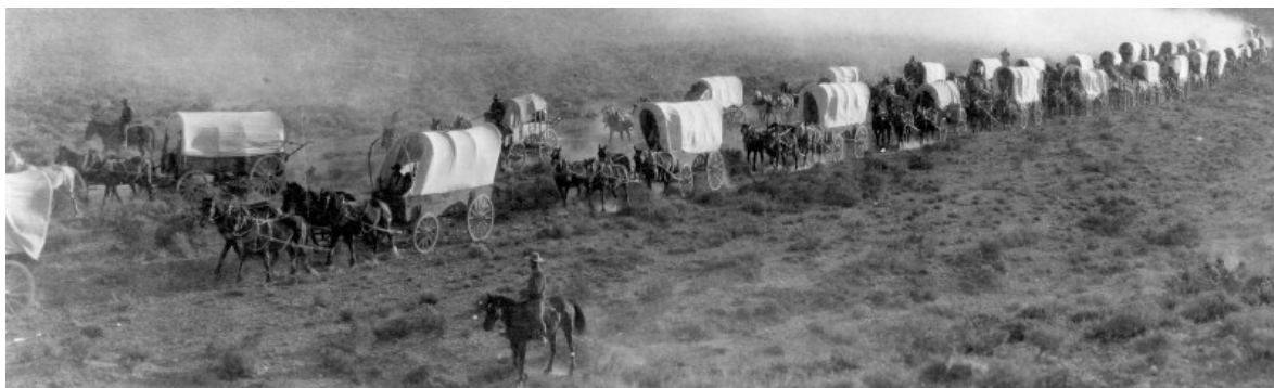
Ил. 2. Кадр из кинофильма «Крытый фургон»

кады сложных упражнений и головокружительных трюков. Начиная с мелодрамы «В старой Калифорнии» (1910 г.), которую американский режиссёр Д. Гриффит со студии «Биограф» снял в окрестностях Лос-Анджелеса, открыв тем самым для кинематографистов местечко Голливуд, куда ринулись его коллеги с восточного побережья, чтобы не платить требовавшему за своё изобретение Т. Эдисону «лицензионных отчислений», кони выступали статистами в фильмах про ковбоев, индейцев, первых поселенцев и т. д.