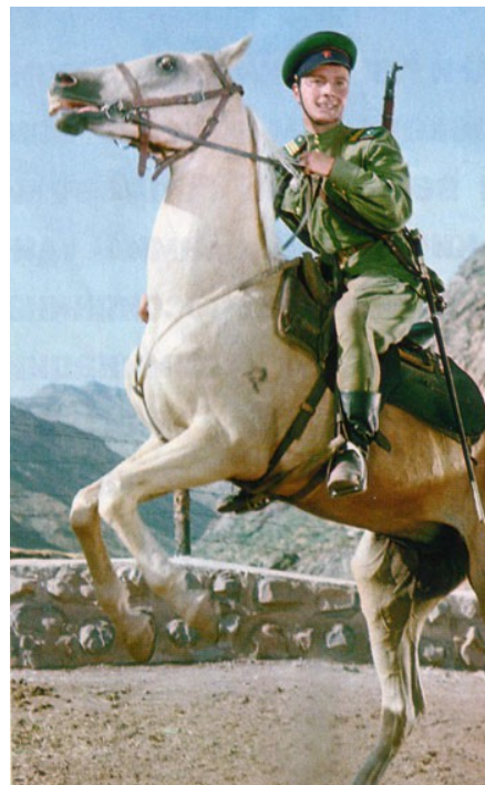
Ил. 7. Кадр из кинофильма «Застава в горах»

Американская картина «Эквус» (equus – в переводе с латинского «лошадь»), вышедшая в 1977 году, также является экранизацией. Её поставил Сидней Люмет по одноименной психологической драме Питера Шеффера, основанной на реальном событии.