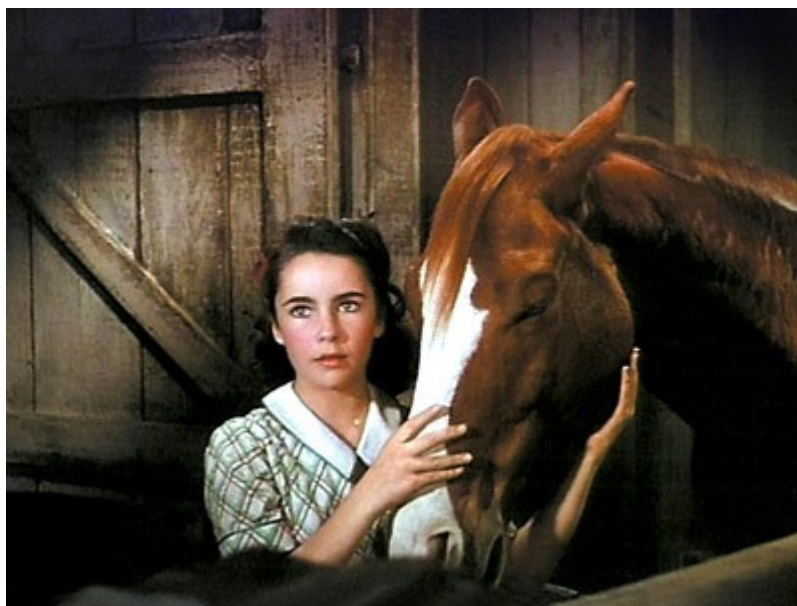
Ил. 6. Элизабет Тейлор в кинофильме «Национальная Вельвет»

Огромным успехом во всём мире пользовались звуковые кино- и телефильмы о Зорро и его вороном коне, где главного героя играли такие мужественные красавцы, как Тайрон Пауэр («Знак Зорро», 1940); Гай Уильямс «Зорро», 78 серий, 1957–1959); Ален Делон («Зорро», 1975) и Антонио Бандерас («Маска Зорро», 1998; «Легенда Зорро», 2005). До сих пор всё новые и новые поколения зрителей продолжают выяснять, кто же из актёров был лучшим.