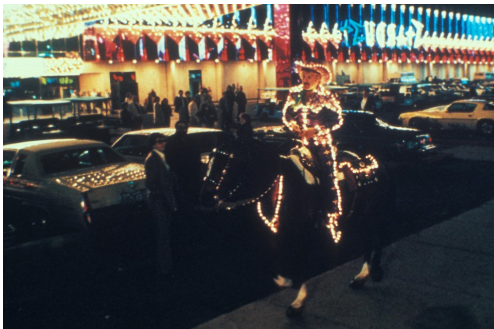
Ил. 8. Роберт Редфорд в «Электрическом всаднике»

Вместе с «Вороним жеребцом» в прокат вышла трагикомедия С. Поллока «Электрический всадник», в которой главные роли сыграли Роберт Редфорд, Джейн Фонда и четверногий красавец Let's Merge (с англ. – «Давай сольёмся»). Герой Редфорда, Сонни, в прошлом пятикратный чемпион родео, в настоящем – «лицо» пищевой корпорации, рекламирующее хлопья для завтраков. Его сытую, но тусклую жизнь скрашивает только виски. За огромные деньги корпорация покупает другого бывшего чемпиона – великолепную скаковую лошадь по кличке Восходящая Звезда, чтобы сделать коня вместе с Сонни символом фирмы. Во время рекламной кампании в Лас-Вегасе, где герой должен выступить в шоу на этой чистокровной верховой, Сонни замечает, что благородное животное ранено и накачено лекарствами. Ковбой решает спасти его от бездушных собственников: похищает