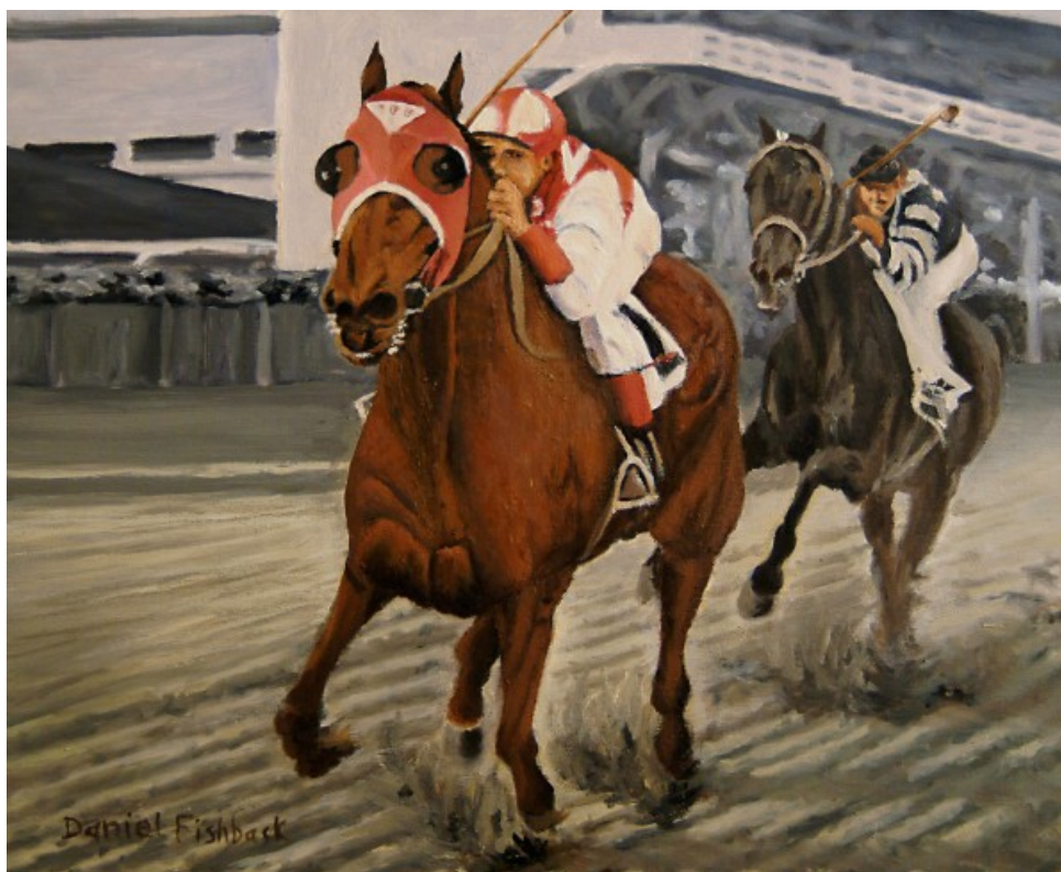
Ил. 10. Поединок Сибискита и Адмирала Войны

Кульминацией фильма стала встреча на скаковой дорожке Сибискита с «непобедимым» чемпионом Восточного побережья, красавцем Адмиралом Войны (War Admiral), чьим отцом был легендарный Человек Войны (Man o' War).