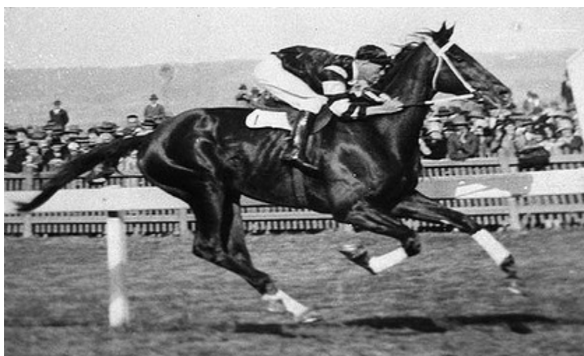
Ил. 9. Фар Лэп финиширует

В первой же скачке Фар Лэп пришёл к финишу последним. Но через год начались победы. Жеребец поражал всех своей резвостью. Тактикой «Рыжего Ужаса» (так прозвали его недоброжелатели) раз и навсегда стал медленный старт и бурный зрелищный финиш.