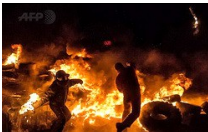
Ил. 1. Государственный переворот на Украине

В большинстве традиционных российских СМИ, поддерживающих нынешнюю внешнюю политику РФ, как и в оппозиционных, читаются собственные материалы, а также публикуются переводы или пересказы выступлений видных европейских и американских политиков и экспертов. Обсуждаются, собственно, одни и те же темы, но исходя из диаметрально противоположных позиций, чаще всего – с разными выводами и обязательно – с разной лексикой.