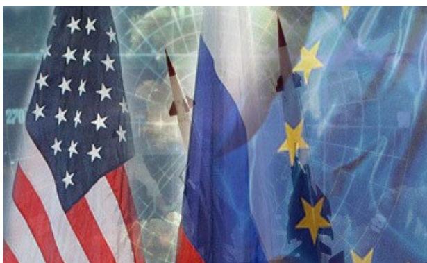
Ил. 3. Россия и Запад

года [1] и до 62% в опросе 6 – 7 декабря 2014 года [2]. Отношение россиян к новому президенту Украины в основном негативное; согласно июньскому опросу ВЦИОМ, он представляется ставленником Запада (43%), олигархов (37%) и националистов (21%) [3]. 79% россиян считают, что среди ополченцев Донбасса воюют в основном местные жители, 45% убеждены, что без прямой военной помощи юго-восточным республикам не победить, при этом лишь четверть россиян разделяют идею о возможности введения российских войск на Донбасс для прекращения конфликта [3].