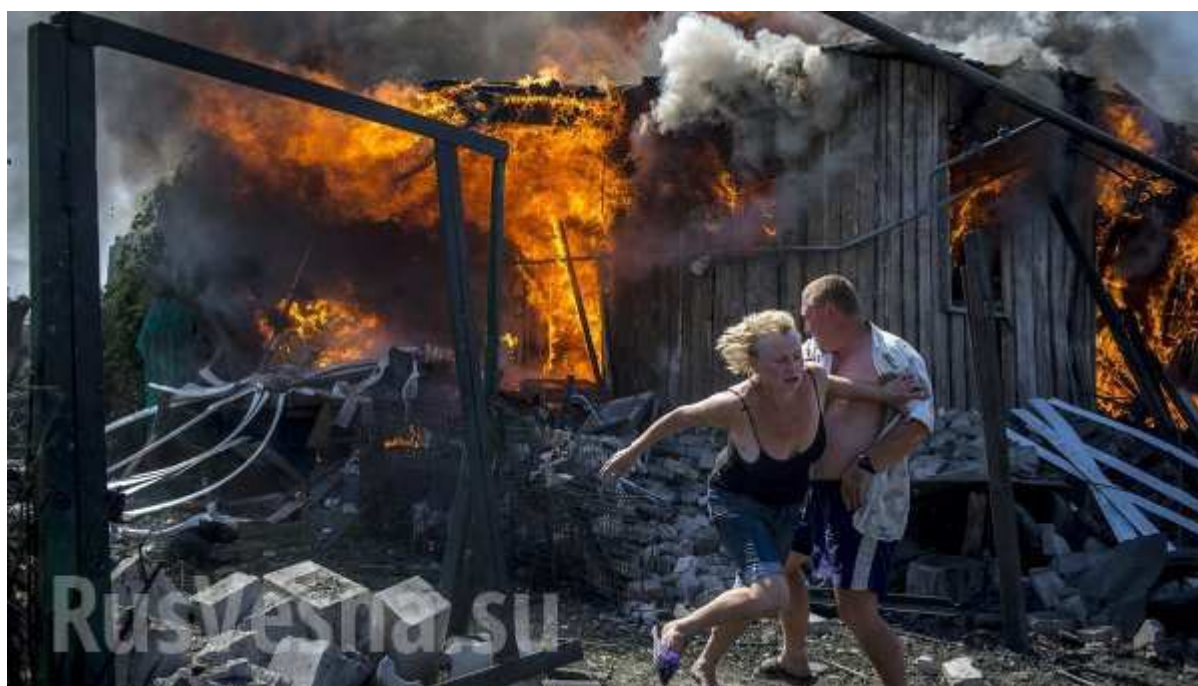
Ил. 2. Гражданская война на Украине

Для тех, кого оппозиционеры называют «патриоты», «запутинцы», ситуация выглядит обратной: эти люди, как правило, осуждают незаконное свержение Януковича, каков бы он ни был (акцент делается на незаконности, насильственности действий радикалов), многие полагают, что к власти пришли неонацисты, а российских войск на Юго-Востоке Украины нет.