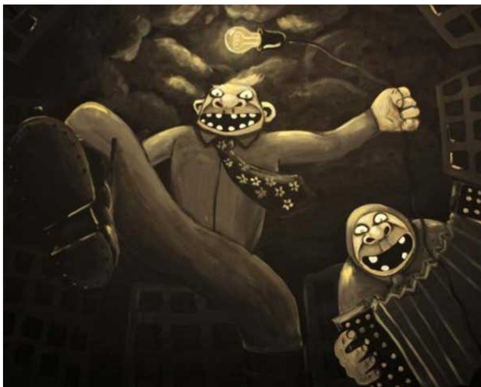
Ил. 5. Бобок-совок по М. Эпштейну

пейские ценности, которые утрачиваются в самой Европе, а политик Максим Шевченко полагает, что Россия не Европа... Нетрудно заметить, что сегодня с новой силой и ожесточением возобновился спор славянофилов и западников XIX века. А Михаил Эпштейн и вовсе назвал тип человека, поддерживающего внешнюю политику РФ (т.е. большую часть населения страны), – «бобок», используя словечко из рассказа Ф.М. Достоевского. Что же такое, по Эпштейну, нынешний российский «бобок»? Это человек, тотально ненавидящий мир как таковой, стремящийся к гегемонии над ним или его уничтожения: «“бобок” – <...> это знак громкого исчезновения, раскатистый предсмертный выдох. <...> Бобок – агрессивно-депрессивный совок, который ничего хорошего не ждет от мира. А потому готов первым нанести сокрушительный удар – и, разлагаясь в могиле, грозит “бобокалипсисом”...» [35].