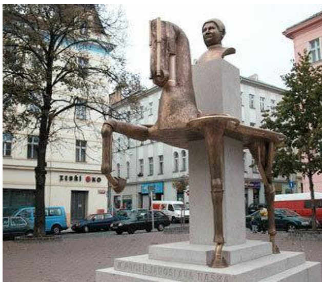
Ил. 9. Карел Непраш. Памятник Ярославу Гашеку

В 2005 году Прагу украсил необычный памятник Ярославу Гашеку, всемирно известному автору книги о приключениях бравого солдата Швейка во время Первой мировой войны. На Прокопской площади в районе Жижков появилась скульптура Карела Непраша, столкнувшая традицию с авангардом: стереотипный барельеф именитого чеха на белокаменном пьедестале прорастает сквозь спину модернистской бронзовой лошади, вызывая у публики самые разные интерпретации, вплоть до красного комиссара Гашека, появляющегося из Троянского коня.