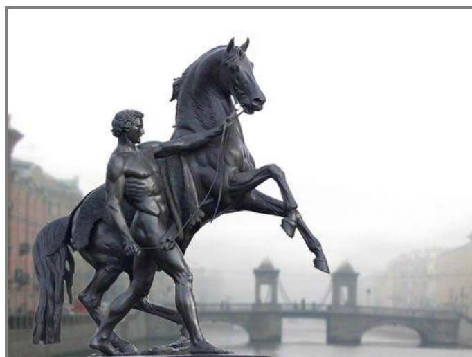
Ил. 8. П.К. Клодт. Фрагмент конной группы Аничкова моста

В основе замысла скульптора лежала тема победы человека над стихийным могуществом природы. В первой группе животное еще покорно человеку. Обнаженный атлет, напрягаясь всем телом и крепко схватив узду, сдерживает вздыбленного коня. Во второй группе возничий пытается осадить скакуна. Голова лошади высоко поднята, ноздри раздуты, пасть оскалена, конь бьёт передними копытами по воздуху, пытаясь вырваться на свободу.