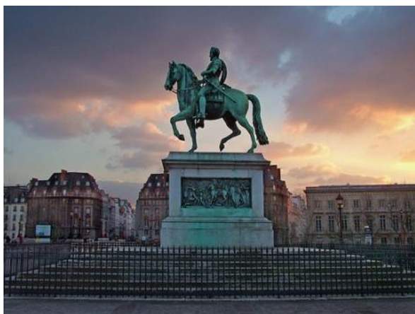
Ил. 6. Скульптор Лемо. Конная статуя короля Генриха IV

Парижа, Генриха IV уже четыре года как не было в живых. Три смертельных удара охотничьим ножом в грудь, нанесённых тридцатитрёхлетним Франсуа Равальяком, школьным учителем из Ангулема, оборвали жизнь монарха. Убийцу казнили четвертованием: на Грэфской площади его разорвала четвёрка дюжих лошадей. Бронзовый монумент, «крещёный» морскими водами, простоял спокойно лишь до начала Великой французской революции. Как символ монархии его разрушили вместе другими королевскими статуями: сначала в жёлтые воды Сены угодил нарядный конь, затем туда же побросали обломки расколотой на кусочки скульптуры Генриха IV.