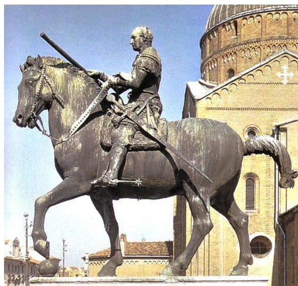
Ил. 2. Донателло. Конный памятник кондотьеру Эразмо де Нарни, по прозвищу Гаттамелата

Эразмо да Нарни, один из известнейших наёмных военачальников позднего средневековья и меценат искусства, начинал военную карьеру солдатом на службе у глав католической церкви, был главнокомандующим сухопутными войсками Венецианской республики. В 1437 году Гаттамелата стал правителем Падуи. Уверенно и спокойно сидит кондотьер на могучем коне. Одной рукой он придерживает поводья, другой – протягивает вперед свой жезл командующего, как бы отдавая приказ.