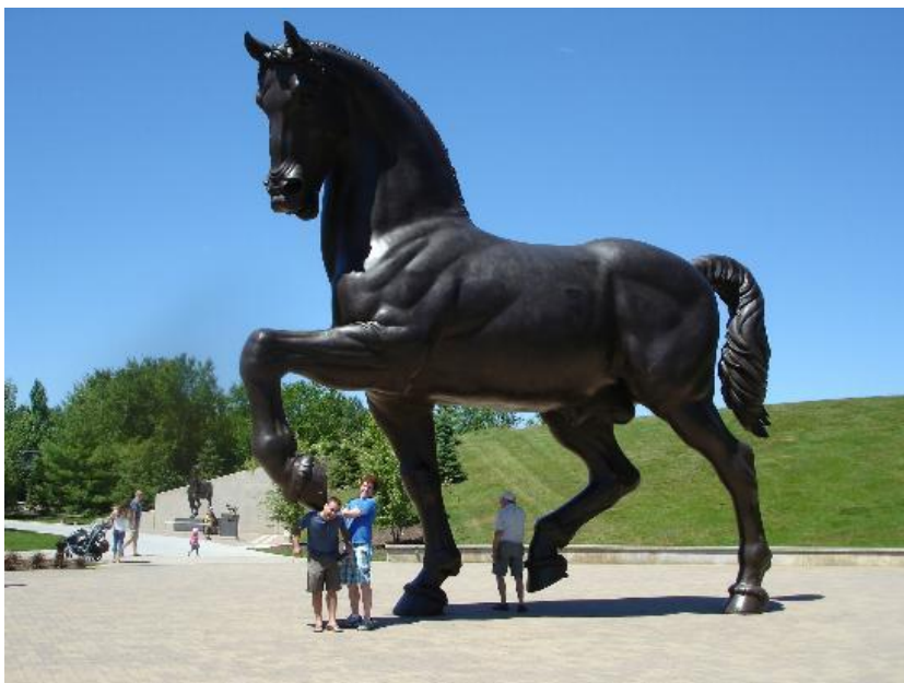
Ил. 5. Конь Леонардо да Винчи. США. Парк скульптуры сада им. Мейера

Сенсация, вызванная завершением реконструкции «Лошади Леонардо», способствовала тому, что у неё немедленно появились два двойника. Уже через месяц гипсовая, выкрашенная под бронзу копия гигантского коня, которую приобрёл один из самых скромных миллиардеров Америки, владелец сети магазинов и меценат Фредерик Мейер, стояла в парке скульптуры Сада его имени (город Гран Репидс, штат Мичиган). Другую – из фибергласа с позолотой – купили и установили у себя японцы.