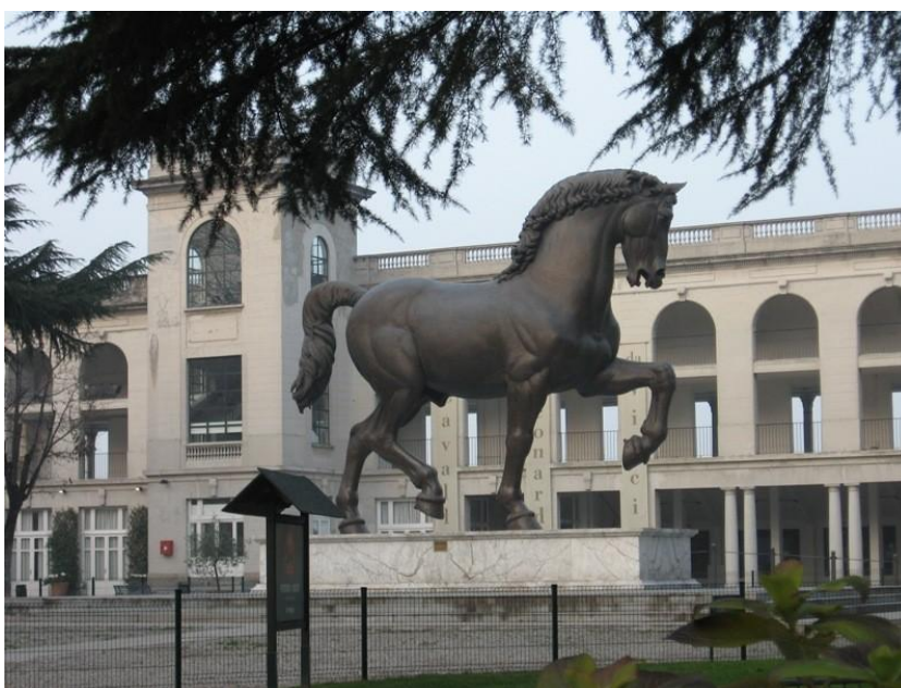
Ил. 4. Конь Леонардо да Винчи. Италия, ипподром Сан Сиро

Восстановленное творение гениального художника в сентябре 1999 года украсило миланский ипподром Сан Сиро.