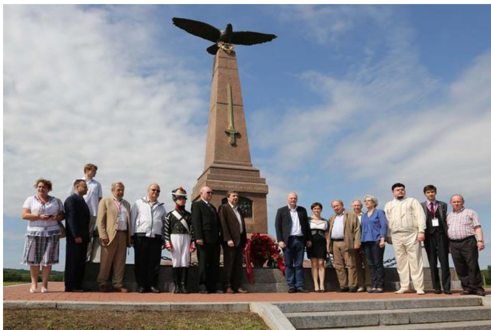
Ил. 5. Члены Общества потомков войн 1812–1814 годов

Бородинском поле каждый год, активно сотрудничают с музеем-панорамой «Бородинская битва», участвуют в заседаниях ученых советов, выступают на ежемесячных встречах с сотрудниками музея-панорамы, историками, педагогами и всеми, кто интересуется историей. В 1989 году в Обществе созданы картотека и генеалогический банк данных о семьях участников наполеоновских войн. Члены Общества сотрудничают с государственными структурами, музеями, учебными заведениями, историками, архивистами, реконструкторами, публикуют все новые и новые исторические исследования, мемуары эпохи наполеоновских войн. Недавно вышел сборник «Да, были люди в наше время!». В Тульской области открыт культурный центр «Усадьба героя Отечественной войны 1812 года генерала Мирковича». Вся работа ведется на общественных началах, никто никогда не имел никаких привилегий, многие пережили тяготы и трагедии советского прошлого. В сегодняшний состав членов Общества входят потомки тех, кто сражался не только при Бородине, но и под Полтавой, Рымником, Шипкой, и не только представители древних дворянских родов, верой и правдой служивших Отечеству на протяжении многих столетий, но и потомки солдат, казаков, духовенства, купцов – хранители славной памяти о подвигах и славе Отечества, передающие последующим поколениям память о подвигах своих предков.