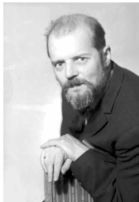
Ил. 3. Сын поэта С.А. Есенина А.С. Есенин-Вольпин – ученый, публицист, поэт, правозащитник

Понятно, что оставшиеся на родине потомки знаменитых граждан России не спешили заявлять о своем родстве. Знание корней оставалось «семейной тайной». Долго скры-