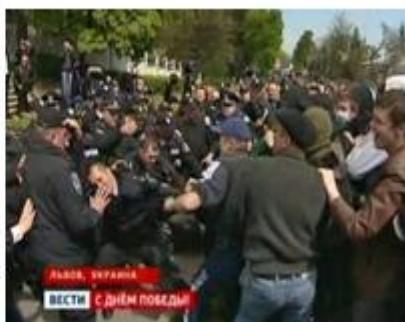
Ил. 11. На Украине националисты напали на ветеранов и сожгли российский флаг. 9 мая 2011

приметы регресса: разоренные села, в которых уже не услышишь прекрасного украинского пения, заключенные хаты, запущенные поля – и дворцы «новых украинцев». А если помнить огнем и мечом выжигаемые с помощью запрещенного международными конвенциями оружия города и села – и прежде всего там, где обнаружен сланцевый газ, на который положили глаз американцы и украинские олигархи, – отношение к гражданам как к нелюдям, не имеющим права на самоопределение, – все это будет уж совсем походить на варварство, но никак не на высокоразвитую цивилизацию.