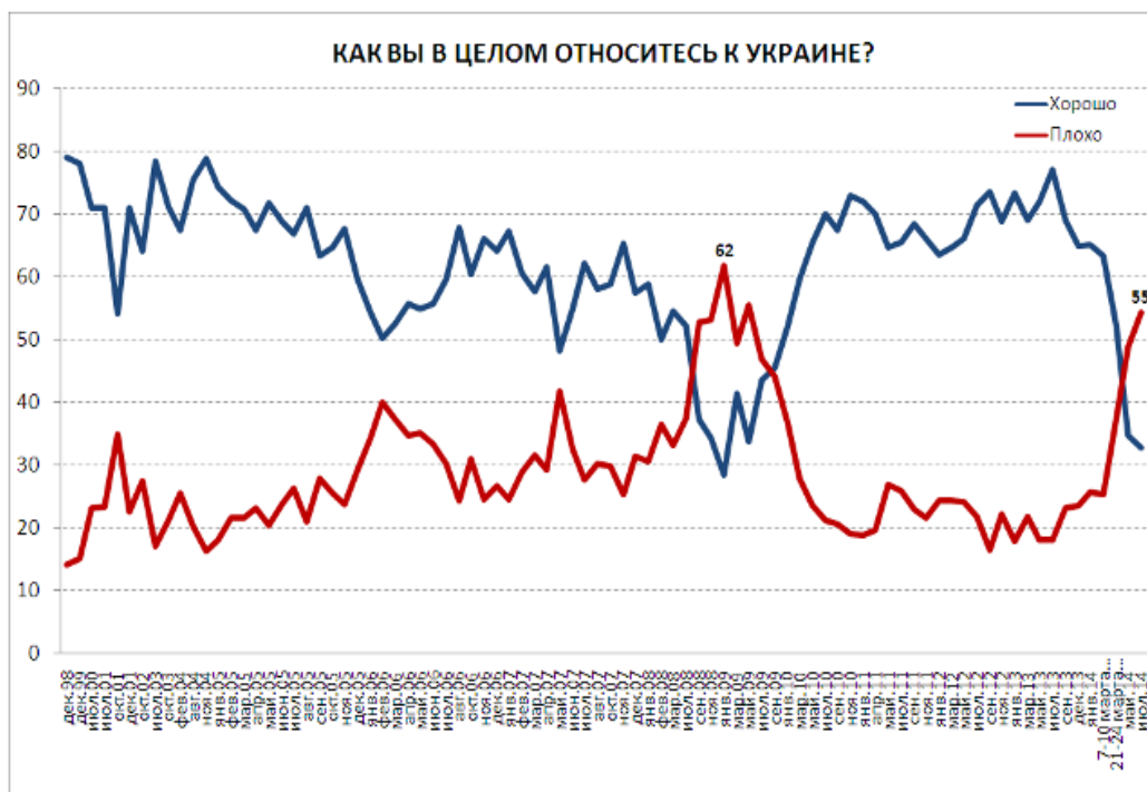
Ил. 3. Динамика отношения россиян к Украине

Причем негатив нарастает: в январе 2014 хорошо относились к Украине 66% опрошенных, а летом – уже только 35%, ранее плохо относились к Украине 25% респондентов в России, теперь, как уже указывалось, – 55%, причем к жителям Донбасса это не относится [17]. Несмотря на то, что образ украинца в данный момент складывается в основном из отрицательных характеристик, украинские события россияне воспринимают, прежде всего, с тревогой (31%) и состраданием (31%) [18].