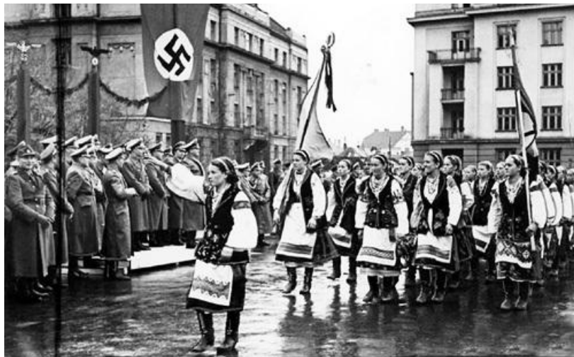
Ил. 2. Бандеровцы встречают немецко-фашистских захватчиков

Накануне и во время Второй мировой войны на Украине развернулось националистическое движение, которое не было однородным, его деятели враждовали друг с другом, однако, воюя на стороне фашистов, они и их адепты разделили тогда западных украинцев с европейцами радикально.