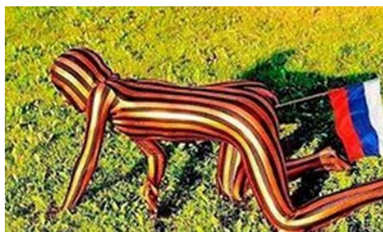
Ил. 12. Самые «скромные» образцы нынешних украинских сатиры и юмора

Появился очень своеобразный юмор, разновидность юмора «черного» – с той только разницей, что качественный «черный» юмор своим сарказмом выжигает страшное, вражду, боль, смерть, тем самым их преодолевая. А юмор, порожденный украинской войной, за редкими исключениями, их воспекает и над страдающими людьми глумится.