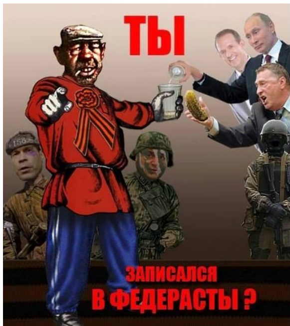
Ил. 13. Самые «скромные» образчики нынешних украинских сатиры и юмора

Российские оппозиционные СМИ, т.н. «либералы» (хотя, как представляется, это lapsus linguae, ошибка в названии: ничего либерального в их идеологии нет; А.И. Герцен был либералом – и что общего с его взглядами у нынешних?) – одна радиостанция и три-четыре печатных СМИ, – а также ряд публичных лиц и их целевая аудитория, открыто поддержали политику нынешних киевских силовиков.