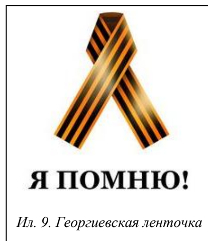
Ил. 9. Георгиевская ленточка

Страна разворована. И кто виноват? Новой идеологии нет, зато старая, почти было умершая, тут как тут: не украинцы же. Ясное дело: русские и жида, они – главные воры и коррупционеры и в то же время, в отличие от трудолюбивых хохлов, – тунеядцы (раз уж Донбасс признан дотационным регионом, что, по мнению неангажированных специалистов, со-