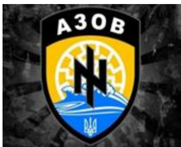
Ил. 10. Эмблема карательного батальона «Азов». 2014

Как и во многих республиках бывшего СССР под крики о прогрессе и освобождении от «проклятого прошлого» развитие пошло вспять – регрессивно, инволюционно [см.: 25]. Какие-то страны вернулись к феодализму с мотыгами и мерседесами, какие-то – почти прямо к рабовладению или племенному строю. Теория деидеологизации ложна: без идеологии общество не живет. Вот и Украина в XXI веке вернулась в феодализм с сюзеренами и вассалами, частными армиями местных князьков и прочими прелестями Темных веков. Кто бывал в этой стране на протяжении последних десятилетий, тому не могли не броситься в глаза хотя бы внешние