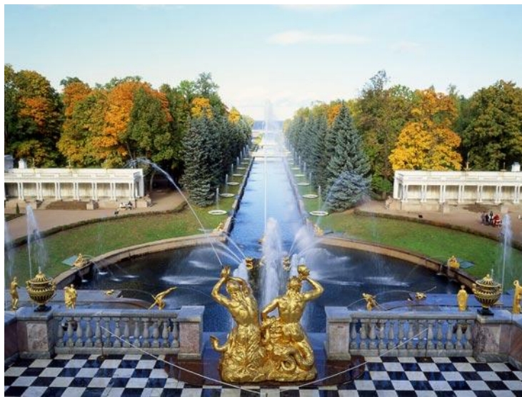
Ил. 1. Петергоф. Большой каскад

В лесах России бушуют пожары: в Якутии, Красноярском крае, на Дальнем Востоке, в Ростовской, Орловской, Тверской и Московской областях. Одни населенные пункты огонь губит, другие так задымлены, что это угрожает не только здоровью, но и жизни людей. Повторяется ситуация 2010 года. Похоже, теперь «пожарные сезоны» становятся нормой. Объясняют это и