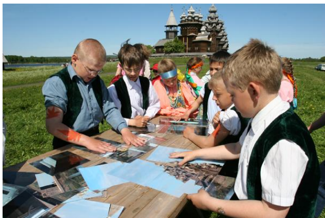
Ил. 4. «Кижы – мастерская детства»

На территории уникального природного архитектурного заповедника острова Кижы работают летний детский этнографический лагерь и Республиканская летняя музейно-этнографическая школа. В школе апробируются методики «средового образования и культуротворческой деятельности». В «Летнем университете на острове повышают квалификацию работники образования и культуры, методом «погружения в историю, культуру и среду острова». Дети «осваивают» остров: к примеру, надо выбрать точку обзора, с которой открываются наиболее красивые виды ( делают это дети безошибочно), выбрать тему для собственной миниэкскурсии, нарисовать или сфотографировать, описать в стихах или прозе увиденное – каждое занятие закрепляется в творческой работе. «Я до сих пор