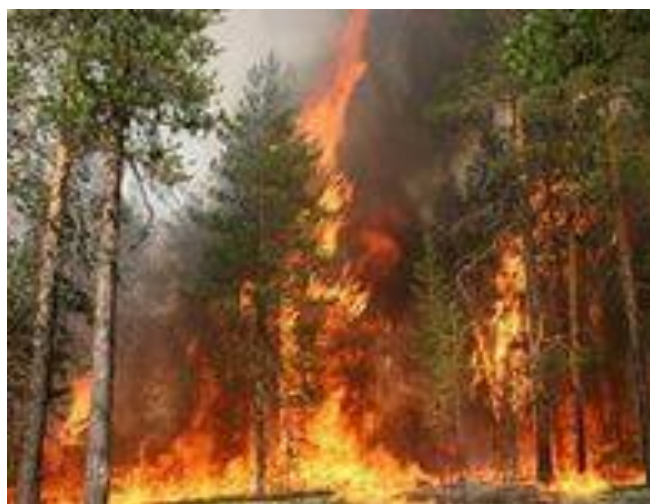
Ил. 2. В России горят леса

Признают значимость экологической культуры лишь работники природоохраны, составители всевозможных программ экологического воспитания и энтузиасты-одиночки, успешно осуществляющих это воспитание. Наибольшего успеха достигают не те, кто увещевает, призывает и даже организует одноразовые показательные акции: праздники птиц, коллективные посадки