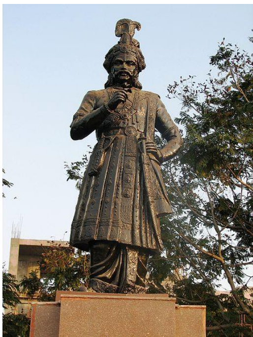
Ил. 8. Памятник императору Кришнадеву Райя

гатевший в результате торговли хлопком и специями с Европой, был одним из самых красивых в средневековом мире. Его дворцы и храмы вызывали восхищение путешественников.