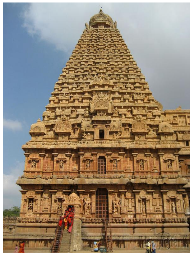
Ил. 12. Храм Брихадешвара действует и сегодня

Объектами всемирного наследия являются три храма империи Чола, построенные в XI–XII веках. Специалисты ЮНЕСКО называют их «Великие живые храмы Чола», потому что, в отличие от большинства памятников мирового наследия, они и сегодня функционируют так же как и тысячу лет назад. Это храм Брихадешвара (Brihadisvara), построенный из гранитных блоков и кирпичей в г. Танджавур (Thanjavur), храм в Gangaikondacholisvaram (также называемый Брихадешвара) и храм Airavatesvara в Darasuram.