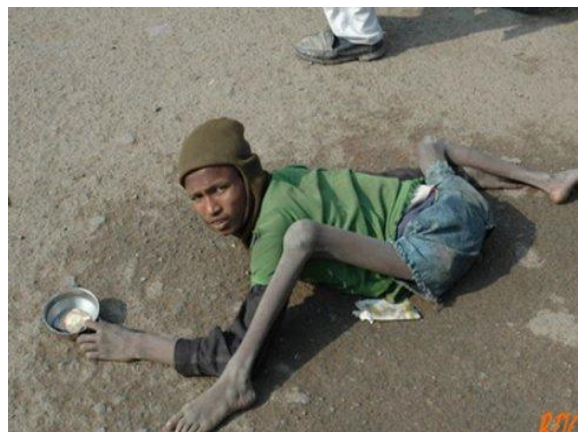
Ил. 5. Попрошайка в Бодхгая

Официальная церемония «Международного конклава буддизма и духовного туризма» была проведена в Нью-Дели в 2004 году. Открывал её президент Индии в присутствии Далай-Ламы. Конклав принял резолюцию, призывающую правительство Индии назначить авторитетную комиссию для рассмотрения ситуации с древними буддистскими достопримечательностями, а также рекомендовать меры по реконструкции и восстановлению их былого величия.