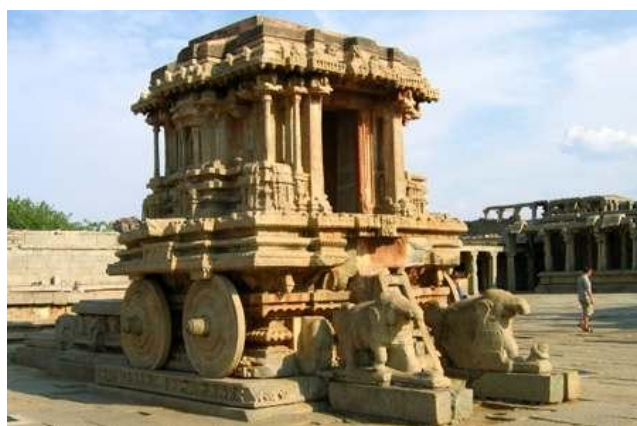
Ил. 9. Один из храмов Виджаянагара

После смерти императора Кришнадева Райя началась ожесточенная борьба за власть между правителями областей. Почувствовав слабость империи, пять мусульманских правителей Деканского плоскогорья объединили свои военные силы, образовали союз, и в 1565 г. двинулись на завоевание некогда процветавшей страны. Одержав победу над армией правителя Виджаянагара, мусульмане в течение шести месяцев грабили столицу империи, после чего город был заброшен. Вместе с городом пала и империя.