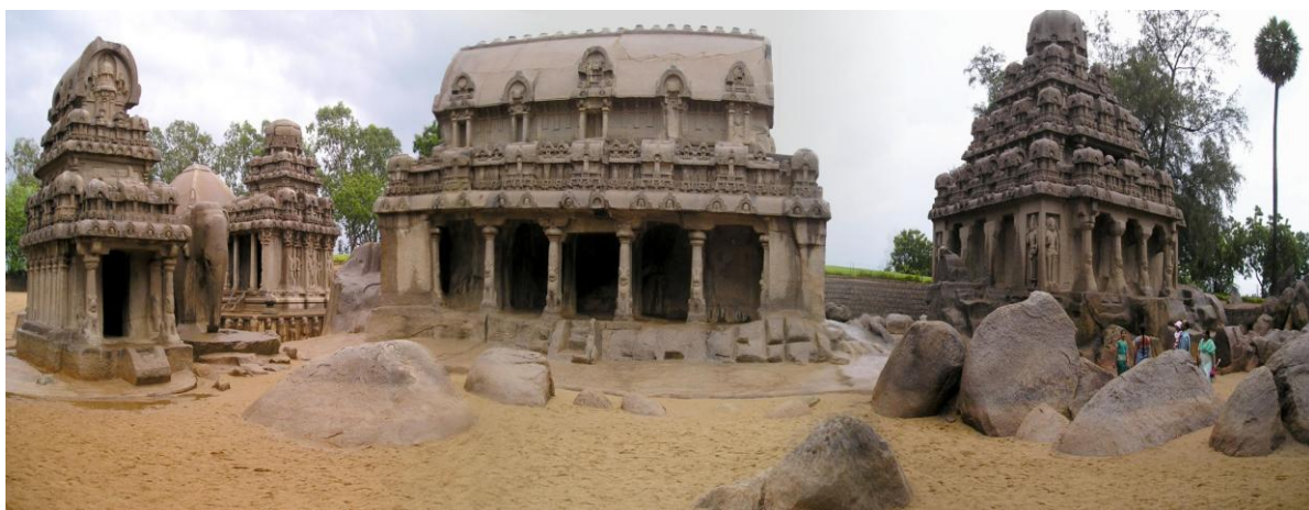
Ил. 10. Храмы в Махабалипураме

На восточном побережье Индии находится небольшой городок Махабалипурам (Mahabalipuram). С VII до начала IX веков это был главный портовый город династии Паллавов (Pallava), который тогда назывался Мамаллапурам. Паллавы были приверженцами индуизма, известными за свою терпимость к другим религиям. Музыка, живопись и литература процветали под покровительством этой династии. Однако лучше всего сохранились архитектурные памятники того времени.