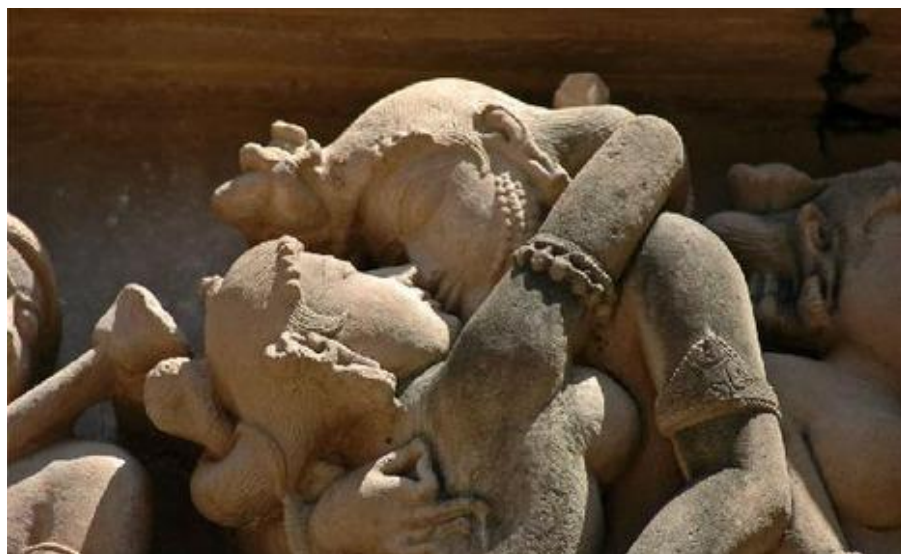
Ил. 1. Храм Кандарья-Махадева (г. Кхаджурахо). Одна из многочисленных скульптурных композиций, украшающих стены храма

Индия – страна, в которой живут представители многих культур и религий. Восемьдесят три процента населения страны придерживаются индуизма (общее число жителей приближается к миллиарду тремстам миллионов человек). Во время правления династии Гуптов (IV–VI вв. н.э.) индуизм стал господствующей религией. Именно индуизм всегда способствовал единству страны. Несколько миллионов жителей Индии составляют приверженцы других традиционных индийских религий – буддизма и джайнизма.