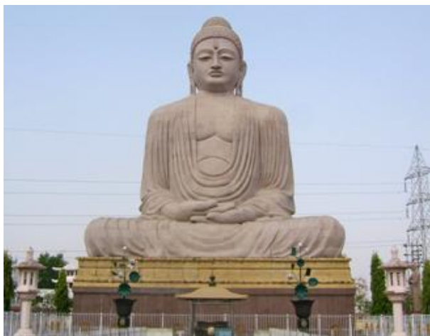
Ил. 2. «Большой Будда» (г. Бодхгая)

Небольшой город Бодхгая этого штата – священное место для буддистов всего мира. Здесь находятся «ваджрасана» (алмазный трон) и священное дерево Познания Бодхи (Bodhi), которые, как уверяют верующие, отмечают место, где Гаутама Шакьямуни получил просветление и стал Буддой («Просвещенным»).