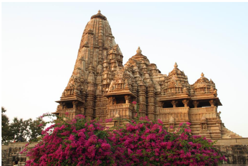
Ил. 14. Храм Кандарья-Махадева

Город Кхаджурахо первоначально был столицей индийской династии Чандела (Chandela), которая правила в центральной Индии с X по XII век. Храмы строились на протяжении сотни лет, с 950 по 1050 гг. н.э., и были посвящены, в основном, богам Шиве (6) и Вишну (6), а также Сурье, Брахме и женским духам – апсарам. Три храма принадлежали приверженцам джайнизма, а один храм Вишну был переделан в усыпальницу Парвати – супруги бога Шивы. Согласно легенде, большинство храмов первоначально были окружены озерами.