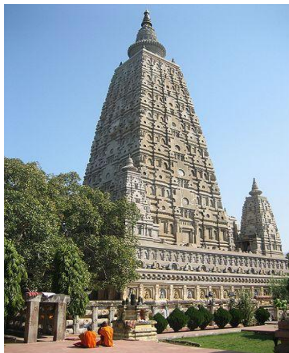
Ил. 3. Храм Махабодхи в г. Бодхгая – место просветления Будды

С ростом количества паломников многие местные жители стали получать прибыль от «культурного капитала» этого места путем производства и продажи сувениров. Некоторые активно учат языки иностранных паломников, – с целью заработать на изобилии специфических туристов. Местные мужчины хорошо зарабатывают на романтических отношениях с гражданками других государств. Так, неестественно большое число владельцев ныне процветающих отелей в свое время женились на невестах из Японии. В 1980-е гг., во время экономического бума в Японии, карманы местных жителей просто пухли от беспрецедентного количества валюты. Случившийся финансовый бум ярко контрастировал с убогой сельскохозяйственной экономикой штата.