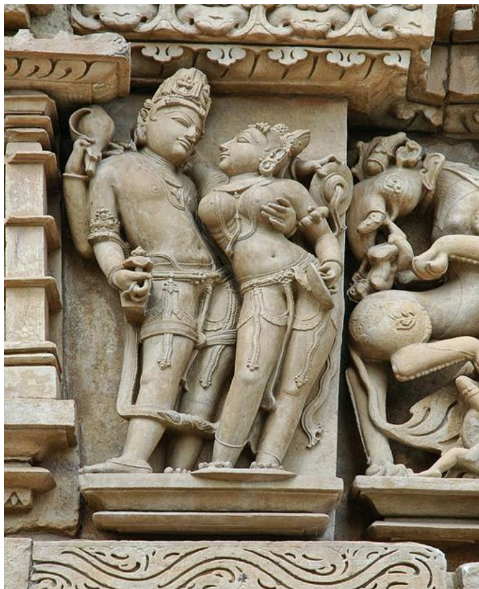
Ил.16. Храм Кандарья-Махадева. Одна из многочисленных скульптурных композиций, украшающих стены храма

Любой зритель, фокусирующийся исключительно на «чувственной» стороне скульптур, теряет возможность насладиться одним из самых красивых храмовых комплексов, когда-либо созданных человеком. Приверженцы индуизма полагают, что «кама» (удовольствие и развлечения) является только одной из четырех жизненных целей (наряду со стремлением к богатству и успеху, нравственными обязательствами и долгом и, самой главной целью, – освобождением от круговорота жизней и вхождением в нирвану). Удовольствие должно быть естественным и радостным, но в меру сдержанным. Вероятно, поэтому количество «непристойных» работ на стенах храма равняется примерно десятой части.