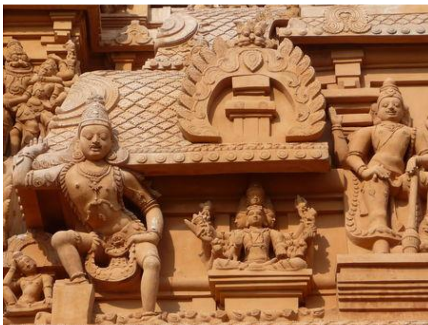
Ил. 13. Фрагмент стены храма Брихадешвара

Высоко над святилищем находится вимана – пирамидальная храмовая башня, увенчанная монолитным камнем весом семьдесят тонн, – одним из архитектурных шедевров Индии. Каким образом, без механических кранов, был поднят так высоко в воздух этот массивный камень, – до сих пор остается загадкой для современных инженеров. Правда, на расстоянии нескольких миль от храма находятся развалины пологого спуска, который, возможно, использовался для того, чтобы передвигать и поднимать этот камень, – с помощью слонов, канатов, рычагов и насыпных валов.