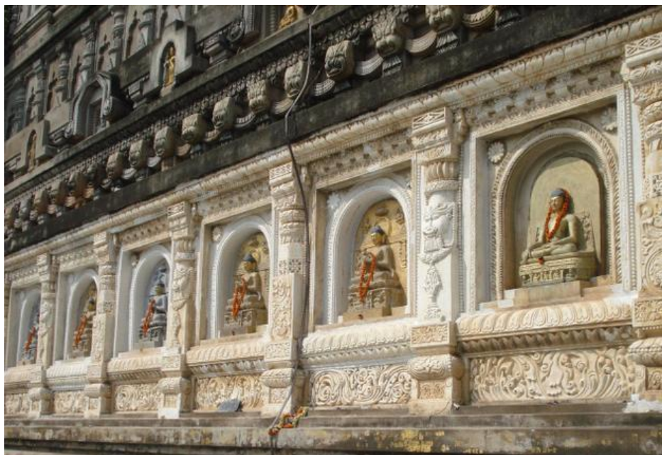
Ил. 4. Фрагмент стены храма Махабодхи

гочисленные отзывы паломников и туристов о храме как о памятнике «выдающейся ценности».