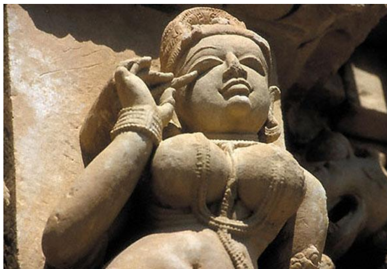
Ил. 15. Храм Кандарья-Махадева. Одна из многочисленных скульптур, украшающих стены храма

приподнятое основание, над которым поднимается богато украшенное скульптурными панелями здание. Всё сооружение увенчивается пучком башен с криволинейными контурами. Каждая башня символизирует «космическую гору».