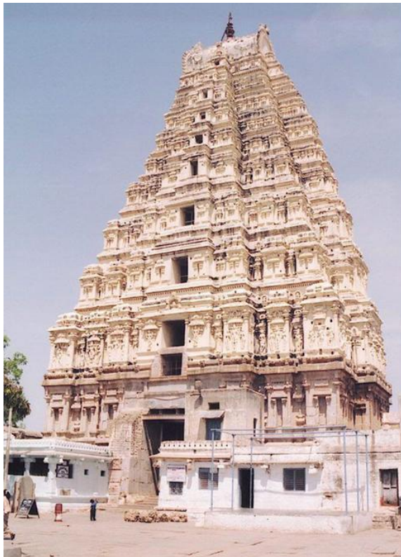
Ил. 6. Храм в Виджаянагаре

ся на территории в двести акров; кроме того, планируется построить два отеля, которые будут собственностью Профессиональной ассоциации гольфистов Британии. И всё это на фоне важности этой земли как религиозного центра, бедности региона в целом и серьезной нехватки водных ресурсов.