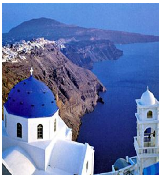
Ил. 5. г. Фира, о.Санторини

Из всех многочисленных греческих островов, привлекающих туристов своими великолепными пляжами, ценными достопримечательностями, богатством ландшафтов, Санторини выделяется особо.