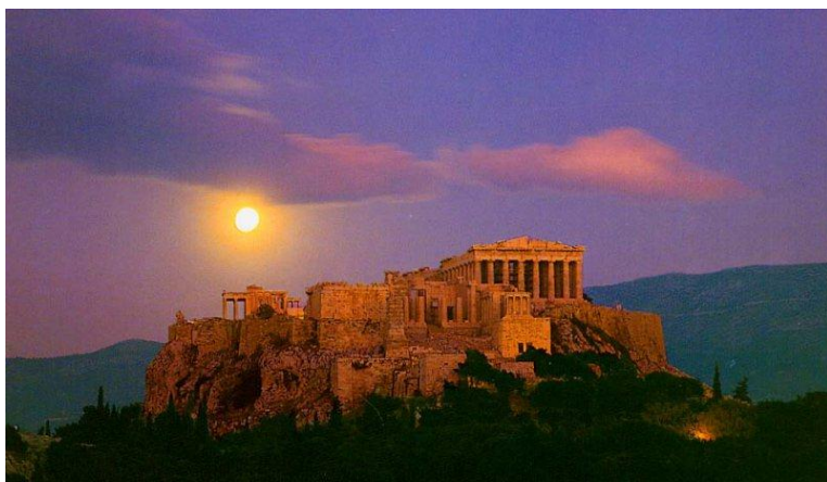
Ил. 3. Акрополь

Большой интерес для иностранных туристов представляет собой столица Греции – Афины – колыбель западноевропейской цивилизации, которая переживала различные времена – от центра мировой культуры до почти полного упадка и забвения. Сегодня греческая столица является туристической Меккой. Побывать здесь и прикоснуться к наиболее важным вехам развития цивилизации считают своим долгом туристы из многих стран. Немногие знают, что Парфенон – известный всем античный храм Девы, находящийся на Акрополе, – использовался для языческих обрядов всего 830 лет, а потом более тысячи лет служил христианским храмом. Если Афины считаются городом античности, то северная столица Греции – город Салоники – это памятник византийской культуры, в котором до наших дней сохранились храмы раннехристианской эпохи (базилики Панагии Нерукотворной, Святого