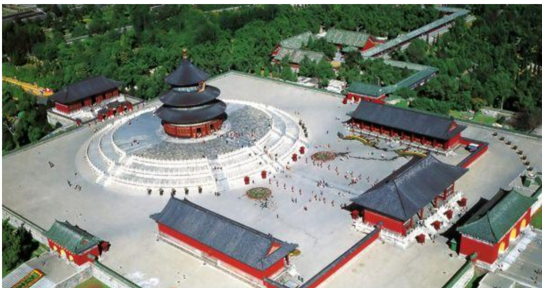
Ил. 12. Храм Неба. г. Пекин, Китай

претном городе» нет системы печного отопления. Отопление помещений осуществляли расположенные под полом жаровни, которые отапливались древесным углем и не выделяли дыма и запаха. После свержения в 1911 году королевской династии Цинь уникальная коллекция предметов искусства перешла во владение Китайской Народной Республики. На ее основе был создан музей под названием «Бывший императорский дворец» или «Гугун». Сегодня «Запретный город» – одна из главных достопримечательностей Пекина. Его сооружения часто используются для съемок фильмов о жизни китайских императоров [14].