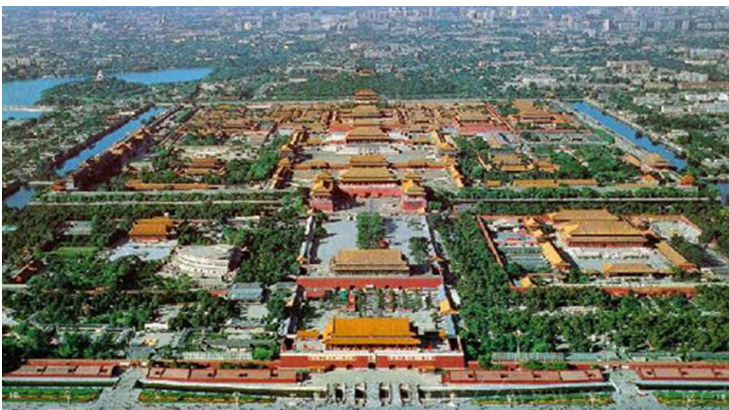
Ил. 11. «Запретный город». г. Пекин, Китай

вершине расположились буддийские храмы. Вдоль озера протянулась 728-метровая Длинная галерея Чанлан. Ее уникальность состоит в том, что она полностью выполнена из дерева. На стенах галереи висят около 8000 пейзажей и иллюстраций к произведениям китайской классической литературы. Галерею украшают бронзовые фигуры драконов и львов – символов императорского могущества. Недалеко от Длинной галереи Чанлан находится другой не менее удивительный павильон – «Мраморная ладья». В нем когда-то любила обедать императрица Цыси. Разрушенное в 1860 году, это сооружение было восстановлено спустя 33 года. Сегодня павильон больше похож не на ладью, а на огромный пароход с зеркалами и декоративными гребными колесами.