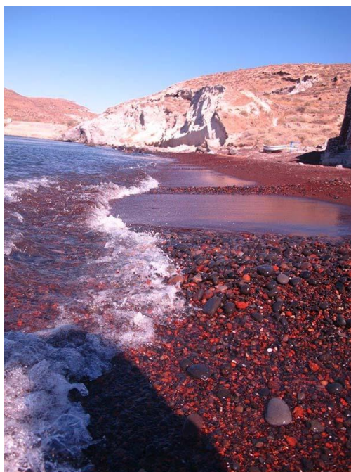
Ил. 6. Красный пляж о.Санторини

Чтобы увидеть, какой была жизнь на острове до извержения, туристы должны посетить местечко Акротири , где уже несколько десятилетий ведутся раскопки древнего города. Трехэтажные акротирские дома, имевшие канализацию, свидетельствуют о развитой цивилизации. Случайно обнаруженное в 1967 году поселение минойского периода стало одним из важнейших археологических открытий в мире. Здания в местечке Акротири прекрасно