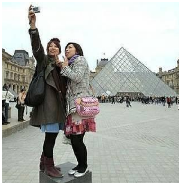
Ил. 9. Париж принимает китайских туристов

Заметное развитие выездного туризма в Китае стало возможным благодаря глубоким политическим, экономическим и социальным изменениям в китайском обществе. Однако открытие границ поставило на повестку дня другой острый вопрос: каков имидж китайцев за рубежом? Дело в том, что многие китайские туристы ведут себя за границей неподобающим образом. За рубежом о богатых китайцах ходят легенды. Они не только с легкостью, достойной лучшего применения, наносят граффити на памятники истории и культуры, такие, например, как храмы в Луксоре, но могут высказать недовольство своему туроператору по поводу знаменитого парижского отеля Ритц, заявляя, что срочно хотят заменить его на «менее старый, с более просторными номерами» [13]. В мире постепенно складывается отношение к китайским туристам, как к «плохо воспитанным людям». В связи с этим в Китае взяли за разработку «кодекса поведения китайского туриста за рубежом», который бы предписывал определенные нормы поведения.