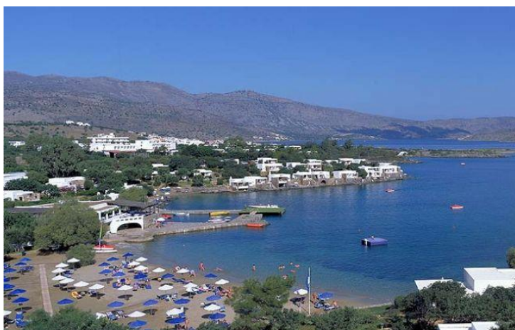
Ил. 7. о. Крит, Греция

Другой древнейший очаг цивилизации в Европе и одновременно крупнейший туристический центр Средиземноморья – это остров Крит . Азия, Европа и Африка – три нити, чудесным образом вплетенные в историю и жизнь греческого курорта. Крит – самый большой греческий остров, пятый по величине остров в Средиземном море, расположенный в 110 км от Европы, в 175 км от Азии и в 300 км от Африки.