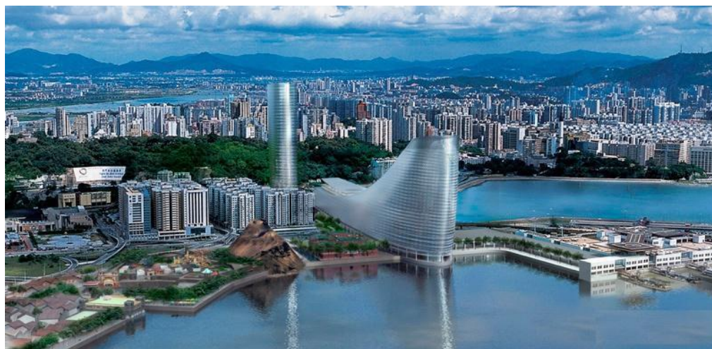
Ил. 14. Макао, Китай

культуре этого региона. Сегодня Гонконг несет в себе смесь азиатских и европейских черт, унаследованных от своего колониального прошлого. Китайские пагоды соседствуют здесь с английскими пабами, а католические храмы с домиками, построенными в традиционном китайском стиле. В течение предыдущих ста лет, развиваясь как крупный торговый и туристический центр, Гонконг вошел в состав новых индустриальных стран Тихоокеанского региона, проводя собственную экономическую политику. Туризм для него является крупным генератором иностранной валюты. Иностранцев в Гонконге привлекает яркая и насыщенная ночная жизнь (большое количество кафе, караоке-баров, ночных клубов), посещение оперных и драматических театров, музеев, конный спорт и ежегодно проводящиеся фестивали. Туризм в Гонконге носит в основном развлекательный и познавательный характер. Гонконг является также крупнейшим центром по проведению конференций и ярмарок. Жители Гонконга в основном проводят отпуск в Таиланде (90% всех отпусков), а бизнес-путешествия совершают на Филиппины, в Индонезию, Сингапур или Японию [11].