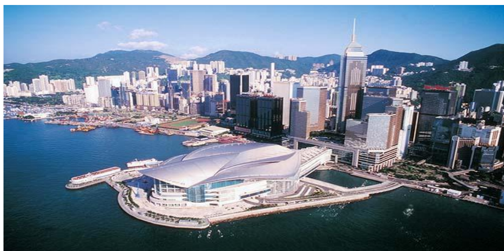
Ил. 13. Гонконг, Китай

Современный Китай состоит из 22 провинций, 5 автономных районов и 4 городов центрального подчинения, относящихся к «континентальному Китаю», а также двух специальных административных районов – Макао и Гонконга. Находясь под юрисдикцией Китая, они являются самостоятельными территориями [14].