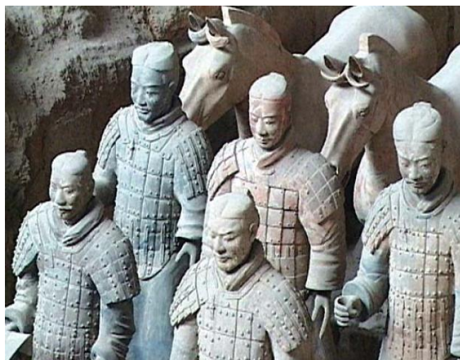
Ил. 8. Терракотовые воины

Китай – удивительная страна, с древнейшей историей, традициями, утонченной философией. Китайская цивилизация насчитывает не одну тысячу лет. Страна славится производством шелка, керамики и фарфора, великолепными королевскими дворцовыми ансамблями, гробницами императоров, хранящими несметные сокровища, Великой Китайской стеной, высоким мастерством бронзового литья. Поскольку с запада страна отделена от остального мира высокими горами, с востока и юго-востока – морем, долгое