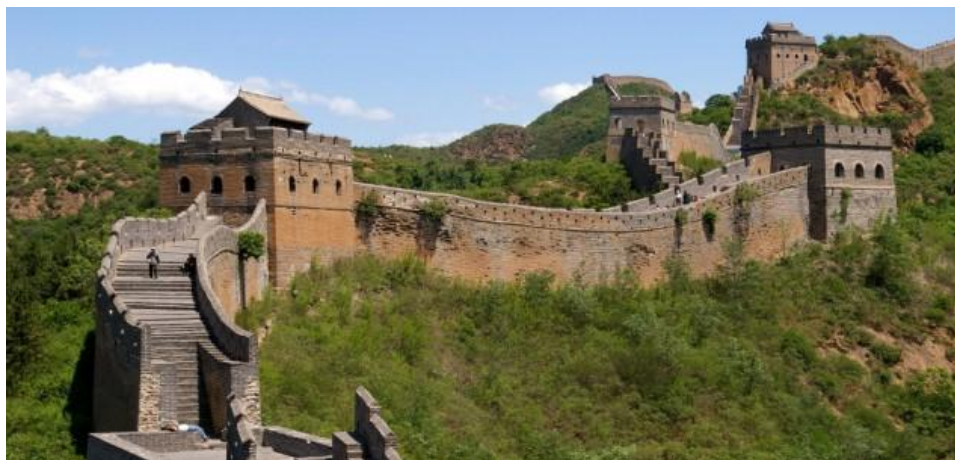
Ил. 1. Великая китайская стена

Развитие туризма в Греции и Китае имеет много как общих черт, так и различий. Греция – одна из колыбелей европейской цивилизации, Китай – яркая жемчужина Востока. Эти страны отличают неповторимая природная красота, благотворный климат и огромное число памятников истории и культуры, археологических объектов, многовековая история с богатыми и такими разными обычаями и традициями. И Китай, и Грецию посещает большое количество иностранных туристов. Сегодня их потоки с каждым годом все возрастают. Однако у каждой из этих стран свой непохожий путь развития туризма. Если в Греции традиционно на протяжении многих десятилетий большое внимание уделялось развитию туризма, то Китай в отличие от Греции долгое время был закрытой страной. И только относительно недавно, в конце 1970-х годов, началось становление туристической отрасли, когда благодаря проводимой политике реформ страна стала динамично развиваться. Появился мощный импульс для диалога культур с другими странами. В Китае были созданы условия для активного развития туризма.