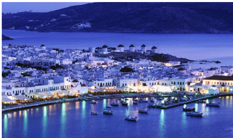
Ил. 4. г. Хора, о. Миконос

В 1970-е годы в жизни Миконоса произошло знаковое событие, кардинально изменившее жизнь острова. К Миконосу причалила яхта греческого миллиардера Онассиса, которому так понравился остров, что с его легкой руки сюда потянулись и другие богачи и знаменитости. Сегодня здесь отдыхают Гуччи, Rolling Stones и многие другие звезды. У