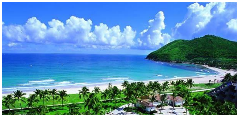
Ил. 15. о. Хайнань, Китай

27 декабря 2010 года правительство КНР изменило налоговую политику в отношении иностранных туристов, приезжающих на остров Хайнань. Отныне иностранные туристы получили возможность покупать товары на острове дешевле, чем граждане КНР. Остров Хайнань должен стать основным местом шопинга для иностранных туристов. Сейчас первенство в этом вопросе принадлежит Гонконгу. Здесь вас не будут принудительно возить на так называемые «фабрики», где китайские товары продаются по сильно завышенным ценам. Еще одно удобство для туристов – в Гонконге многие вывески дублируются на английском языке, и туристы могут самостоятельно посещать экскурсии, рынки, магазины без назойливой опеки гидов, как это происходит в курортных городах острова Хайнань. Не случайно, поэтому, в 2010 году иностранных туристов, прибывших в Гонконг, было в 100,5 раз больше, чем на остров Хайнань [15].