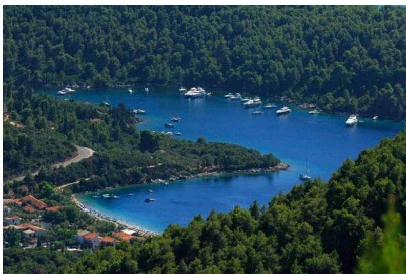
Ил. 2. о. Скопелос

Многие пляжи удивительно подходят для серфинга и виндсерфинга. В 2012 году 394 пляжа Греции были удостоены Голубого флага за чистоту берегов и кристальность воды. В последнее время наметилась тенденция к активному развитию круизного и свадебного туризма. Так, например, остров Скопелос занимает четвертое место в мире среди лучших сва-