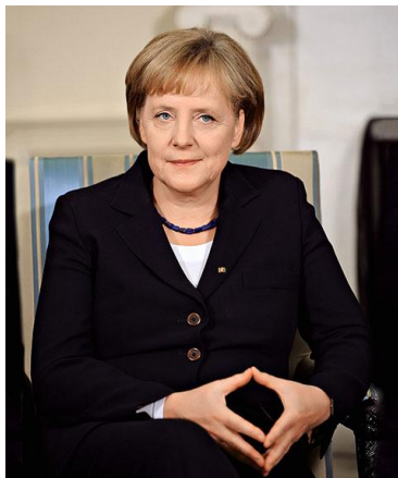
Ил. 2. Ангела Меркель

В январе 2007 года, спустя всего несколько недель после выступления Тони Блэра и за несколько месяцев до своего избрания на пост премьер-министра, Гордон Браун практически поставил все точки над «и», заявив, что по сути «мультикультурализм был ошибкой» [1]. 17 октября 2010 года канцлер Германии Ангела Меркель на съезде немецкого Христианско-демократического союза заявила, что «мультикультурализм в Германии полностью провалился» [1].