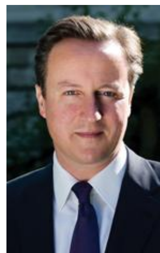
Ил. 3. Дэвид Кэмерон

Д. Кэмерон пояснил, что в Великобритании, придерживающейся доктрины мультикультурализма, «различные культуры сосуществовали независимо друг от друга в условиях, далёких от толерантности, что неизбежно привело к социальной сегрегации и не способствовало созданию таких условий, при которых граждане страны хотели бы в ней жить» [1]. Продолжая свою мысль, Дэвид Кэмерон уточнил: «Политика мультикультурализма нас подвела. Настало время либерализма с мускулами» [4]. По его мнению, «политика умиротворения экстремизма привела к появлению в Великобритании изолированных национальных общин, не желающих интегрироваться в британское общество. Надо открыто заявить об отказе от пассивной толерантности последних лет» [4].