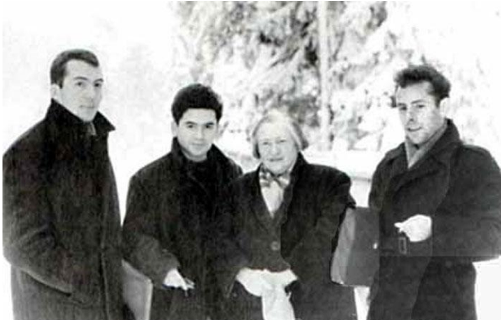
Ил. 4. Старая фотография: Андрей Битов, Александр Кушнер, Лидия Гинзбург, Яков Гордин (Комарово, 1962)