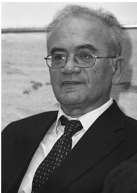
Ил. 5. На вручении премии «Литературный Вавилон» (2005)