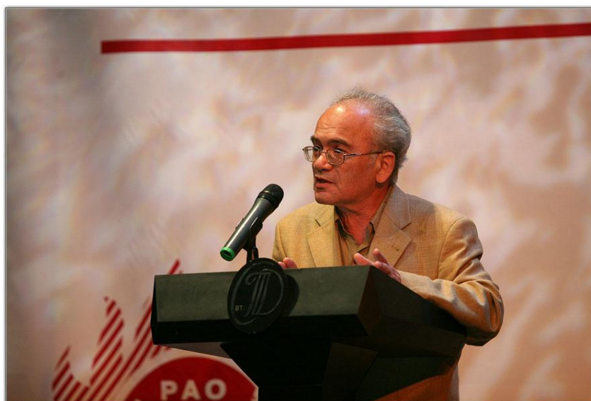
Ил. 2. На трибуне

расчеловечившихся хищниках и кровожадных психопатах, адреналиновых наркоманах или сектантах-кастратах. Его дело – стихи, лирика, то есть высокий мелос , мысль-чувство.