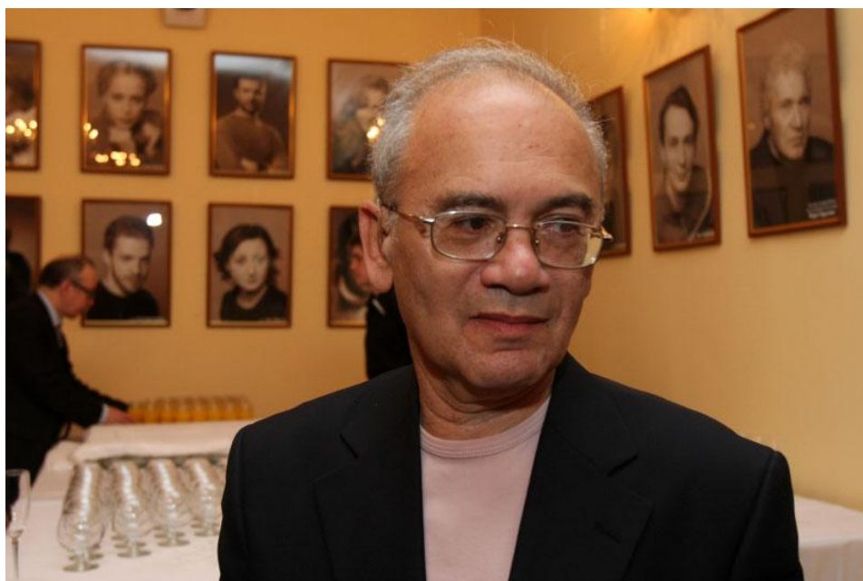
Ил. 2. На официальном мероприятии