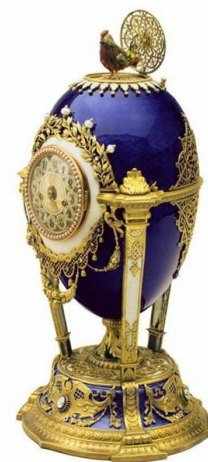
Ил. 8. Яйцо-часы «Петушок».

Сохранился и вернулся в Россию и другой подарок Николая II матери – яйцо-часы «Петушок», сделанное в 1900 г. Михаилом Перхиным. Циферблат часов (на фоне фиолетовой эмали) сделан в виде золотого лаврового венка, обрамленного алмазными и жемчужными ягодами. При нажатии на кнопочку (в верхней части яйца) – появляется кукарекающий и машущий крыльями петушок с рубиновыми глазками.