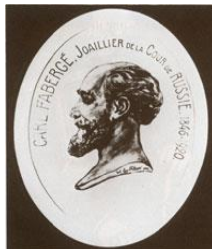
Ил. 9. Карл Фаберже. Рисунок Евгения Карловича Фаберже к 100-летию юбилею организации фирмы (1842–1942).

Ювелир, художник-дизайнер, реставратор и один из лучших предпринимателей своего времени, талантливый организатор, он превратил небольшую ювелирную мастерскую, доставшуюся ему по наследству от отца в самое крупное предприятие в Российской империи и в одно из самых больших во всем мире (мастерская была основана в 1842 г. в