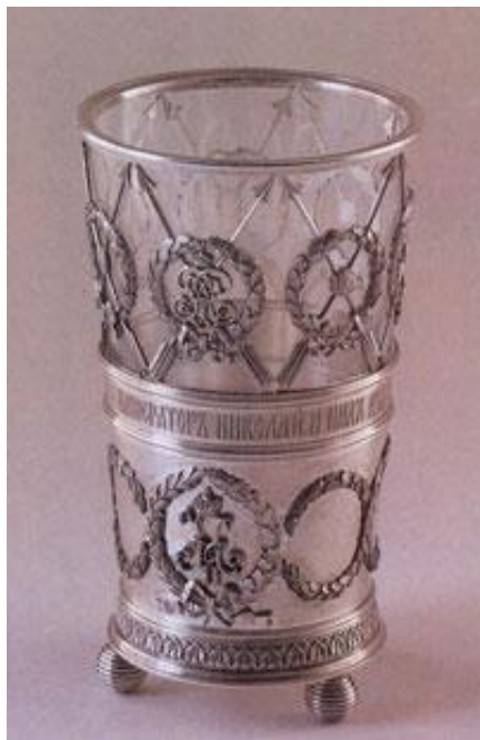
Ил. 10. Стакан (мастерская М. Перхина, С.-Петербург, 1898. Серебро, стекло. 14,4 x 6,0 x 6,0см).

После смерти мастера его эстафету принял Генрик Вигстрем, под руководством которого продолжали творить пасхальные чудеса.