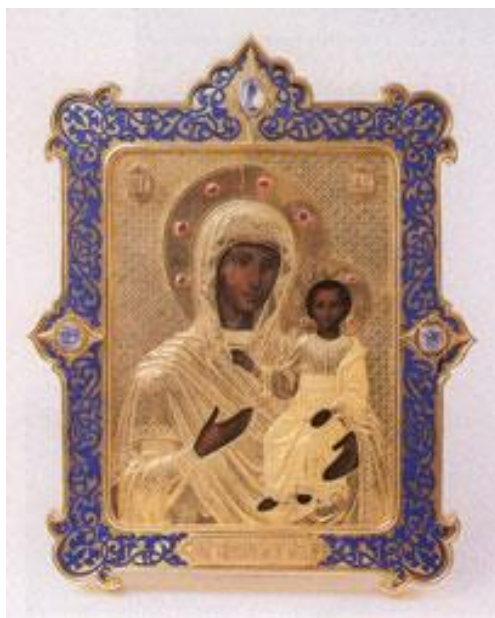
Ил. 11. Икона Богоматерь Смоленская в окладе (фирма Сазикова, Москва, 1854, серебро, сапфиры, рубины, эмаль, дерево, темпера, 25 x 20 см)

Фирма Сазикова, основанная как мастерская в 1793 г., специализировалась по производству серебряных изделий и считалась одной из лучших в середине XIX века. Она имела звание придворного поставщика и была постоянным участником международных и российских выставок. За индивидуальность и высокое качество продукции фирма удостоивалась множества различных наград и званий.