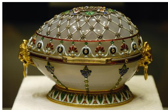
Ил. 7. Яйцо «Ренессанс».

Примечательно и яйцо «Ренессанс» – оно оказалось последним, которое императрица Мария Федоровна получила от Александра III незадолго до