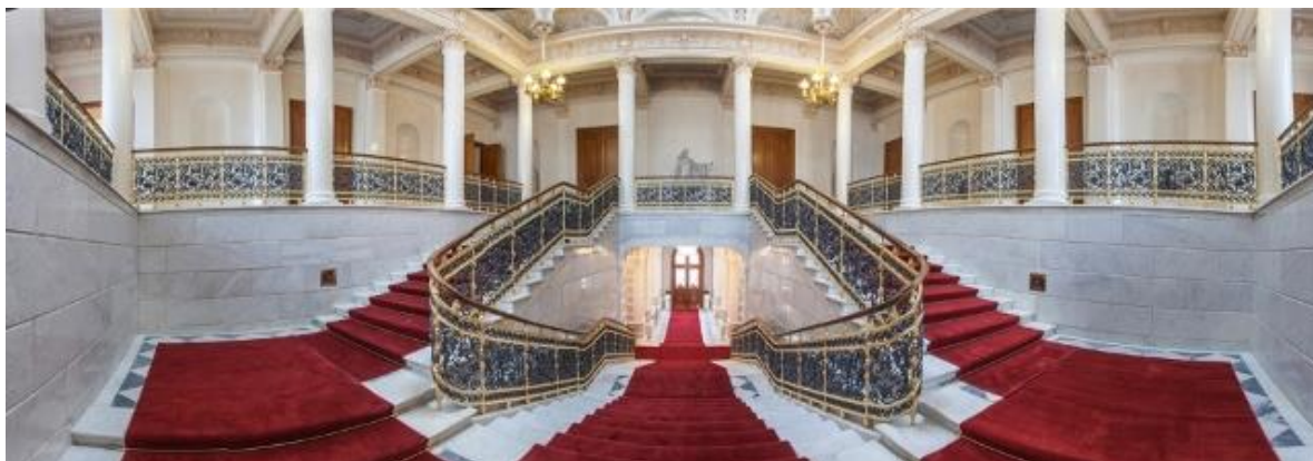
Ил. 1. Торжественная лестница

Имя Карла Фаберже до сих пор является одной из «визитных карточек» России.