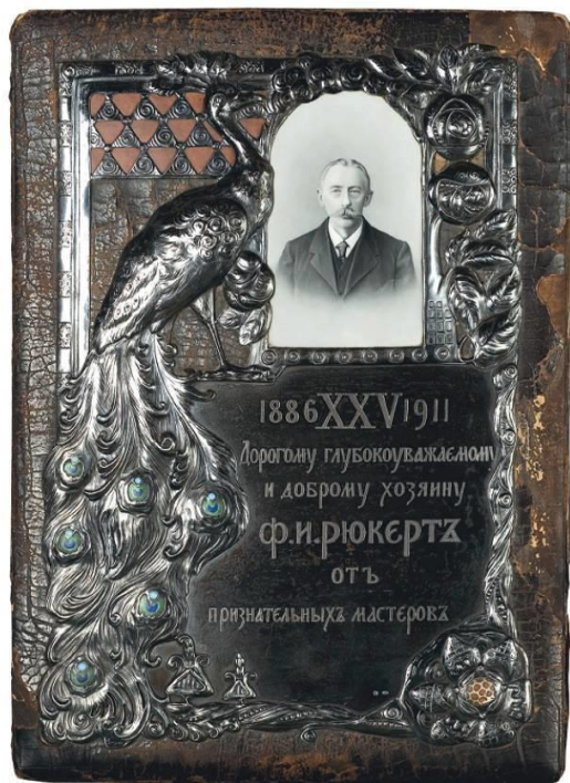
Ил. 13. Подарок, сделанный мастерами Ф.И. Рюккерту в честь 25-летия фирмы

вом возрасте. В 1886 г. мастер открывает уже свою фирму, в 1887 г. заключает договор о сотрудничестве с Фаберже и становится главным поставщиком эмалей в русском стиле для его фирмы.