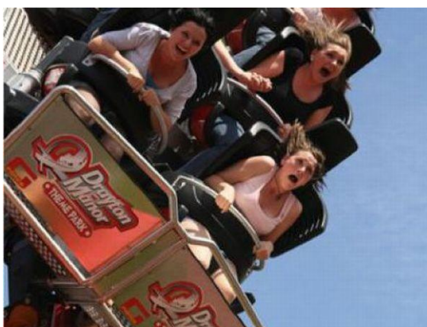
Ил. 6. На «американских горках»

Органичное включение в природную среду парка всех его программ обслуживания посетителей – от концертов до торговли – одна из важнейших задач «парковой политики». Но многие парки культуры и отдыха с этой задачей не справляются. В то время как традиционные эти парки – обязательная принадлежность каждого мало-мальски заметного на карте населенного пункта. В течение долгого