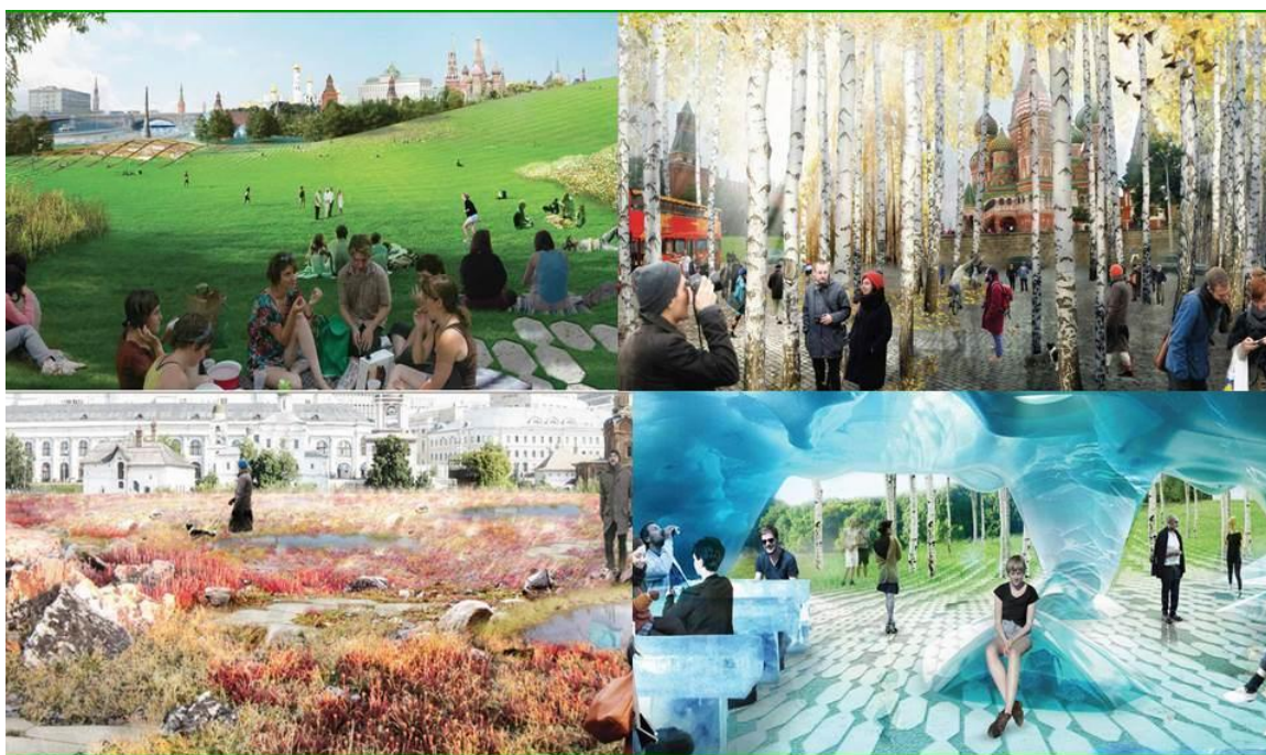
Ил. 3. Таким будет «Зарядье». Представление четырех природных зон: тундра, степь, лес, болото

конкурса на концепцию парка «Зарядье» была поставлена задача «сформировать принципиально новое представление о Москве и России». Конкурс по составу участников и финансированию сравнивают с крупнейшими мировыми архитектурными событиями последних десятилетий. Заявки на участие в нем пришли из 27 стран от 420 компаний. Победило международное объединение, в состав которого входят команды лучших дизайнеров мира из США, Дании, Италии, Германии и Великобритании и России.