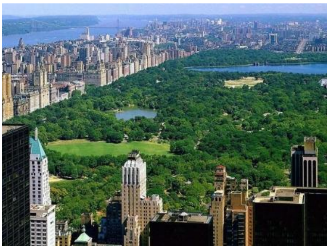
Ил. 4. Центральный парк – зона отдыха в центре Манхэттена – озера, зеленые лужайки и уголки нетронутой дикой природы, зоопарк и детские игровые площадки

«Мы дышим выхлопными газами, смотрим на в большинстве своем уродливые дома. Глазу негде отдохнуть, – продолжает другая участница дискуссии, специалист по ландшафтной архитектуре Ольга Воронина . – Горожанин, измученный городом,