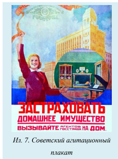
Ил. 7. Советский агитационный плакат

Например: «Пока ты здесь гуляешь, у тебя, может быть, горит квартира. Скорей застрахуй свое движимое имущество в Госстрахе». <...> «Нужно, чтобы гуляющие шли гуськом, в затылок друг другу, тогда обязательно перед глазами будет какой-нибудь плакат. Под