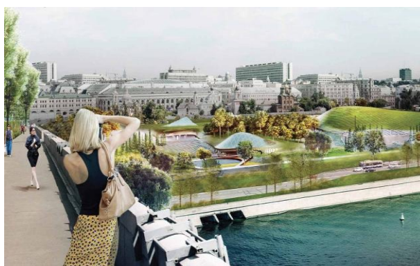
Ил. 2. Таким будет «Зарядье». Проект парка

Другой знаковой инициативой Правительства Москвы в области паркостроения стал проект парка «Зарядье» . После ожесточенных дебатов о судьбе «самого дорогого пустыря», образовавшегося на месте снесенной гостиницы