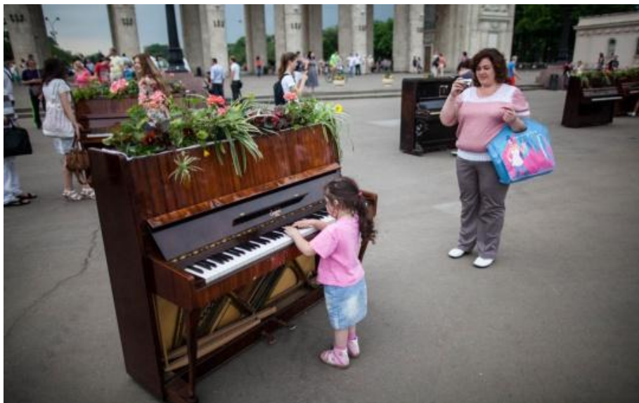
Ил. 1. В Центральном парке культуры и отдыха имени М.Горького