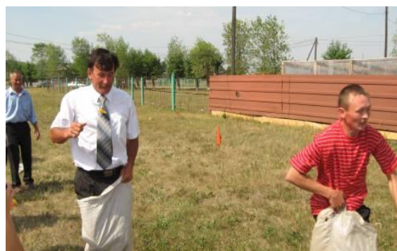
Ил. 8. Бег в мешках в районном парке культуры

Ради справедливости, надо сказать, что Ильф и Петров несколько сгустили краски. Было в советской биографии парков культуры и отдыха немало ярких страниц, значительных явлений культуры и искусства, даже художественных открытий. Особого разговора заслуживает деятельность талантливых авторов, режиссеров, композиторов, в разное время осуществлявших там поистине новаторские проекты: театрализованные представления, светомузыкальные спектакли, праздники фонтанов. В 1930-е на озере ЦПКиО был сооружен остров танца, где проходили феерические балетные спектакли. В роли декораций выступал окружающий пейзаж, впечатление усиливали световые эффекты. В эти же годы в Зеленом театре ЦПКиО состоялась легендарная постановка оперы «Кармен». Позже в Казани стали проводить замечательные светомузыкальные представления на открытом воздухе. И т.д. и т.п. В настоящее время в парках проводятся веселые праздники – новогодние, проводы масленицы, всевозможные праздники для детей, Но при этом специфика парка как уголка природы учитывается редко, и в этом особых открытий не наблюдается. Разве что проводят в некоторых парках День птиц. Культурные программы в парках не радуют новизной. В основном, это из года в год повторение пройденного, обновляемое лишь ростом числа блинных и шашлычных.