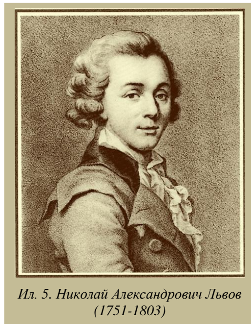
Ил. 5. Николай Александрович Львов (1751-1803)

Был такой замечательный человек Николай Александрович Львов – просветитель, художник, архитектор, инженер, фольклорист, живший в конце XVIII века. Он жил в Петербурге, а усадьба его была в Тверской области: Никольское-Черенчицы под Торжком. Будучи человеком отзывчивым, он построил для своих многочисленных родственников массу новых домов, дворцов, церквей, мостов. И вот я приехал в Торжок, потом был в Валдае, потом поехал в его усадьбу и всюду находил следы деятельности Николая Александровича. У него была совершенно замечательная усадьба с мавзолеем, погребом-пирамидой, кузницей в виде моста из валунов... К