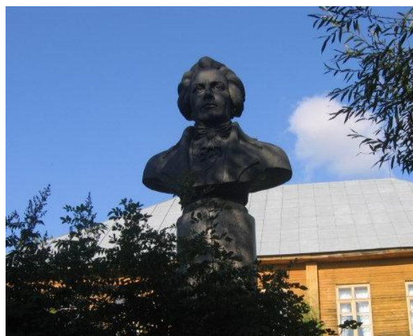
Ил. 3. Бюст А.Т. Болотову в д. Дворяниново Тульской области

Но в то же время Андрей Тимофеевич старался использовать и придуманные им новые для садово-паркового искусства подходы. Он использовал местные породы деревьев и кустарников, разработал оригинальную систему водоснабжения. В его парке были многочисленные пещеры, павильоны,