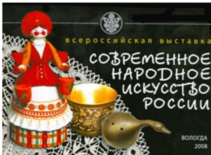
Ил. 3. Выставка «Современное народное искусство»

так», – сказал секретарь Союза художников России Геннадий Ларишев на «круглом столе», проходившем в Вологде в 2013 году по теме «Современное состояние народных художественных промыслов России и задачи по их сохранению, возрождению и развитию» [6].