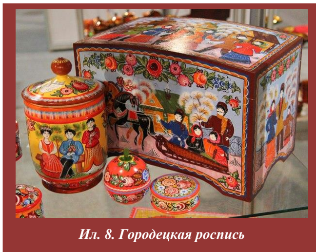
Ил. 8. Городецкая роспись

Красочные, колоритные экспозиции дополняют мастер-классы. На ярмарке можно своими глазами увидеть, как рождаются произведения народного творчества. В «Городе мастеров» – умельцы на глазах гостей ярмарки творят свое искусство. «Тут можно самому стать мастером — попробовать себя в гончарном деле, батике,