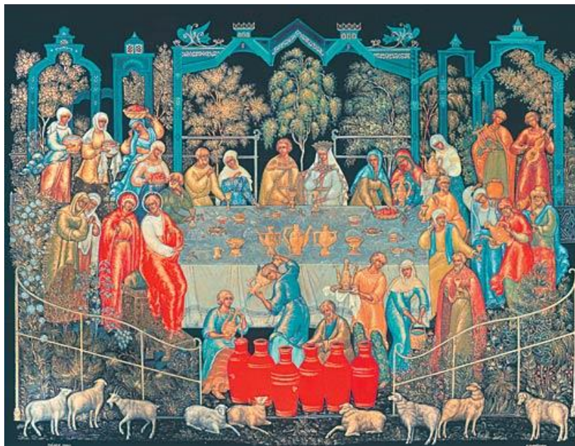
Ил. 2. Е.Ф. Щаницына. «Брак в Кане Галилейской» (1999, частное собрание)

Конечно, современные художественные промыслы – это в основном художественные производства, в отличие от народного искусства прошлого. Уже само их название, заменившее ранее признанное – «кустарные промыслы», характеризует их направленность на первоочередное решение художественных задач. Такое доминирование художественной функции в немалой степени является следствием развития нашей культуры, отмечают специалисты, ответом на проблемы современной предметной среды.