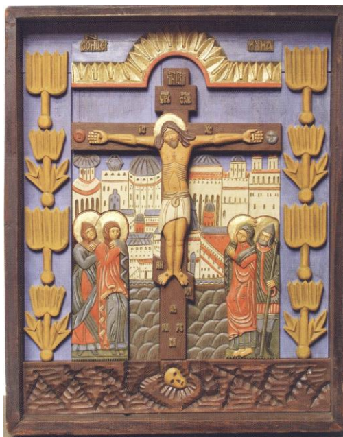
Ил. 5. Е.А. Зирин «Распятие» (2005)

Покорила любителей народного искусства на выставке тульская городская игрушка, облик которой зародился в бывшей тульской слободе Большие Гончары в XIX веке. Это глиняные статуэтки, одетые по моде того времени, изображали помещиков, генералов, офицеров, дам, духовенство, часто с сатирическим уклоном, обозначая недостатки того или иного сословия. Такие фигурки иронично называли «князьками». Промысел в Больших Гончарах просуществовал до революции. Затем игрушка была забыта, возрождение ее началось лишь в 90-е годы прошлого столетия.