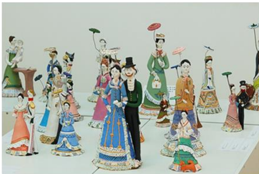
Ил. 4. Тульская городская игрушка на Всероссийской художественной

Ярким примером возрождения древней традиции стала и Ростовская финифть , щедро экспонировавшаяся на выставке.