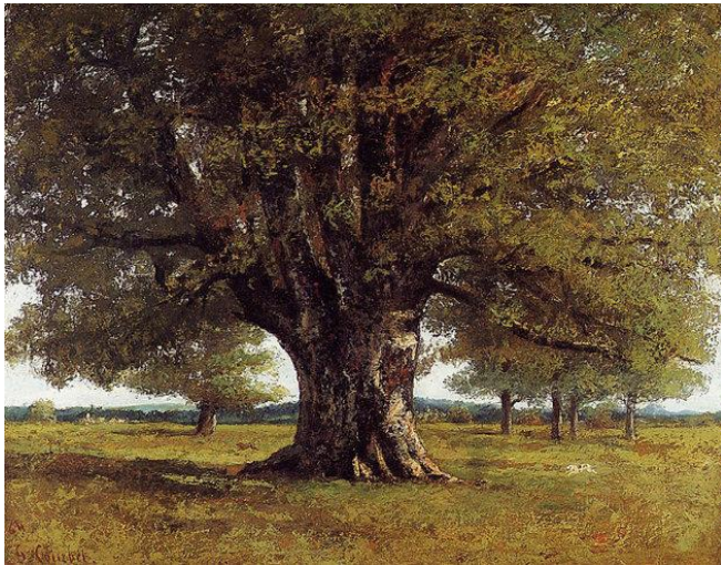
Ил. 2. Г. Курбе «Дуб Флаже»

самим фактом приобретения такого шедевра, но еще более «участием тех, благодаря кому оно могло состояться: государства, органов местного самоуправления, меценатов и многих частных лиц, пожертвовавших в ответ на наше обращение от нескольких евро до нескольких сотен и тысяч евро».