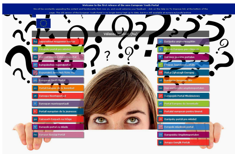
Ил. 1. Новая страница Европейского молодежного портала http://europa.eu/youth/splash_en

Проблемы молодежи – а в европейских политических документах к молодежи обычно относят людей в возрасте от 13 до 30 лет; в статистических описаниях молодежи могут использоваться и иные возрастные деления – относятся к числу европейских политических приоритетов. Построение новой экономической модели, в основе которой лежит развитие творчества, инноваций и образования, а также широкое использование цифровых технологий, как и само будущее Европы, напрямую зависят от молодежи, что было признано в «Обновленной социальной повестке» Европейского союза (ЕС), направленной на создание новых возможностей для его граждан (2009). В рамках социальной политики ЕС начиная с 1988 года осуществляются специальные программы, направленные на поддержку молодых людей, предоставление им широких возможностей и в сфере образования, и в сфере занятости. Основными принципами этой политики были укрепление активной гражданской позиции и развитие различных форм деятельности молодежи, ее социальная и профессиональная интеграция, учет вопросов молодежной политики при определении целей и задач развития иных социальных сфер (здравоохранение, борьба с дискриминацией и т.п.).