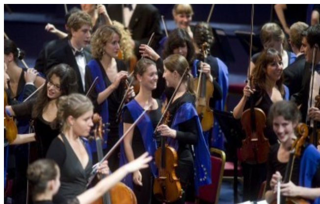
Ил. 2. Молодежный оркестр Европейского союза

Проведенное по поручению Еврокомиссии исследование доступа молодежи к культуре в 27 странах-членах ЕС (2009) показало, что зачастую доступ к культурным благам рассматривается лишь как форма организации молодежного «досуга», а собственно «культурная политика» ориентирована в большей мере на приобщении молодежи к «классическим» формам искусства и культурному «наследию», а не на развитие современной культуры и новых форм творческой активности, основанных на использовании медиа. Исследование также подтвердило, что основным препятствием для доступа молодежи к культуре является недостаток денег, времени, транспортные проблемы, социальные факторы, уровень образования, предвзятое отношение к молодым и самих молодых к культуре. Кроме того, культурное предложение не всегда соответствует молодежным запросам [14, p. 104]. Изучение системы ценностей современного молодого поколения показало, что важными ее составляющими являются дружба, взаимное уважение, терпимость и солидарность.