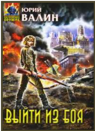
Ил. 3. Отчаянная Катерина (в известном смысле наследница Женьки, героини писателя Б. Васильева и актрисы О. Остроумовой, сыгравшей сходную роль в фильме С. Ростюцкого «А зори здесь тихие») выполняет задания руководства в смежной реальности прошлого.

Постмодерн, как известно, сам по себе есть «антиценностная», паразитическая по существу форма глобализации, и не случайно на сегодняшний день это литературно-антихудожественное течение является самым востребованным, самым популяризируемым и финансируемым. Наиболее опасно в нем сочетание «рыночно-произвольного» фантазирования с «натуральным» реализмом, – и «мифологически-сюрреалистическим», и принципиально приземленным, сразу «магическим» и вскормленным на модернистской