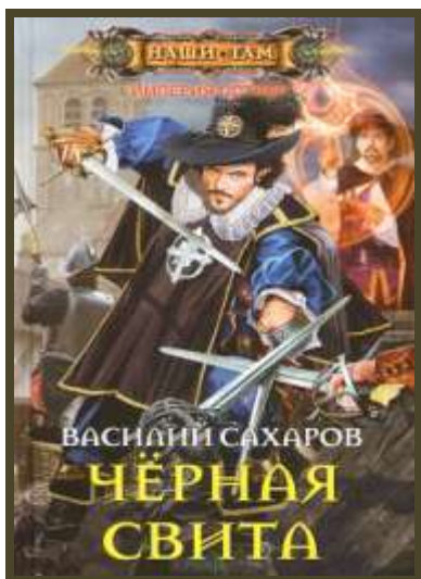
Ил. 10. Вторая книга того же цикла. Д'артаньянистая, хотя из «мира меча и магии».

«обыграть». Получилось ведь, вопреки нытикам и маловеерам! Если кому-то хочется иметь в избытке не еду и патроны, а особняки, лимузины и яхты, как этому не поспособствовать?