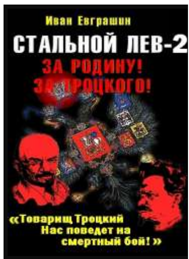
Ил. 5. Лев Троцкий в этом цикле не авантюрист – и не проходимец-«иудушка», по общеизвестному выражению Ленина, а «человек идеи», герой из нашего времени...

ненавистников монархии как таковой и семьи Романовых в частности – сторонниками «государя императора»! На фоне и без того официально-помпезных торжеств в честь 400-летия династии, полностью и окончательно себя скомпрометировавшей, невзирая на относительно недавнее «производство в святые мученики» Николая Кровавого, еще и это вранье, – вроде «господа офицеры, давайте стоя споем “Боже, царя храни”!». Как известно, недаровитого, мягко говоря, царя-батюшку «спихнули» не столько думские деятели, сколько его же генералы, и «знаменем реакции» он в 1918 году послужить не мог, поэтому и версия «заговора Свердлова» так обстоятельно обыгрывается в книгах, посвященных революции и гражданской войне. В самом деле, если сегодня очевидно, что бронепоезда и арtdивизионы красных при умелом командовании могли очень быстро «навести порядок»,