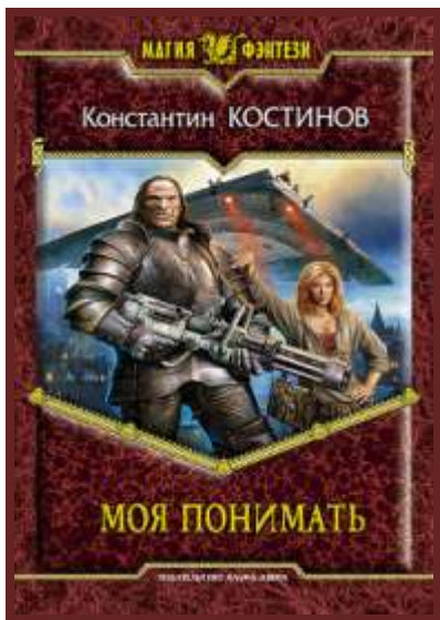
Ил. 8. «Моя понимать» – обложка второй книги приключенческо-фэнтезийно-детективного цикла К. Костинова «Моя не понимать».

Попаданцы случаются разные, некоторым это счастье поперек горла. Так, трилогия О. Измерова «Дети Империи» (2013) местом действия имеет Брянский регион. Формально это всего-навсего «пародия»... Реалистичная, выверенная художественно-образно во всех