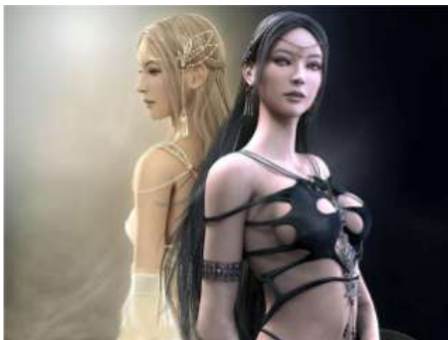
Ил. 1. Магическая реальность – фэнтезийно-мистические миры, далекие от прагматических насущных проблем и приземленного быта, зато соответствующие запросам очень молодых людей.

У начальства западной цивилизации есть две дороги. Первая, фантастическая – технократическое преобразование всего мира на основе понимания единства человечества и его интересов. Вторая – восстановление контроля привилегированного меньшинства над большинством, <...> восстановление монополии на человеческое развитие.