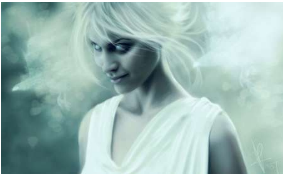
Ил. 2. Совмещение вымысла и реальности легче всего устанавливается через женскую красоту, – в ней порой и впрямь есть нечто «мистическое», даже если отсутствует «доброе начало», наличествует лишь «гордыня силы».

РФ сдавать свои суверенные позиции. На известных условиях «новые русские» вроде бы готовы влиться в элиту мировую, хотя понятно, что банду «ельцинских миллиардеров» очень легко надуть – как в свое время «команду Горбачева», мечтавшую добиться того же «великого счастья» под флагом «перестройки» с лозунгом «Европа от Атлантики до Урала». Сегодня война, как в эпоху Киплинга, стала из возможности реальностью, все ближе подходящей к границам России, борьба предстоит нешуточная. Неофеодальные тенденции перетекают в РФ из США и ЕС, это очевидно по электронным публикациям, в том числе и научным, имеющим идеологический посыл, но Запад нам, как известно, не указ, и без него имеются славно-православные традиции неофеодализма, – «технобюрократического» и этномафиозного, уголовно-олигархического и сословно-корпоративного, ортодоксального и радикального... Это проще всего увидеть-определить через современную российскую литературу, в особенности через публикации «рыночного» жанра – фантастики.