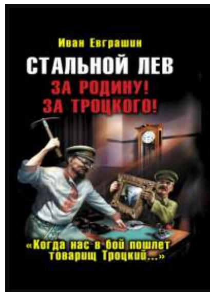
Ил. 4. Товарищ Троцкий мух не ловит, хотя данная обложка книги совершенно не соответствует ее содержанию, поскольку «лев революции» идет на прочный идейный союз с Лениным и Сталиным.

В самом деле, ну смешно же полагать белогвардейцев – в подавляющем большинстве