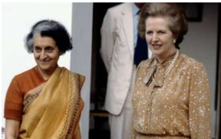
Ил. 10. Тэтчер с Индирой Ганди – единственной женщиной, которой она восхищалась

На волне фолклендской победы Маргарет во второй раз возглавила правительство. Она выиграла жестокую 51-недельную битву с профсоюзами, лишив их бывшего могущества, а сотни тысяч английских шахтеров работы; чудом уцелела во время покушения на неё ирландских террористов из ИРА и...возомнила себя Матерью нации.