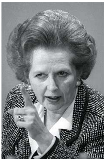
Ил. 1. Маргарет Хильда Тэтчер (1925–2013)

«Я родилась для того, чтобы работать, – любила повторять Маргарет Тэтчер. – Работа для меня – самое большое удовольствие» [1]. Знаменитой Эм-Ти (как называли ее в народе) удалось то, что оказалось не под силу ни её соотечественницам; ни представительницам континентальной Европы; ни огромному большинству британских политиков-мужчин и даже выдающимся партийным лидерам.