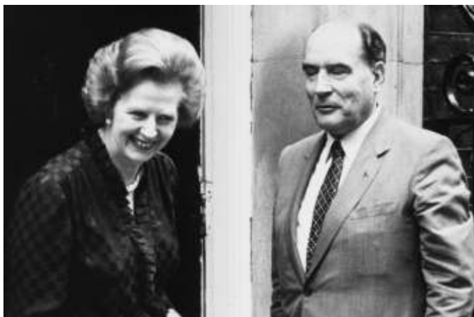
Ил. 9. М. Тетчер и Ф. Миттеран

Авторитарный премьер вывела из правительства несогласных, получив вместо кабинета министров «эхо-камеру». Весь мир облетела её фраза: «Я могу быть очень терпеливой при условии, что в конце концов все будет по-моему» [6]. Рейтинг Тэтчер катастрофически упал. Кресло под премьер-министром зашаталось. «Железную леди» выручила маленькая победоносная война.