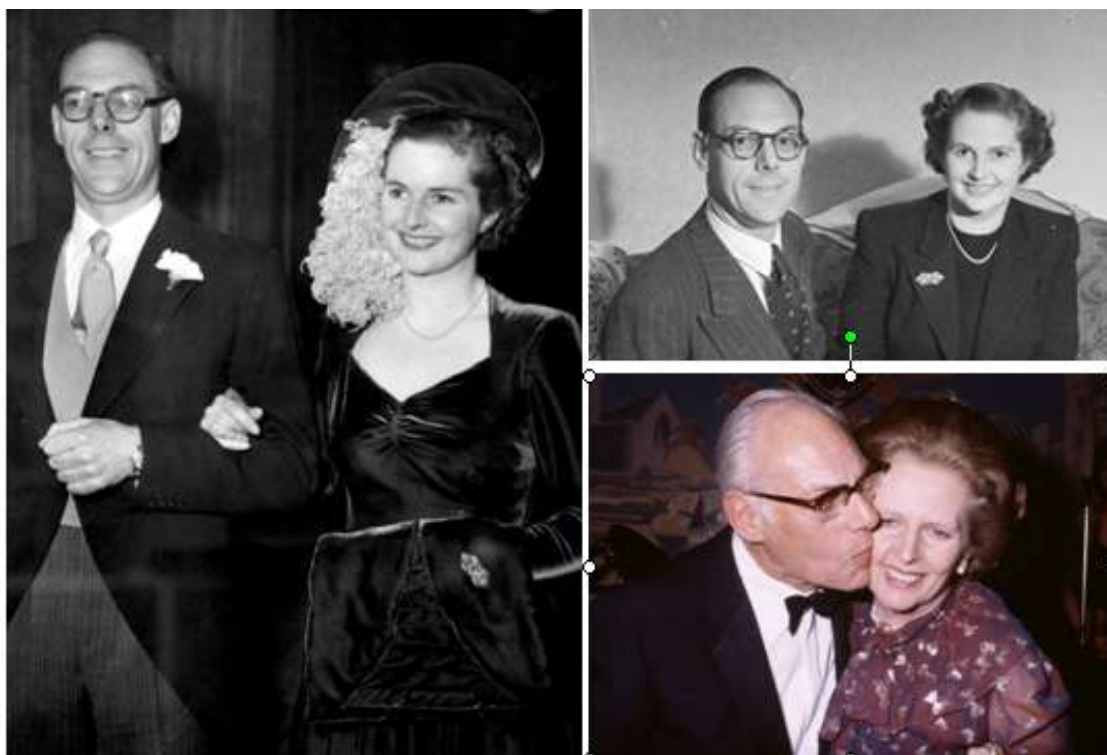
Ил. 4. С мужем Дэнисом Тетчером

«Она была красива, очень добра и умна, – вспоминал он спустя годы. – Кто бы мог, познакомившись с Маргарет, не быть сраженным ее личным обаянием и интеллектуальным блеском?» [3, с. 82].