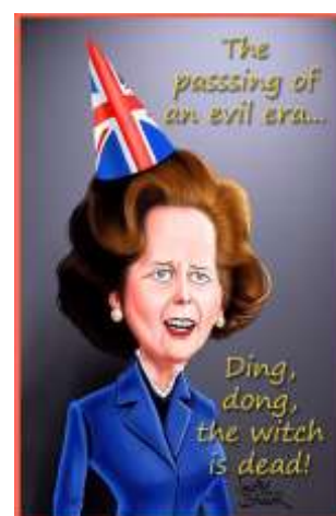
Ил. 18. Конец эпохи зла... Динь-дон, ведьма умерла!

Множество англичан, на себе познавших все прелести политического руководства врага профсоюзов, трудовых прав и социальных гарантий, встретили это событие на улицах городов Великобритании, распевая песенку из старого фильма «Волшебник страны Оз»: «Динь-дон, ведьма умерла».