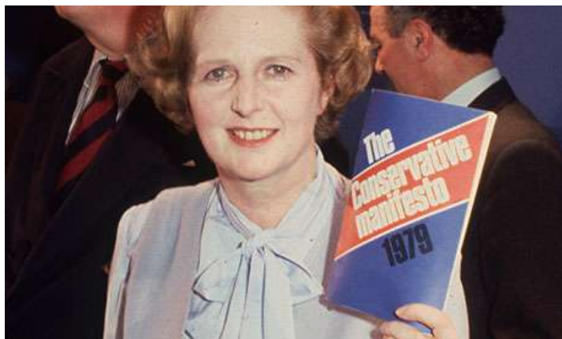
Ил. 8. (Брошюра «Консервативный манифест. 1979)»

Маргарет нарабатывала политический капитал, выступая с речами, в которых излагала свои взгляды. Тогда же она с блеском провела парламентские дебаты с министром финансов Хили, самым грозным полемистом в лейбористской партии. Virtuозно расправившись с противником, Маргарет оказалась в центре внимания прессы, восторженно писавшей, что «партии тори нужно иметь побольше таких мужчин, как она».