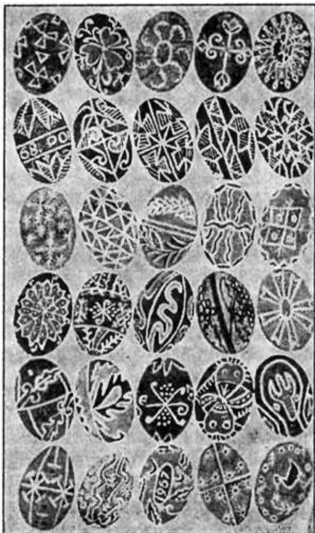
Ил. 4. Украинские писанки.