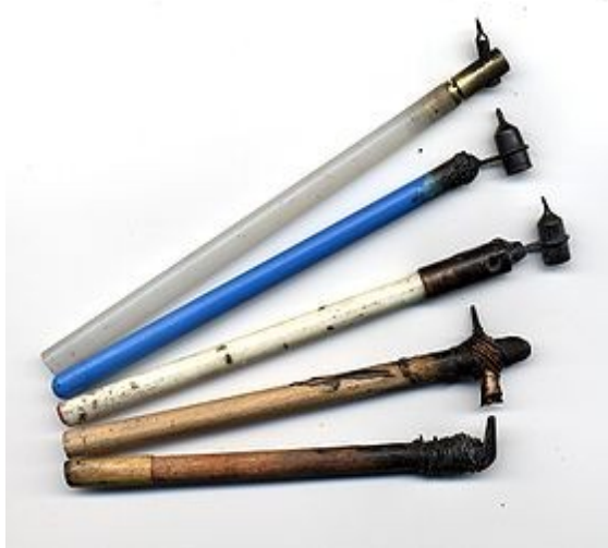
Ил. 7. Различные писачки: от древних традиционных до современных.