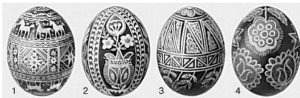
Писанки: 1—2 — гуцульские; 3 — румынская; 4 — чешская.

упырями и мертвецами-навьями. Миф говорит об извечной борьбе жизни и смерти, добра и зла. До той поры, пока никто не ведет борьбы со злом, не посягает на скрытую, но существующую внутри мира (в яйце) потенциальную гибель Зла, оно бессмертно, и только героические подвиги, отважное самопожертвование человека и содружество его с живыми силами природы ("благодарные животные") могут доказать, что жизненное начало вечно, что жизнь в мире торжествует над умиранием отдельных частиц мира» [1]. Обобщая, скажем: для наших предков яйцо было калькой Вселенной.