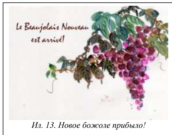
Ил. 13. Новое божоле прибыло!