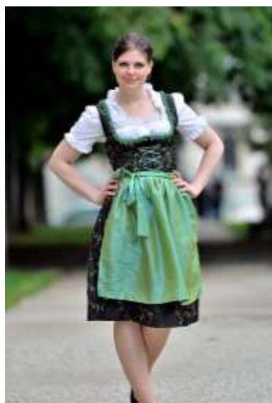
Ил. 11. Дирндль (нем. Dirndl). Женский национальный костюм немецкоговорящих альпийских регионов

кожаными корсетами на шнуровке и такими глубокими декольте, что пялиться на них для ценителей хмельного напитка – дополнительное удовольствие. Эти ловкие девушки ухитряются разносить по шесть, а то и по двенадцать литровых кружек сразу. Со всех сторон раздаются баварские «bit-tuh» («пожалуйста») и «dank-uh» («спасибо»).