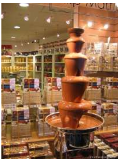
Ил. 17. Шоколадный фонтан.

пользовали в качестве лечебного средства при различных внутренних расстройствах. Теперь этим излюбленным лакомством сладкоежки доставляют себе «райское» наслаждение в счастливые моменты жизни. Но и сладким лекарством шоколад быть не перестал, миллионы людей заедают им раздражение, печали и горести. В Вербье это самое замечательное десертное лекарство или лекарственный десерт представлено во