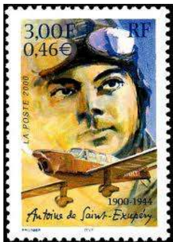
Ил. 2. Почтовая марка, выпущенная к 100-летию А. де Сент-Экзюпери во Франции.

Сент-Экзюпери начал писать от скуки, во время вынужденных занятий сугубо земным трудом. Тут судьба была к нему благосклонна, послав Антуану единомышленника в лице литератора Жана Прево. Сверстники оказались родственными душами: оба были храбрыми провинциалами, непокорными умниками, спешившими жить. Прево уже что-то значил в литературном мире благодаря публикации своей первой книги у «Галлимара», поэтому взял на себя роль, говоря современным языком, промоутера начинающего писателя.