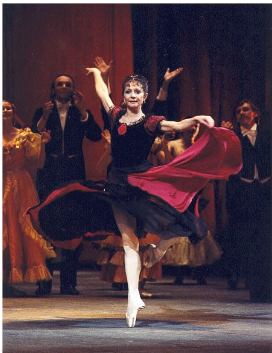
Ил. 4. Сцена из балета «Анюта» (Анюта – Е. Максимова, хореография В. Васильева, 1986).

необычайная музыкальность и умение раскрывать в пластике тончайшие оттенки человеческих чувств. Не ограничивая себя только одним жанром, в дальнейшем он ставит камерные вечера балета, в которых все определяет музыка и развитие чувств, а не