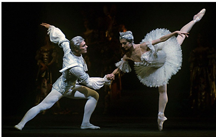
Ил. 2. Сцена из балета «Спящая красавица» (принц Дезире – В. Васильев, принцесса Аврора – Е. Максимова, 1973).

XX столетия по опросу ведущих специалистов мира В. Васильев был признан «танцовщиком XX века» [3].