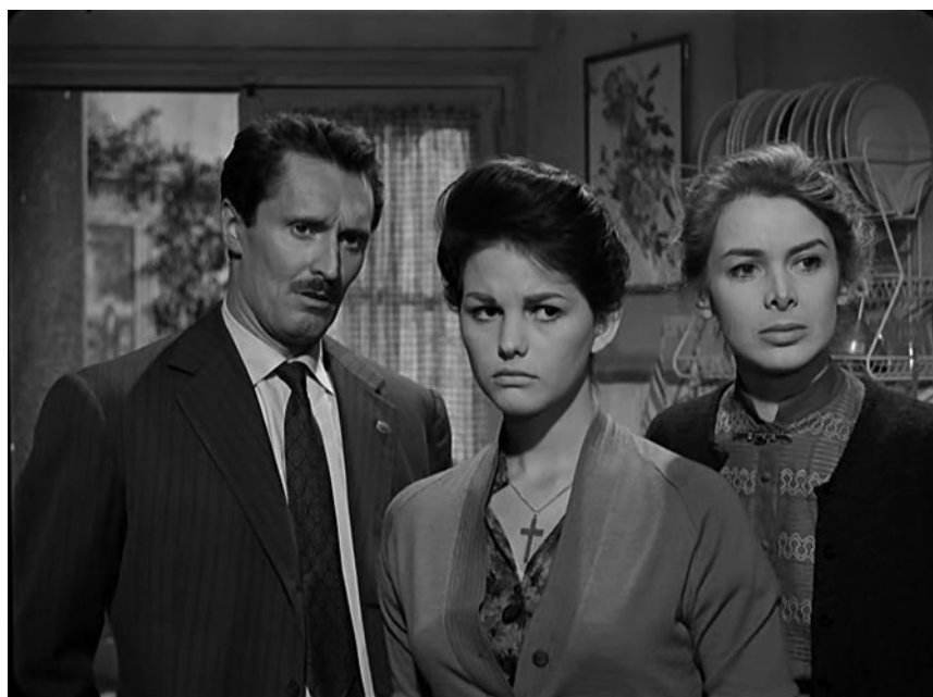
Ил. 5. Кадр из кинофильма П. Джерми «Проклятая путаница» (реж. П. Джерми, 1959).

Своей первой значительной картиной Кардинале считает «Проклятую путаницу» режиссера Пьетро Джерми, который научил ее азам актерского ремесла. Во время работы над фильмом он всегда был рядом, объяснял каждую сцену, раскрывал ее смысл, говорил, какие чувства Клаудия должна выражать в том или ином месте, даже научил начинающую актрису плакать перед объективом кинокамеры.