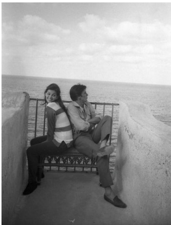
Ил. 8. Кардинале с Аленом Делоном.

На съёмках «Леопарда» повторилась попытка соблазнения дикарки. Только на этот раз вместо Матроянни был неотразимый Делон, который заключил пари с Висконти, что добьётся взаимности у Кардинале. «А Лукино забавляли садистские шуточки, и, давая мне указания во время любовных сцен с Аленом, он говорил: «Пожалуйста, Клаудина, давай без фальшивых поцелуев...», – рассказывает актриса. – Но я разгадала их маневр и сумела выкрутиться. В результате Лукино стал ценить меня больше: он понял, что я не девчонка, а сильная женщина» [2, с. 91].