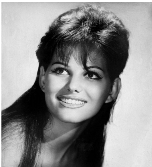
Ил. 1. Клаудия Кардинале (род. 15.04.1939).

(к 75-летию со дня рождения Клаудии Кардинале)