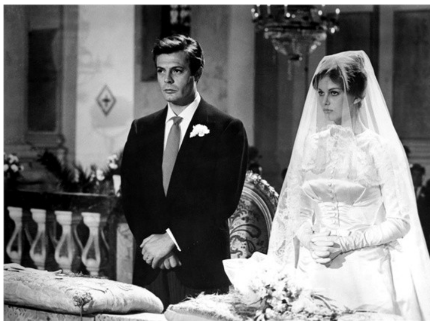
Ил. 6. С. М. Мastroяни в кинофильме «Красавчик Антонио» (реж. М. Болоньини, 1960).

Кардинале. – Обычно они отвечали ему взаимностью. Вспомним хотя бы Катрин Денев... Мastroяни был уже великой звездой и не мог понять, как это я отвергаю его ухаживания.