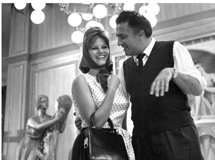
Ил. 10. С Ф. Феллини на съёмках «8 1/2» (1963).

ней: «Клаудия Кардинале обладает внутренним светом, который уничтожает вокруг все грязное» [3]. Феллини оказался первым, кто захотел оставить в фильме собственный голос «волшебницы», как он называл Кардинале.