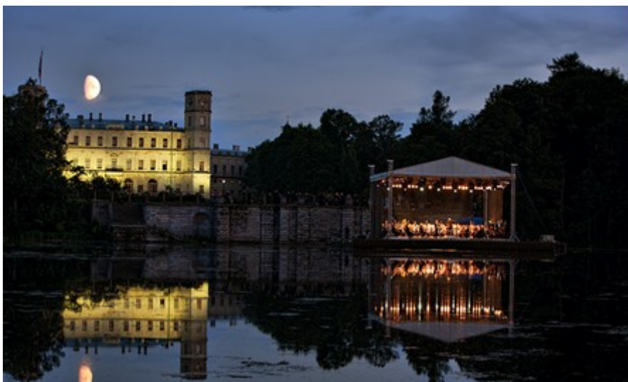
Ил. 4. Фестиваль в Гатчине.