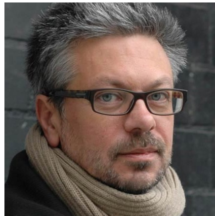
Ил. 4. Михаил Павлович Шишкин (р. 18.01.1961)

Как отреагировали братья Шишкина по цеху, писатели? Борис Акунин его поддержал. И все. Остальные, даже самые либеральные, самые протестнонастроенные, безусловно, разделяющие политические взгляды Шишкина, страшно обиделись. Потому что им показалось, что выглядит это так: Шишкин в белом, а мы – нет. Вот он больше не будет ездить на ярмарку, а если мы будем, значит, мы хуже. В самой мягкой форме эта позиция была высказана в стихотворении Дмитрия Быкова: «... Теперь для потомства, чей близится суд, он будет безгрешнее Папы, а мы, кто остался при Путине тут, выходит, конечно, сатрапы. Историки, нас извлекая из тьмы, решат в замешательстве тихом, что Шишкин с режимом боролся — а мы глотали икру по Барвихам...» За остроумием Дмитрий Львович (проявлявший бесстрашие уж никак не меньшее, чем Михаил Павлович, и проявлявший его здесь, в России) тем не менее не может скрыть понятной обиды, и, повторяю, что это самое мягкое высказывание на тему, были гораздо более жёсткие: «Как он смеет из своей Швейцарии нам указывать!» Между тем он никому ничего не указывал, он высказал свою точку зрения. Раньше он ездил, теперь не хочет. Имеет право. Он свободный человек. И так, никакого единения не произошло, наоборот, даже те, кто разделяет взгляды Шишкина, были возмущены, и это снова подчеркнуло предельную разобщенность даже единомышленников.