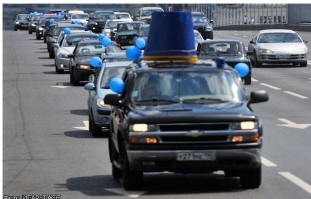
Ил. 6. Акционизм XXI века. Акция «Синие ведерки».

В мировом масштабе массовые акции организуют защитники природы. Чтобы привлечь внимание к проблеме изменения климата и энергосбережения, Всемирный фонд дикой природы каждый год в марте проводит Час Земли: в одно и то же время на один час во всех странах люди выключают электроприборы.