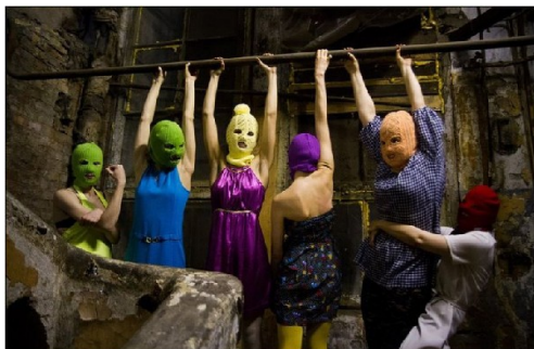
Ил. 1. «Pussy Riot»

Точка, в которой Pussy Riot появилась, находится на стыке политики, искусства, религии, философии, социальной и гендерной проблематики и многого другого. Девушки пробовали разные комбинации порошков и почти случайно изобрели порох.