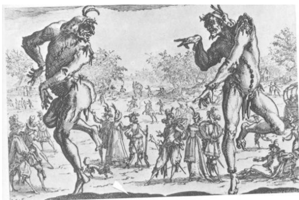
Ил. 9. Жак Калло. Два комедианта. Начало XVII века.

– культовых форм и церемониалов. Они давали совершенно иной, подчеркнуто неофициальный, внецерковный и внегосударственный аспект мира, человека и человеческих отношений <...>. Мир смеховых форм и проявлений противостоял официальной и серьезной (по своему тону) культуре церковного и феодального средневековья <...>. Пафосом смен и обновлений, сознанием веселой относительности господствующих правд и властей проникнуты все формы и символы карнавального языка. Для него очень характерна своеобразная логика “обратности” (à l’envers), “наоборот”, “наизнанку”, логика непрерывных перемещений верха и низа (“колесо”), лица и зада, характерны разнообразные виды пародий и травестий, снижений, профанаций, шутовских увенчаний и развенчаний. Вторая жизнь, второй мир народной культуры строится в известной мере как пародия на обычную, то есть внекарнавальную жизнь, как “мир наизнанку.