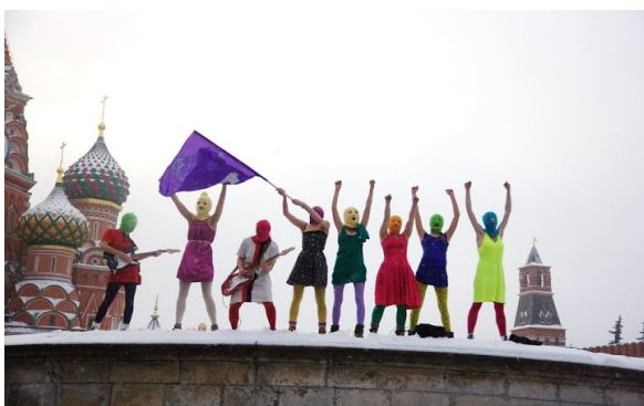
Ил. 10. «Pussy Riot» на Красной площади.

Никому не придет в голову обвинять в грубости и непристойности средневековый ритуал, перенесенный в наше время в неизменном виде и ставший традицией, передающейся из поколения в поколение в течение многих лет. Одной из таких традиций стало, к примеру, воспроизведение средневекового Венецианского карнавала по поводу окончания очередного учебного года в старейшем университете Венеции, с его нарочитой грубостью, нецензурной лексикой, пинками, обливанием жидким месивом из муки и воды.