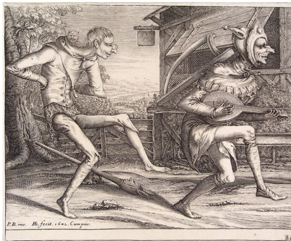
Ил. 8. Питер Брейгель старший. Гравюра XVI века

Действительно, у Бахтина и Лихачева можно найти характеристики средневековой культуры, сопоставимые с современным акционизмом. Сходство можно обнаружить в том, что средневековые «акции», «организованные на начале смеха, чрезвычайно резко, можно сказать принципиально, отличались от серьезных официальных – церковных и феодально-государственных