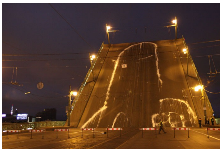
Ил. 4. Арт-группа «Война». «Лучшее произведение визуального искусства», удостоенное премии «Инновация».

экономического форума. Активисты группы нарисовали на Литейном мосту огромный фаллос. После того, как мост был разведен, поднятое изображение фаллоса оказалось перед окнами Управления Федеральной службы безопасности. Специалистами в области современного искусства акция была признана «впечатляющим, артистическим жестом, вполне в традициях и русского, и европейского современного искусства. Жестом, который настолько придает этой традиции масштаб, что может рассматриваться как академический пример развития этой традиции <...> Академическое – это значит воспринявшее все компоненты, наработанные наукой, традицией, искусством в данном случае, определенным его направлением. Это диапазон от дадаизма до стрит-арта, от Михаила Ларионова до сегодняшних арт-активистов <...>. Найден масштаб, найдена технология» [3].