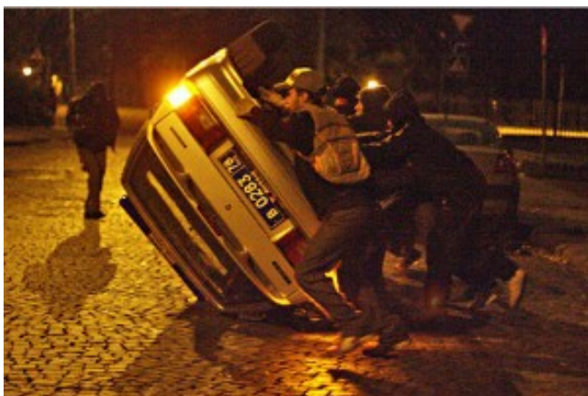
Ил. 3. «Дворцовый переворот» в исполнении арт-группы «Война».