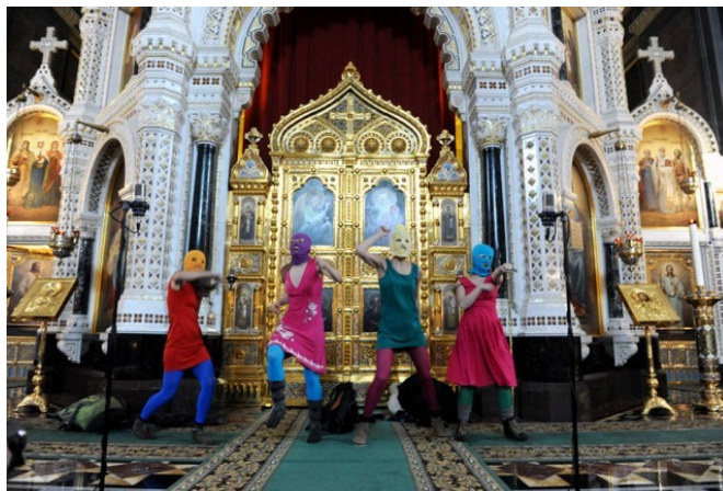
Ил. 2. Пляска на амвоне.

Наказали пусси только за панк-молебен, между тем как по сравнению с другими их «подвигами» он ничем особым не выделялся. Незамеченной блюстителем порядка осталась попытка такой же акции пусси в Елоховском соборе, да и на месте Храма Христа Спасителя могла оказаться любая другая «сценическая