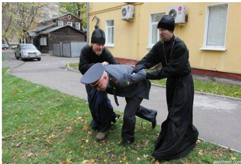
Ил. 5. Призвать к порядку можно и так...

«Эволюции культуры (культурогенезу, антропогенезу, гоминизации, очеловечиванию) предшествуют три других эволюции – физиосферы, биосферы и психики» [1, с. 14]. Эволюция в форме инволюции в «неразумной» природе – явление закономерное (например, утрата прежних эволюционных признаков, жабер или хвоста); предельная инволюция индивида (смерть) ради дальнейшей эволюции вида (самопожертвование) встречается и в человеческом обществе, однако не на уровне генетической запрограммированности. В случае же, когда происходит психическое вырождение, его можно проследить по психологической цепочке: страх – ненависть – депрессия – невроз – психопатия. Когда известные силы стимулируют в обществе эгоизм и презрение к созидательному труду, они формируют идеологические системы психического вырождения [1, с. 18] через мистицизм как прагматизм. Формула инволюции в религии – переход от бога к дьяволу, сатанизму как этическому принципу, поскольку целью существования человека становится не добро, творимое ближнему, а зло, хотя условно понимаемое добро может быть средством, подчиненным злу [1, с. 21]. Ассортимент сатанистских сект в настоящее время избыточно широк, они паразитируют на идеологемах едва ли не всех религий, почти на всех «окультурно-мистических» учениях, но главную роль в религиозной сфере все-таки играет привычный, традиционный антиэволюционизм... Это, пожалуй, самое главное, что роднит их с «религиями добра».