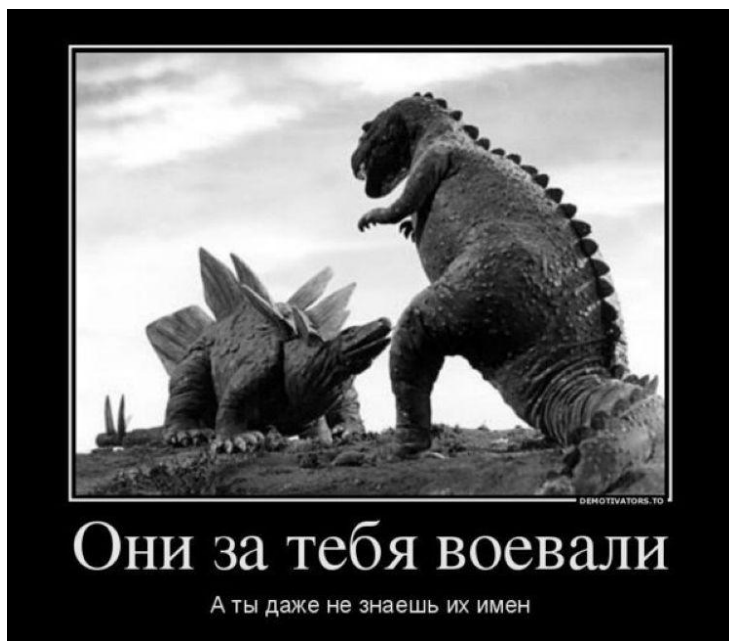
Ил. 7 (и 8). Презирают прогресс те, кто считает себя венцами творения - и, соответственно, унижает «лохов», которые воевали и погибли за светлое будущее.

Диверсии в «духовно-идейной» сфере (начиная с аксиологии – системы ценностей) и ненаказуемы, и престижны, а на предметные, конкретные обвинения в мошенничестве получаешь умеренно краткий, восхитительно кроткий ответ: «Я так вижу, это мое право! Я и все подобные мне уверены в своей правоте, а вы пагубно заблуждаетесь и тоталитарно навязываете свою точку зрения!». Права у современных мистагогов 1 – якобы те же, что у прочих граждан, но их «нравственное меньшинство» (по примеру других подобных меньшинств, скорее всего) стремится подмять всё, что возможно, включая оборонный комплекс. Они, конечно, могут ритуалами-заклинаниями, сглазом-порчей либо «копьем судьбы» низвергнуть любого супостата, – некоторые и сами в это верят. Чудотворными иконами можно, разумеется, заменять устаревающие ракеты и боеголовки, стратегическую авиацию и подводный флот, можно добить «оборонные» науки на радость благомыслящим людям в РФ и США, можно раздарить под видом очередной приватизации «остатки былой