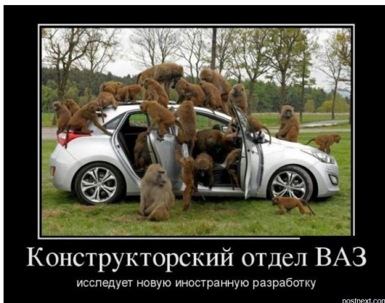
Ил. 6. Российские наука и технология с точки зрения «инволюционеров».

По-настоящему сочетать религию и науку, богословский инволюционизм и научный эволюционизм, нельзя. Можно провести параллели между эволюционизмом библейским и научным, но модернизировать Библию за счет научного эволюционизма – занятие неблагодарное, станешь чужаком для обеих сторон! Так, А. Мень усмотрел в Библии символическое изображение реальной эволюции – «Яхве по существу творил мир в эволюционной последовательности: физиогенез – биогенез – психогенез – культурогенез»... Это демифологизация религиозных истин, сопряжение науки и религии, введение «божественного разума» в эволюционный процесс, что означает уход от «чудес божьих» – первоосновы религиозно-мистического мировоззрения. «Онаучивание» Библии, тем не менее, тоже антиэволюционизм, особая духовно-интеллектуальная форма борьбы с научным эволюционизмом «на службе у инволюции духовной культуры» [1, с. 69]. Вывод таков: мифологизация реальности – это реставрация (и адаптация, и конструирование) заведомой лжи во имя «сна золотого», порождающего чудовищ, и гротескно-сатирический