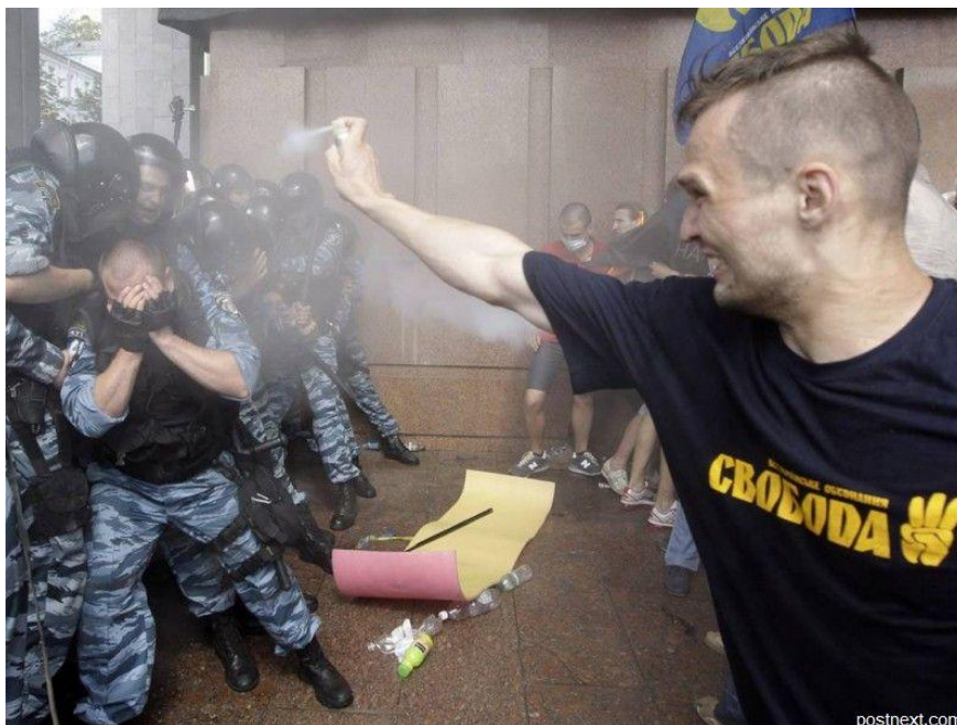
Ил. 2. Кто кому страж по «праву собственности»? «Новым либералам нужна дальнейшая приватизация – в том числе и в «сфере духа»...

Итак, в корне всего – истина и ложь, запрос на правду и «рыночный» обман. От этого зависит, состоится ли на деле «общегражданское сотворчество» («взаимодействие»), не обернется ли оно неофеодальной суггестией, – привычным «манипулированием быдлом»?