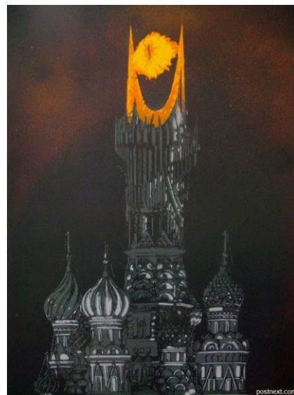
Ил. 4. Барад-дурость «эльфийская», воистину мистическая.

В религиозной сфере духовные позиции «борцов за денежные знаки», по терминологии Остапа Бендера, определяют сектантство и еретичество, – но следует помнить, что данный этап некогда прошли все без исключения вероисповедания. Христиане, к примеру, помнят «кумранский период» как эпоху вызревания своих грядущих идеалов внутри секты эссенов; мусульмане – эпоху, когда в арабском мире и на Аравийском