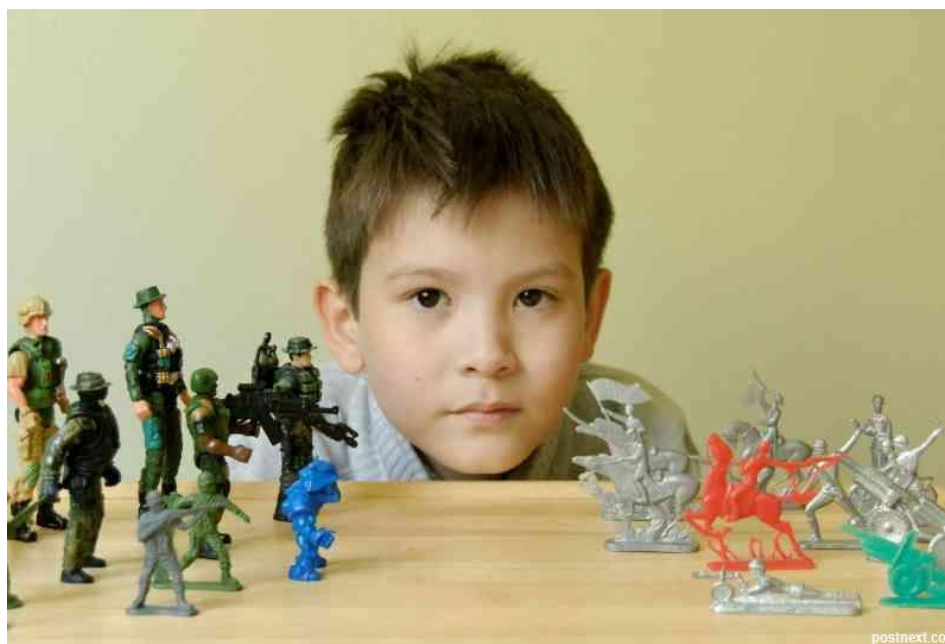
Ил. 1. Игра в идеологию.

дальше паразитировать на ресурсах России (главный из которых – люди, отнюдь не сырье ). Культурно-социальная ориентация на «вселенский Запад» предполагает даже не ассимиляцию, а прямое уничтожение национальной культуры, – но нет уже разобщенных «масс», есть усложняющееся («по стратам») и поляризующееся («по классам») общество... Это не значит, что «народная толща» иступленно мечтает о революции, хотя чаяния ее противоположны запросам либералов-западников и грезам консерваторов-националистов.