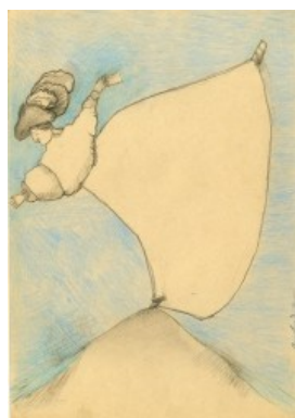
Ил. 4. «Танцовщица с горы Арарат», 1967, 29x20,5, триптих. Коллекция В. Ханукаева.