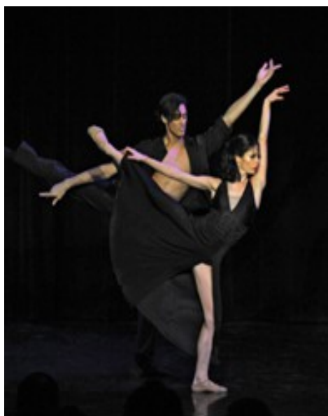
Ил. 8. Сцена из балета «Гаянэ».

Это сценическое действие – не биография художницы и не история персонажей ее картин; Михаэль Фихтенбаум поставил перед собой сложнейшую задачу – донести до зрителя с помощью хореографии огромный мир эмоций Гаянэ, квинтэссенцию ее философского осмысления бытия, воплощенные в образах явления природы и, более того, даже особенность ее мазка. Удалось ли это Михаэлю Фихтенбауму? Остается надеяться, что и московский (российский) зритель рано или поздно увидит этот необычный балет и сможет ответить на поставленный вопрос. (Уже в Москве 25 сентября был показ балета в Доме Литераторов на Б. Никитской).