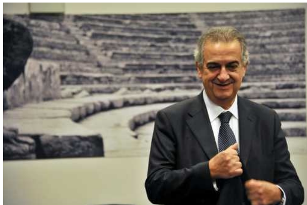
Ил. 1. Лоренцо Орнаги (р. 1948), по образованию политолог. С 2006 года занимал пост ректора Католического университета (Universita Cattolica del Sacro Cuore) в Милане. В ноябре 2011 года был назначен министром культуры Италии.

Новый министр культуры Италии Лоренцо Орнаги в вопросе спасения памятников культуры апеллирует к чувству ответственности своих соотечественников. И к их деньгам.