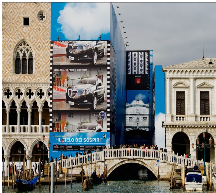
Ил. 3. Венеция.

Среди городов в культурном спонсорстве лидирует Венеция. Производители предметов роскоши стараются извлечь из неё визуальную выгоду для своих марок. Фирма модной одежды готового платья Diesel финансирует ремонт знаменитого моста Риальто, Дворец Дожей и Мост Вздохов под рекламу арендуют банки и такие Дома моды, как Bulgari и Guess. Городское руководство радо тому, что известный французский магнат моды и коллекционер произведений изобразительного искусства Франсуа Пино создаёт в Палаццо Грасси частный музей, а Миучча Прада экспонирует свои коллекции в собственном дворце на Большом Канале... Венеция по уши в долгах, они перевалили за 400 миллионов евро. Дотации из Рима предназначаются главным образом на строительство заградительных сооружений в рамках проекта MOSE, осуществляемого в целях предотвращения затопления города морской водой. Он будет стоить Венеции более пяти миллиардов евро.