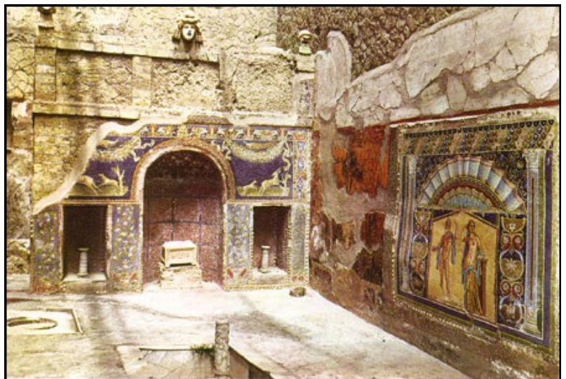
Ил. 4. Геркуланум.