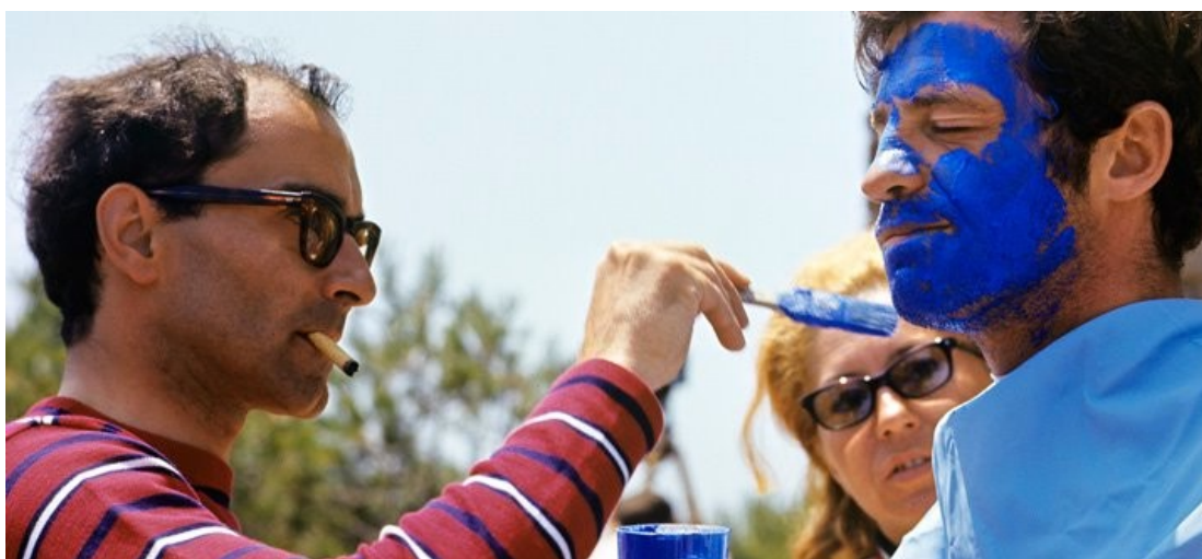
Ил. 8. Годар создаёт интеллектуальное кино (на съёмочной площадке «Безумного Пьеро»).

Ленту «На последнем дыхании» Годара называют квинтэссенцией «новой волны». В нём всё «неправильно», начиная со сценария, который отсутствовал. «Не понимаю, зачем люди пишут сценарии, хотя их никто не читает, за исключением актеров, которые делают это, чтобы подсчитать, сколько фраз надо произнести, и знать, что делать в кадре, – говорил Годар. – В кино можно начать снимать картину буквально с нуля» [5]. Съёмки осуществлялись в естественных декорациях обычной ручной камерой из неудобных позиций, словно подглядывающей за реакциями героев; построение производилось по принципу коллажа – соединение эпизодов, как бы увиденных случайным прохожим, и потому логически не связанных и т. д. Казалось, на экран ворвалась сама жизнь. Это производило ошеломляющее впечатление. «"На последнем дыхании" – фильм, где всё позволено, – писал о своей картине Годар. – Я исходил из этого принципа... Я хотел оттолкнуться от условной истории и переделать, переиначить всё существующее кино» [1, с. 48].