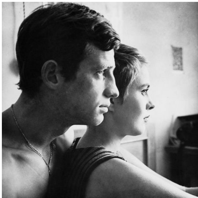
Ил. 7. Бельмондо и Джин Сиберг. Кадр из фильма «На последнем дыхании» (реж. Ж.-Л. Годар, 1960).

языке...моё появление совпало с изменением в эпохе, с крахом буржуазной мечтательности. Я никого не копировал, я был самим собой. Именно это и сблизило меня с Годаром» [цит. по 1, с. 281]. Роль Мишеля Пуакара в важнейшем фильме французской «новой волны» – «На последнем дыхании» Жан-Люка Годара принесла актеру всемирную славу и навсегда вписала в историю кинематографа.