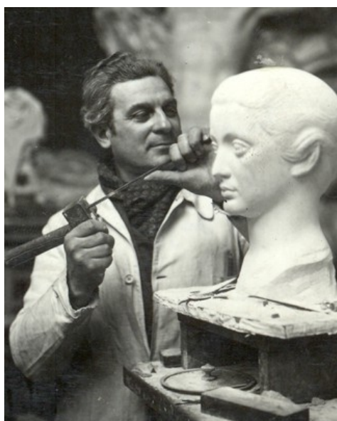
Ил. 3. Поль Бельмондо в своей мастерской.

Жан-Поль родился 9 апреля 1933 года в Нейи-сюр-Сен (Neuilly-sur-Seine, Paris), аристократическом пригороде Парижа. Его детство было обеспеченным и счастливым. «Мы родом из Сицилии и из Пьемонта, – рассказывал он о семейных корнях в одном из интервью. – Родители отца эмигрировали из итальянского посёлка Чефалу в Алжир и прижились там. Когда началась Первая мировая война, отца из Алжира призвали в армию. Совсем юношей он попал в Париж и своими руками отковал свою красивую судьбу. Он был для меня примером во всём... До самых последних своих дней он каждое воскресенье непременно шёл в Лувр...Как-то я спросил отца: «Зачем ты это делаешь? Ты же знаешь каждый из шедевров Лувра как собственную ладонь!» Отец только улыбнулся в ответ: «Чтобы учиться, малыш» [2, с. 9].