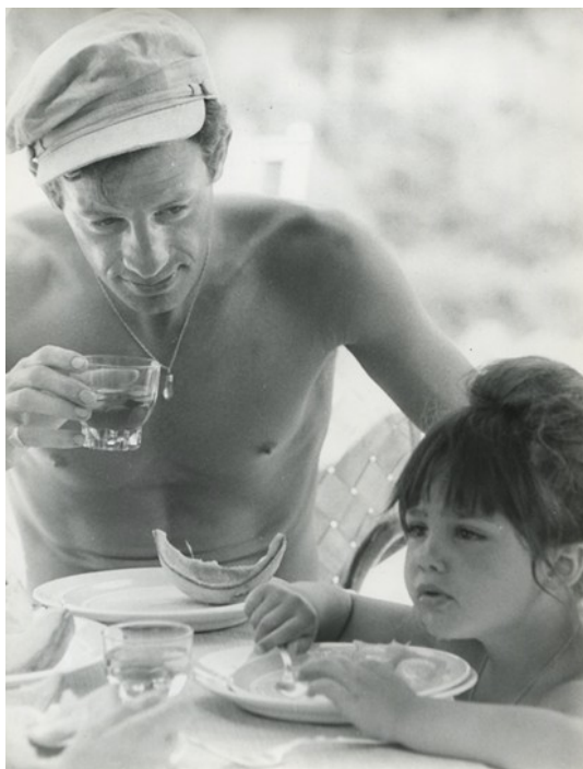
Ил. 6. С дочерью.

Тем не менее жена всегда была настороже, справедливо полагая, что редкая женщина способна устоять перед неотразимым природным обаянием мужа. К тому же она отлично знала нравы артистической среды, да и насчет влюбчивости своего Жан-Поля тоже особых иллюзий не питала. Поэтому долгое время Бельмондо считался образцовым семьянином.