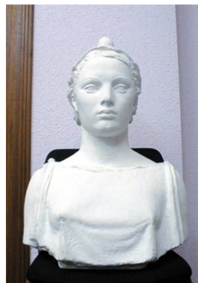
Ил. 2. Бюст Марианны работы Поля Бельмондо.

Причем Бебель (так прозвали своего любимца соотечественники) в качестве эталона типичного француза был бы