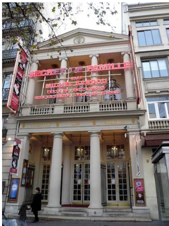
Ил. 14. Бельмондо с 1991 по 2004 гг. владел этим театром «Варьете».

В отличие от Элоди, с новой пассией его разделяли три десятилетия. Нати это не смущало. Она превратилась в тень Бельмондо,