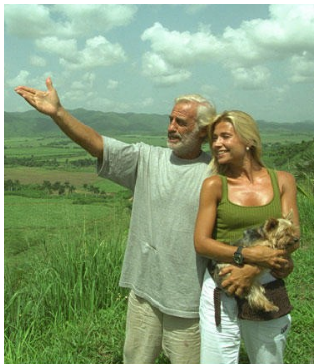
Ил. 15. Ж.-П. Бельмондо, Натали Тардивель и тот самый йоркширский терьер.