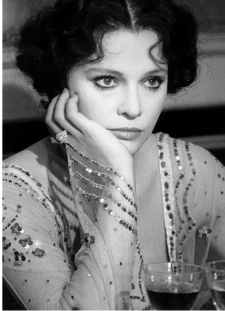
Ил. 13. Лаура Антонелли.

Публика была заинтригована, все хотели знать ради кого «урод бросил красавицу». А когда тайное стало явным, в очередной раз восхитились Бебелем. В прямо скажем далеко не аленделона влюбился секс-символ итальянского кино – прекрасная Лаура Антонелли. Эту женщину вождедела вся страна и сопредельные государства. Лаура была феноменом – ее омутная красота ошеломляла и гипнотизировала. Во внешности актрисы редкостным образом соединились несоединимые черты: высокий целомудренный лоб мадонны, кроткий взгляд девственницы, невинная улыбка и роскошное, жаркое тело искушенной женщины. Все это составляло дьявольскую смесь, от которой у мужчин кругом шла голова.