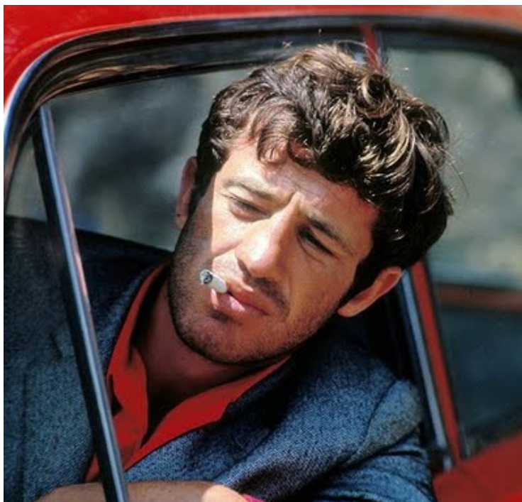
Ил. 10. За рулём «Автомобильки Примулы». Кадр из фильма «Безумном Пьеро» (реж. Ж.-Л. Годар, 1965).