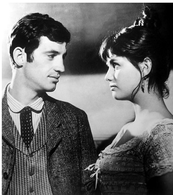
Ил. 9. Бельмондо и Кардинале в фильме «Переулок» – «Ла Виачча» (реж. М. Болоньини, 1961 год).

Его послужной список стремительно рос за счёт ролей в авторском или, выражаясь современным языком, арт-хаусном кино, изредка перемежаемыми участием в так называемых «мускульно-дыхательных» фильмах. Новая встреча с Годаром в комедии «Женщина есть женщина» прошла на удивление спокойно. Зато третий совместный фильм «Безумный Пьеро» стал событием во французском кинематографе и был с восторгом принят критикой и узким кругом эстетствующей публики. Этот ребус для интеллектуалов (в картине вновь возникает пресловутый Ласло Ковач, который оказывается бежавшим из Венгрии на Запад инсургентом 1956 года) был снят в свойственной Годару импровизационной манере.