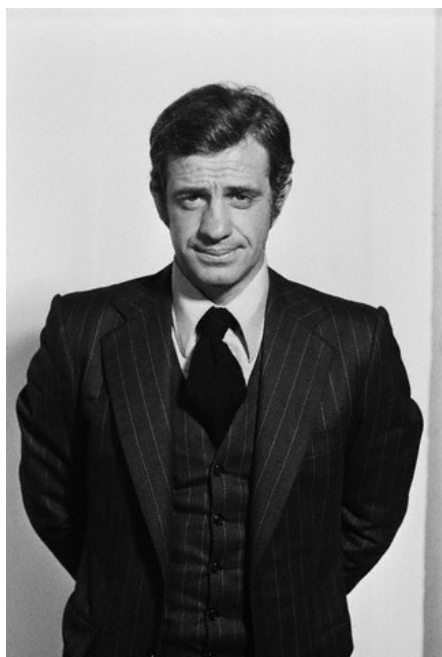
Ил. 1. Жан-Поль Бельмондо (р. 09.04.1933).