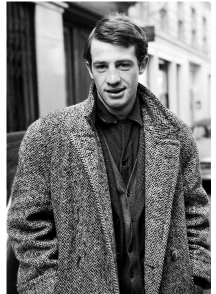
Ил. 4. Студент.