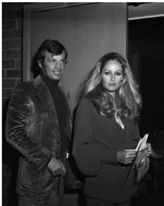
Ил. 12. С Урсулой Андресс.

Благодаря таланту и бездне обаяния Бельмондо стал самым некрасивым, но в то же время самым желанным наряду с красавцем Аленом Делоном кинолюбовником французского кинематографа. Эти два очень разных и очень любимых соотечественниками актёра и человека в творчестве двигались параллельными курсами. В их соперничестве никогда не было ни малейшей зависти. У каждого была «своя» публика и «свои» роли, которые не имело смысла перехватывать. Их великолепный «убийственный дуэт» в продюсированной Делоном гангстерской ленте «Борсалино» завоевал огромную популярность и стал кассовым хитом. Это сотрудничество двух суперзвёзд было омрачено лишь «афишным» скандалом (имя Делона было напечатано на афише дважды: как продюсера и как актёра, что вызвало протест Бельмондо), который, впрочем, ещё больше подогрел интерес публики к их фильму. По примеру Делона, после «Борсалино» Бебель создал собственную кинокомпанию «Серито-фильм» (назвав её в честь своей итальянской бабушки-танцовщицы; впоследствии кинокомпания стала именоваться: «Аннабель продюксон» – по имени внучки Бельмондо).