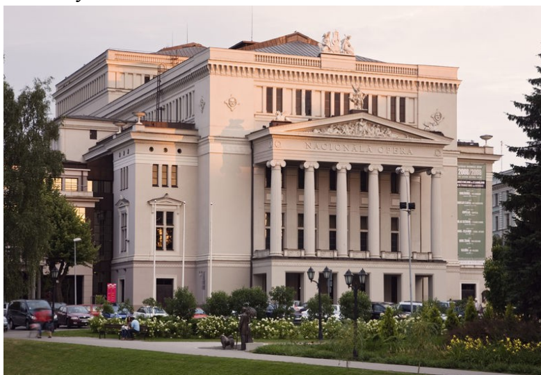
Ил. 5. Здание Латвийской национальной оперы.

Подъехала карета скорой помощи. Из нее вышел толстый важный водитель и стал покровительственно увещевать публику: «Товарищи, товарищи! Идите-ка вы по домам. Никогда не видали, что ли, как человеку плохо становится?» В полнейшей тишине ему ответили из толпы: «Попробуйте сделать так, чтобы мы вас полюбили, как Миронова. Знаете, когда вам станет плохо, я думаю, к вам никто не придет...» Водитель молча вернулся в кабину.