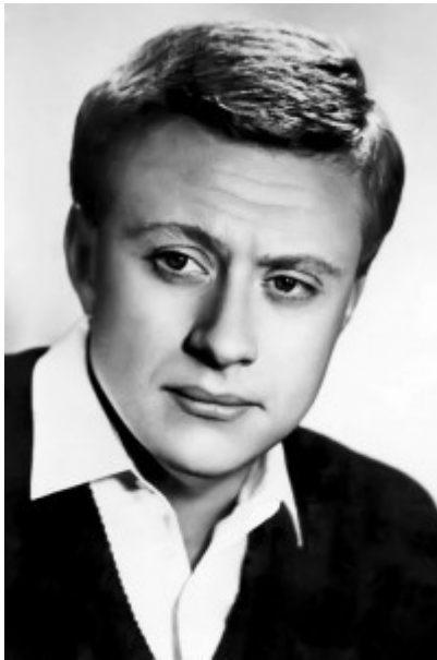
Ил. 1. Андрей Александрович Миронов (1941–1987).