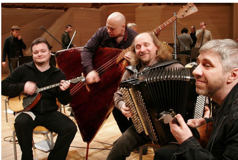
Ил. 4. «Терем-квартет».

Инструменты, на которых играют участники квартета, словно располагают к тому, чтобы переходить границы жанров. «Терем-квартет» стал инициатором соединения народных инструментов и симфонического оркестра, создав грандиозную программу «Бал-маскарад». Музыканты «Терем-квартета» исполняют и современную музыку: в основу спектакля «Музыка в городе N» положена непростая для исполнения музыка Альфреда Шнитке, Леонида Десятникова, Александра Чайковского. «Терем-квартет» сделал к ней собственные оригинальные аранжировки, создав собирательный образ бесчисленных городков российской провинции. В целом репертуар ансамбля включает больше 500 оригинальных композиций классической и современной музыки, переосмысленной и как бы сочиненной музыкантами заново. За свою более чем 20-летнюю деятельность «Терем-квартет» дал свыше 3000 концертов, выступил в 60 странах мира, участвовал в 63 фестивалях по всему миру.