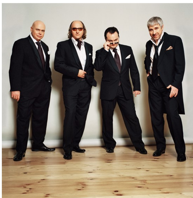
Ил. 3. «Терем-квартет».

летия Иерусалима в историческом центре Старого города, перед лидерами государств на Саммите стран Большой восьмерки G8 в Санкт-Петербурге.