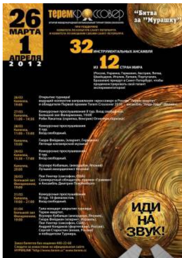
Ил. 5. Афиша фестиваля «Терем-кроссовер».

премию и специальный приз концертных объединений России – гастрольный тур по городам Российской Федерации. Вторую