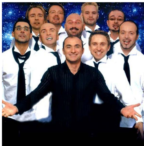
Ил. 9. Хор Турецкого.

«Хор Турецкого» – один из наиболее востребованных коллективов на современной отечественной сцене, что в целом является весьма значительным прецедентом: ранее артисты, исполняющие подобный репертуар, не могли соревноваться с поп-исполнителями. Каждый из артистов популярного шоу-проекта «Хор Турецкого» получил академическое образование в лучших музыкальных вузах страны. У этого профессионального коллектива уникальный состав, включающий все голоса от тенора-