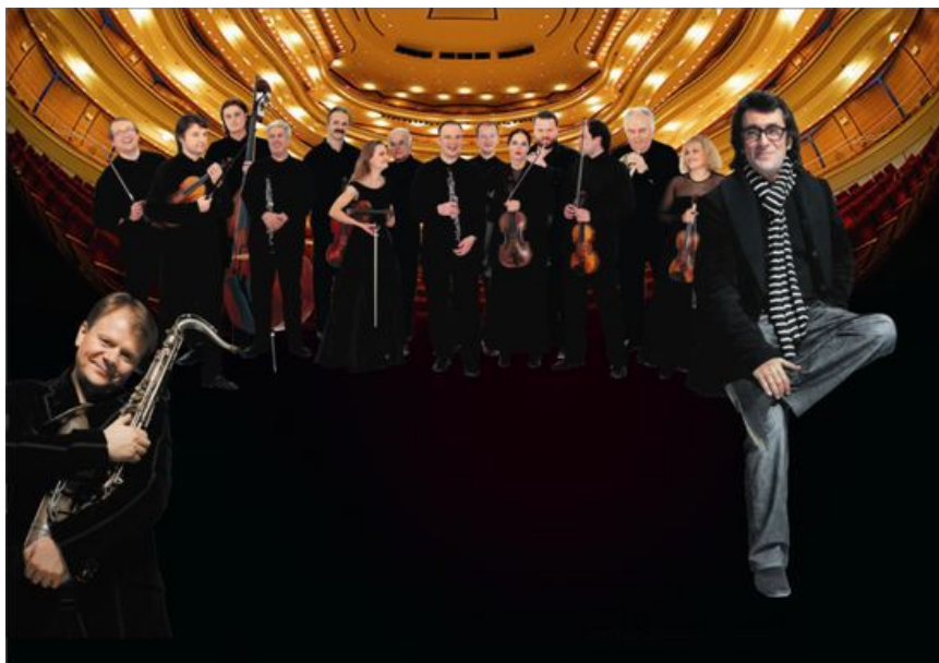
Ил. 6. Игорь Бутман, Юрий Башмет и оркестр.