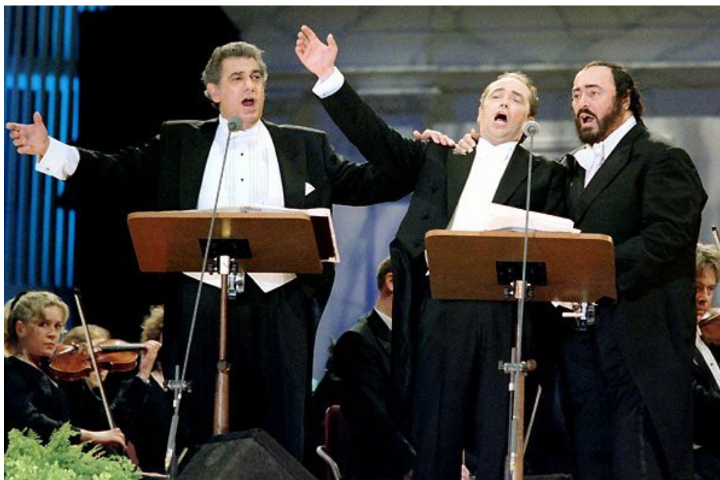
Ил. 2. Пласидо Доминго, Хосе Каррерас и Лучано Паваротти.

Термах Каракаллы в Риме. Выступление транслировалось телевидением по всему земному шару и имело ошеломляющий успех.