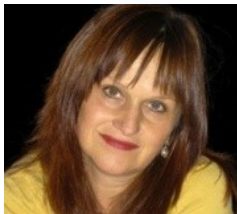
Ил. 3. Гарди Хуттер.

Гарди Хуттер — всемирно известная женщина-клоун из Швейцарии, чей яркий талант отмечен более чем десятью самыми престижными цирковыми наградами в Германии, Франции, США и др. странах. Хуттер дала более 2700 выступлений в 22 странах от Андорры до Бразилии, благодаря тому, что прекрасно владеет всеми основными европейскими языками.