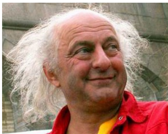
Ил. 7. Вячеслав Полунин.

Знаменитый Асисяй, Вячеслав Полунин, родился в Советском Союзе в 1950 году. Сегодня его имя знают во всем мире. Западная пресса называет Полунина «лучшим клоуном эпохи», а поклонники — волшебником, чьи спектакли согревают сердца детей и взрослых.