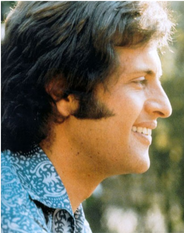
Ил. 1. Джозеф Айра Дассен (1938 - 1980).

Прошло почти 32 года со дня смерти Джо Дассена (20 августа 1980 г.), однако его песни продолжают звучать в программах радио и телевидения многих стран. Дассена по-прежнему любят не только люди старшего поколения, но и молодежь, знакомая с песнями певца только по записям. Необыкновенное обаяние Джо Дассена, чарующий, проникновенный голос певца, не оставляющий равнодушным ни одного любителя шансона, умение с достоинством держаться на сцене, теплое отношение к публике, с которой певец поддерживал контакт