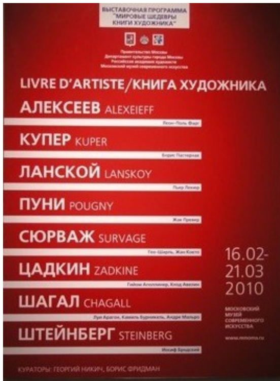
Ил. 1. Книга художника. Афиша выставки.

Книга художника – синтетический жанр, своего рода театр, возвращающий нас к истокам творчества, когда и слово, и линия, и цвет, и звук, и жест, и камень представлялись человеку священным единством.