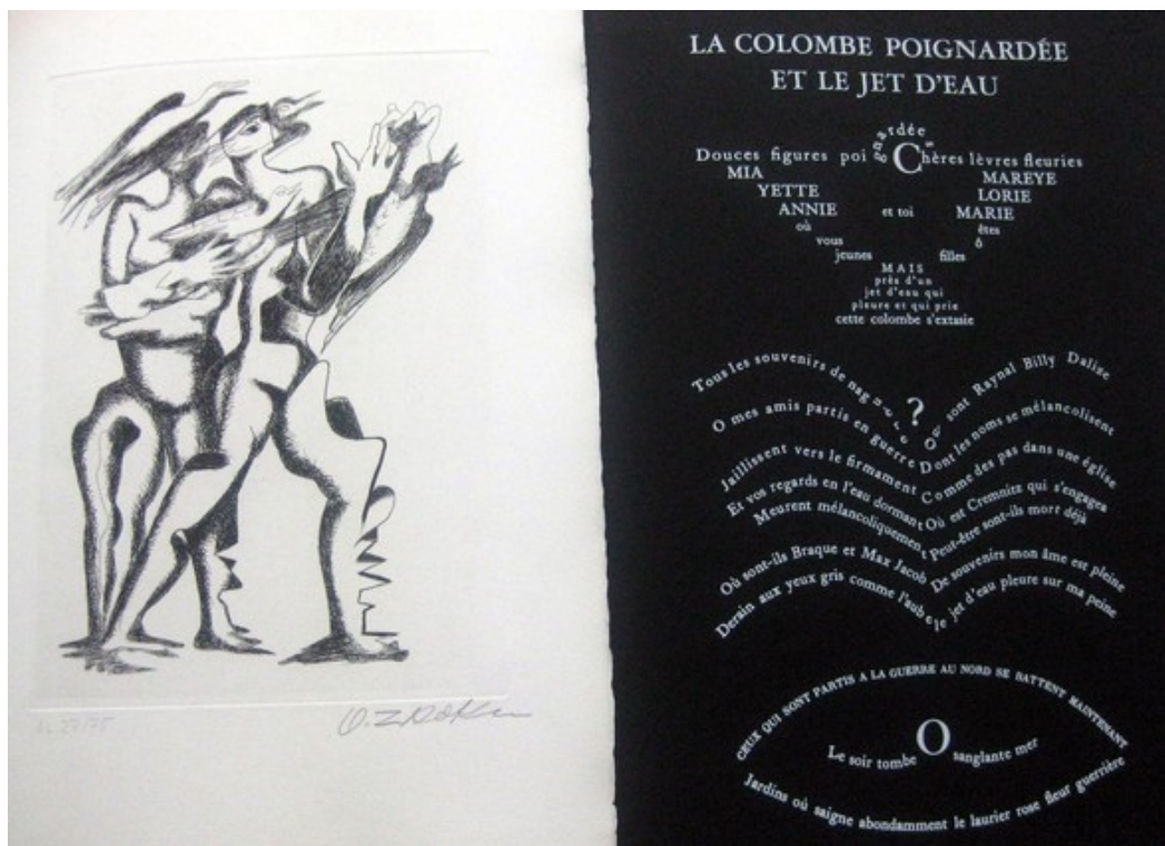
Ил. 2. О. Цадкин. Иллюстрации к поэме Клода Авелина «Портрет птицы-которой-не-существует»

птицы-которой-не-существует» Осип Цадкин создал уникальную иллюстрированную книгу в манере кубизма. Его рисунки напоминают то проволочные сооружения диковинной птицы, созданные фантазией художника, то эскизы его скульптур. «Тексты поэта выглядят как визуальные знаки, – говорит куратор выставки Георгий Никич. – Между ними происходит не просто диалог литературы и искусства, а литература сама становится визуализированной поэзией и приобретает совершенно новый характер» [1].