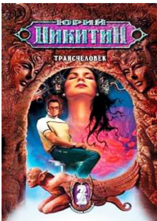
Ил. 3. «Трансчеловек» – обложка книги: продолжение следует...

поставленными в неравноправные условия с детства – если не образованием, то воспитанием (по очень простой социальной причине – «мужики рожать не могут!»), общение сводится к тому, чтобы ублажать-заботиться, поражать-обольщать. Как следствие – и защищать , но не как более сильный слабого, но чтобы покорять сердца... О дружбе-любви, мечте не только тинейджера, но и всякого относительно нормального мужчины (вместо любви-борьбы с растерзаниями нижнего белья и прочими романтическими аксессуарами), здесь и речи нет – разве можно полубогам раскрывать себя до конца перед простыми смертными? Добро бы посторонними какими-нибудь, спасенными по случаю, а тут ведь спать отчего-то вместе приходится , – можно, разумеется, пройти по жизни мимо, но не получилось почему-то.