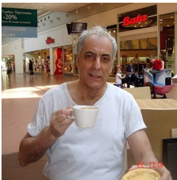
Ил. 1. Юрий Никитин, пророчествующий с позиций «героического фэнтези»

Никитин Ю.А. Зачеловек: Фантастический роман из цикла “Трое из леса”. – М.: Эксмо, 2010. – 512 с. – 3000 экз. – ISBN 978-5-699-21996-4. – (Несерийное издание).