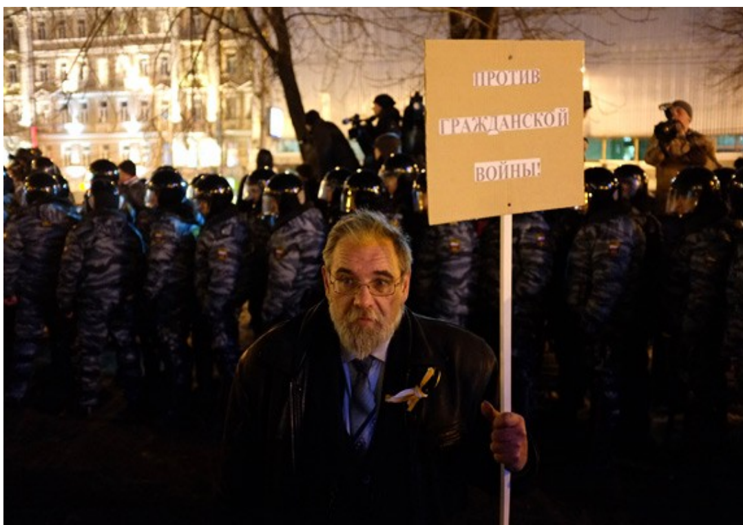
Ил. 2. «Средний класс» – прежний, советский, на фоне новейшего, «россиянского»

сменяемости элит, нормального доступного жилья, доступного хорошего образования и здравоохранения <...>, политической представленности во власти» [2], – поскольку «на памяти человечества не было еще ситуации, когда бы элита получала такой колоссальный (и по объему, и по относительной доле) кусок общественного пирога, при этом практически не неся никакой ответственности за свою деятельность» [5]. Критическая масса недовольства растет, – хотя, если верить конспирологам, митинги типа «болотных» имеют функцию предохранительного клапана, они инспирированы после думских выборов 2011 года, чтобы осуществить давно намеченные меры как бы под давлением «улицы»... Карать зарвавшихся коррупционеров будут, разумеется, но не следует ждать решительных перемен – кроме предвыборных, телевизионно-показательных мероприятий [6].