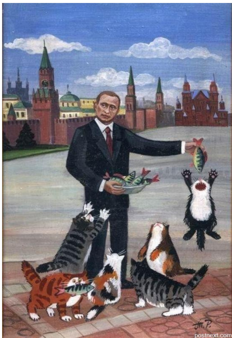
Ил. 7. Интернет-плакат, показывающий «добренького» (недостаточно жесткого) Путина, кормящего олигархов – «жирных котов» (термин американский).