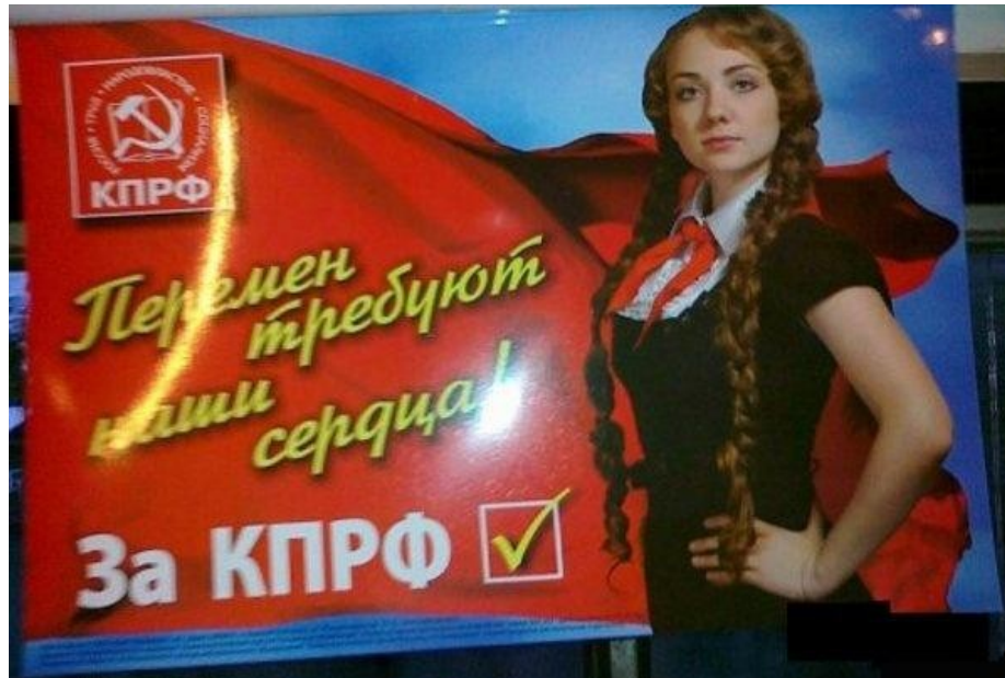
Ил. 5. Интернет-плакат КПРФ

<...> Люди должны мечтать о расширении своего культурного и космического пространства <...> и пытаться это каким-то образом воссоздать» [8].