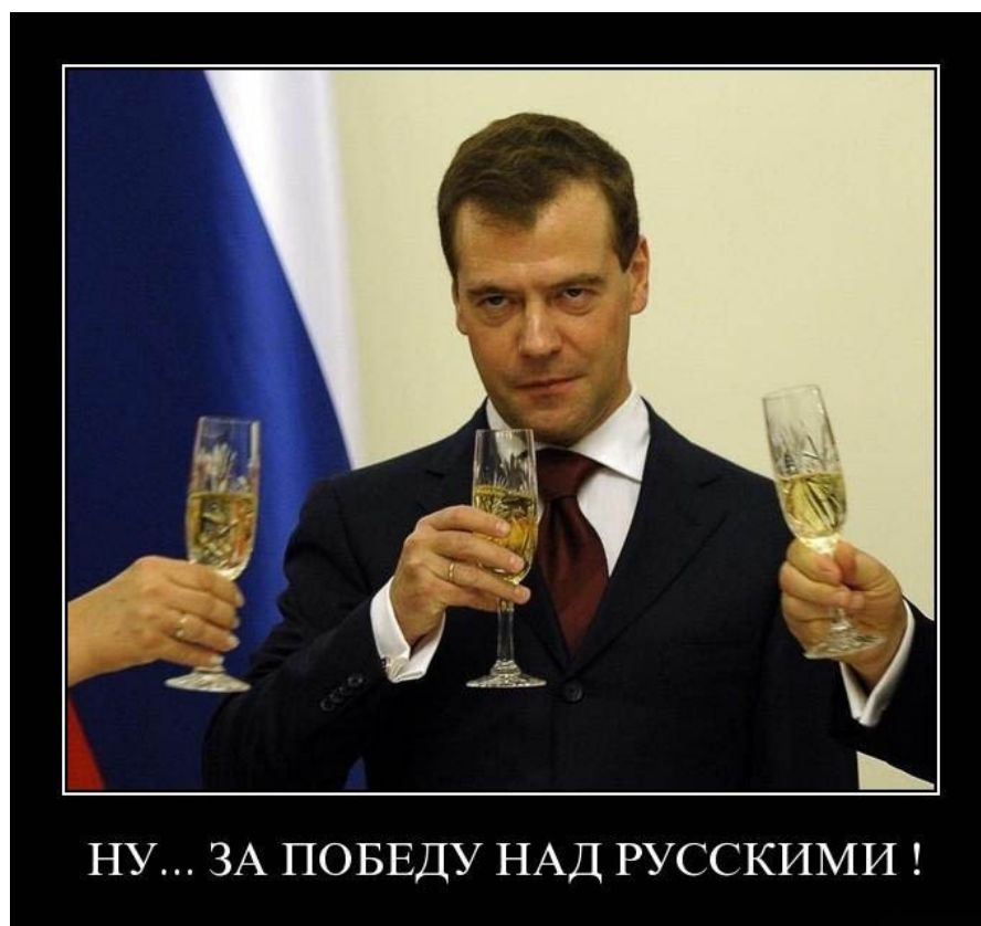
Ил. 3. Интернет-плакат, рассчитанный на реципиентов категории «А»

А) Этнонационалистические наборы комиксов : Русь–Россия–СССР–РФ (либо «вильна Украина», Великая Ичкерия, Финно-Угория, Тюркотатария, Область Войска Донского и т.д.) как одна из решающих сил прогресса. При этом, однако, это этническое образование становится жертвой либо коварного Запада, либо России. Идеологемы вмонтированы в «крутой экшен», богатырские подвиги служат упаковкой. Зиждится такая архаика на европейско-мистическом понимании «крови и почвы», тяготея к национально-этническим и религиозно-сектантским структурам. Блистательно осмеяно подобное миропонимание Е. Лукиным, мастером интеллектуальной сатиры, в романе «Алая аура протопарторга».