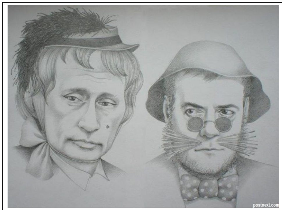
Ил. 6. Интернет-плакат, адресованный элитаристам («эльфам») категории «Г»