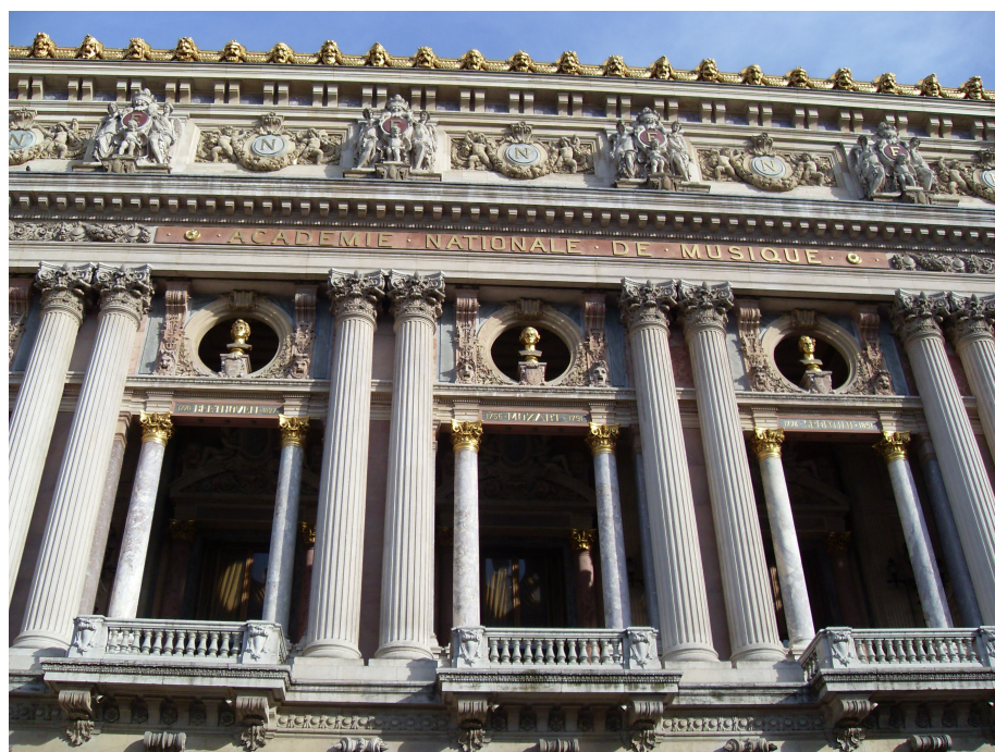
Ил. 4. Фасад театра Гаранье (фото А.И. Обидина).

За последние двадцать лет Государственная парижская опера в большой степени способствовала повышению интереса к музыкальной жизни Франции, проявившегося и в значительном расширении репертуара, и в притоке более молодой публики.