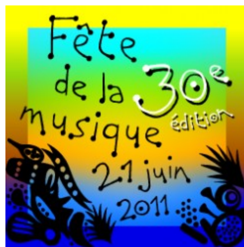
Ил. 2. «Праздник музыки 2011»

Отличительной стороной деятельности того периода было распространение современной музыки на всей территории страны, поддержка творчества композиторов современников, чему в большой степени способствовало фестивальное движение Musica и создание музыкальных творческих студий. Большое внимание уделялось также развитию любительской музыкальной практики, хорового пения. Символическим событием стало