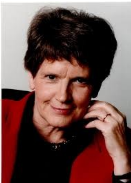
Ил. 15. Рита Зюсмут (Rita Süßmuth, 1937)

Рассказывают, будто на вопрос, что осталось от шестидесятых, философ Юрген Хабермас ответил: «Рита Зюсмут». Если это и придумано, то придумано удачно.