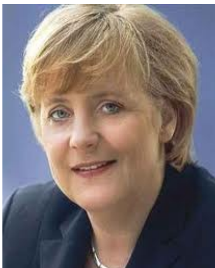
Ил. 25. Ангела Меркель (Angela Merkel, 1954)

Жила-была примерная девочка Ангела. Росла она в маленькой деревне, среди цветущей