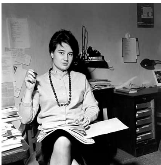
Ил. 12. Ульрика Майнхоф (Ulrike Meinhof, 1934–1976)

В 1998 г. на экраны ФРГ вышел фильм «Синдром Баадера-Майнхоф», посвященный самому кровавому десятилетию из истории существования террористической организации RAF (Rote Armee Fraktion, Красноармейская фракция, в которой сменилось три поколения боевиков, окончательно распалась лишь в 1998 г.). Подростки восприняли его как увлекательный политический триллер с убийствами, поджогами, погонями и виртуозно стреляющими девицами; в памяти людей старшего поколения он еще раз вызвал оставшиеся за кадром вопросы, которые волновали их тридцать лет назад, и прежде всего, как могло случиться, что юноши и