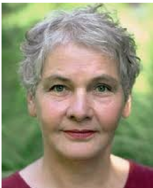
Ил. 16. Кристиана Нюсляйн-Фольхард (Christiane Nüsslein-Volhard, 1942).

В 1995 г. нобелевская премия по медицине была присуждена Кристиане Нюсляйн-Фольхард. Прежде нобелевских лауреаток в науке у Германии не было – да и не только в науке, если не считать нобелевскую лауреатку поэтессу Нелли Сакс, которая после бегства от нацистов жила в Швеции. Биолог Нюсляйн-Фольхард, директор тюбингенского Института биологии развития им. Макса Планка, получила самую престижную в мире премию совместно с двумя американскими учеными за исследования в области генетического управления эмбриональным развитием.