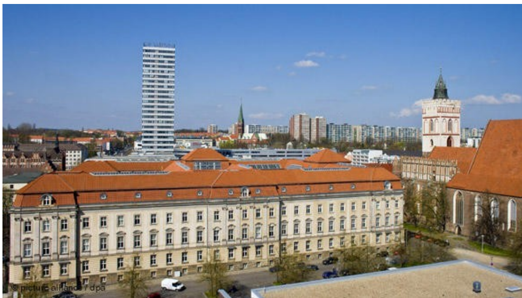
Ил. 21. Европейский университет Виадрина (Франкфурт-на-Одре, Германия).

Доверие – ключевое слово для Гезины Шван. Доверию на государственном уровне было посвящено одно из недавних ее выступлений в Свободном университете Берлина. По ее мнению, существующий в ФРГ дефицит доверия – основной тормоз на пути развития страны. Причины утраты доверия она видит не только в некомпетентности отдельных личностей, а в «глобальной стирании границ культурного, технического и прежде всего экономического развития, которое становится все менее подвластным ограниченному влиянию национальной государственной политики».