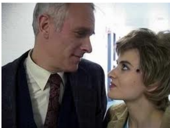
Ил. 24. Герд Бастиан и Петра Келли.

волнующие ее темы вплоть до положения аборигенов, необходимости признания альтернативной медицины или опасности, которую представляют автомобильные выхлопы. Она сотрудничает с внепарламентскими группами, международными организациями в защиту мира и прав человека, участвует в сидячих блокадах немецких АЭС. Петра Келли превращается в символ гражданского сопротивления. К сожалению, в собственной фракции и партии, состоящей из группировок, представляющих разнообразные интересы и не объединенных строгим дисциплинарным регламентом, самозабвенную идеалистку начинают считать – и не без оснований – слишком бескомпромиссной и не способной работать в команде. Все непримиримей становятся столкновения «фундаменталистов» с «реалистами», которые в открытую заявляют, что мечтам не место в правительственных коридорах. Келли все чаще приходится вести борьбу в одиночку, хотя ее образ активно эксплуатируется партией во время предвыборных кампаний.