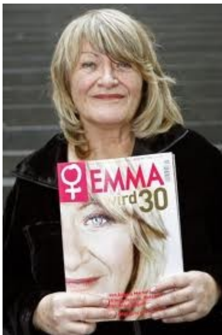
Ил. 18. Алиция Шварцер (Alice Schwarzer, 1942)

«Эмма» и Алиция Шварцер нераздельны более трех десятилетий. За эти годы возникали и уходили в небытие другие издания с женскими именами, а феминистский журнал, не публикующий рекламы и гламурных историй, продолжает существовать. Да, он стал более умеренным и терпимым, и тиражи его, как и большинства других периодических печатных изданий, снизились, но в падении собственного тиража журнал отчасти «виноват» сам: новое поколение женщин, матерям которых «Эмма» помогала бороться за освобождение от патриархальной зависимости под феминистским девизом «Вместе мы сила», обрело уверенность в себе и не столь остро нуждается в опоре и руководстве. Однако Алиция Шварцер не собирается складывать оружие. Ее книги по-прежнему возглавляют списки бестселлеров, телепередачи с ее участием неизменно имеют высокий рейтинг. Шварцер, обладательница Креста за заслуги перед ФРГ на ленте, французского ордена Почетного легиона, в 2005 г. была названа «журналисткой года», в 1997 г. Гражданский женский союз провозгласил ее «женщиной года». Еще в 1987 г., через 10 лет после основания, «Эмма» с ее 80 000 экземпляров являлась самым крупным феминистским изданием Европы.