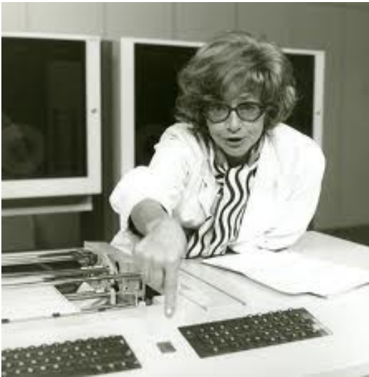
Ил. 7. Лора Лоренц (Lore Lorentz, 1920–1994)

Ее называли гранд-дамой немецкого кабаре, несравненной прима-балериной политической сатиры. Из предшественниц она могла бы сослаться разве что на Эрику Манн и Терезу Гизе, эмигрировавших в 1933 г. в Швейцарию вместе с их знаменитой «Перечницей». Славные традиции немецкого кабаре создавались мужчинами: для него писали Тухольский и Ведекинд, Рингельнац и Кестнер; берлинские «Катакомбы» Вернера Финка были запрещены в 1933 г. за антинацистские выступления. Еще в конце XIX века центрами литературно-политического кабаре стали Берлин и Мюнхен, причем Берлин склонялся к политике, а баварская столица к литературе. Когда в