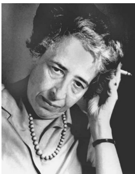
Ил. 2. Ханна Аренд ( Hannah Arendt, 1906–1975 )

Ханна Аренд получила в 1951 г. американское гражданство, однако почти через полтора десятилетия признавалась немецкому интервьюеру Иоахиму Фесту, насколько глубоко и непоправимо она принадлежит Германии: «По образу мыслей и суждений я по-прежнему родом из Кенигсберга». Американка она только «всем политическим сердцем». Город Канта наложил на нее пожизненную печать.