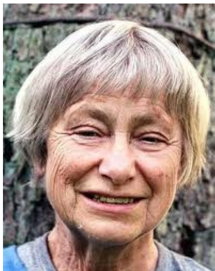
Ил. 11. Доротея Зеле (Dorothee Sölle, 1929–2003)

В ее жизни слились дух бунтарства и созерцательность мистицизма. Совмещение противоположностей не имело ничего общего с сектантством. Она нажила себе немало врагов в стенах официальной церкви, но гораздо больше друзей по всему свету. Ее слушали и читали верующие и неверующие. Тот, кто непростым путем сомнений и поисков пришел к критическому приятию веры, считала она, должен бороться за развитие новых форм религии. Будучи протестантским, евангельским богословом, она видела эти формы и за пределами западного христианства. Однако европейцам ближе свой образец: «отлитый в застывшую расхожую форму, но совершенно неведомый Учитель – Христос». Воплощение Бога в человека – не завершившийся по смерти Христа, а вечно длящийся процесс. Отделение потустороннего Бога от «земной» любви ложно, «нет иной трансценденции, кроме любви», – писала Зеле в книге с