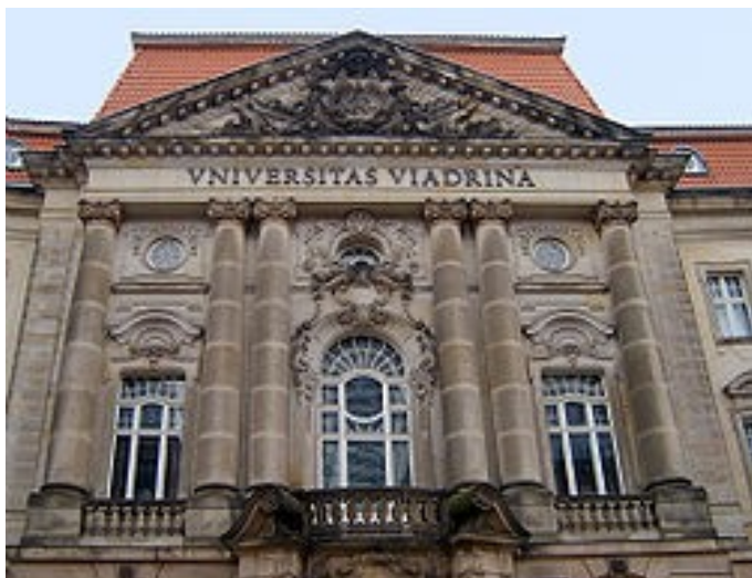
Ил. 22. Европейский университет Виадрина.

Alma mater Viadrina в первый же год своего существования, 1506, приняла 900 студентов из Германии, Польши, Дании, Норвегии и Швеции. Здесь учились Томас Мюнцер, Вильгельм и Александр Гумбольдты, Карл Филипп Иммануил Бах, Генрих Клейст. Виадрина закрылась в 1911 г.: ее профессора и студенты переселились в Берлин, в университет, который будет впоследствии носить имя Гумбольдта. Новое открытие самого