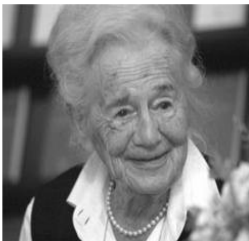
Ил. 6. Хильда Домин (Hilde Domin, 1909–2006)