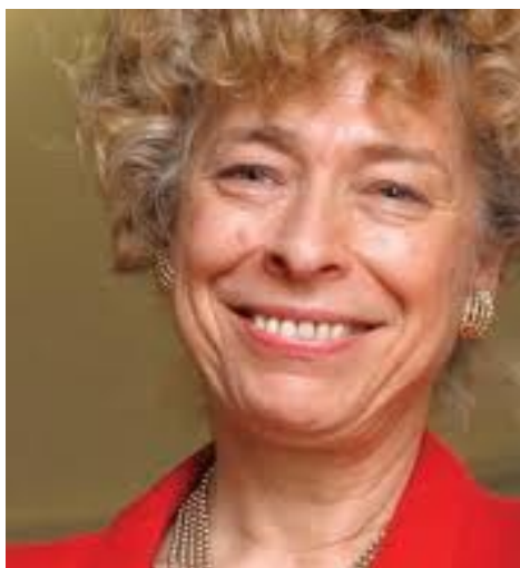
Ил. 20. Гезина Шванн (Gesine Schwan, 1943)

Для нее пенсионный возраст не время для сладостного безделья. Даже уйдя с поста президента Европейского университета Виадрина во Франкфурте-на-Одере, Гезина Шванн продолжает жить его проблемами. А также выполнять нештатные и официальные обязанности по интенсификации немецко-польских связей. Интерес к польским соседям зародился у нее еще в отчем доме. Мать – уроженка Верхней Силезии, и утрата родины часто была темой семейных разговоров. Слушая воспоминания о мирном довоенном сосуществовании поляков и немецкого меньшинства в