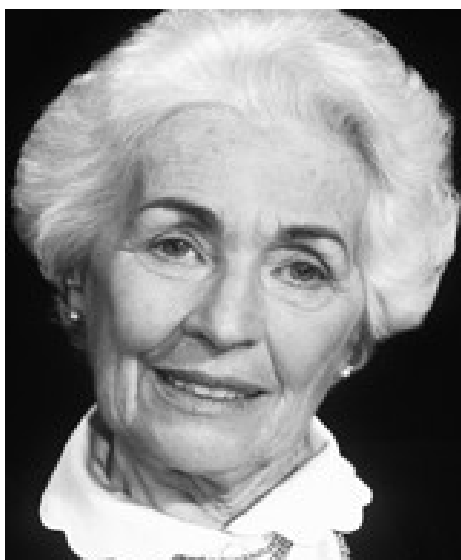
Ил. 10. Хильдегард Хамм-Брюхер (Hildegard Hamm-Brücher, 1921)

Более полувека «гранд-дама» послевоенной западногерманской политики участвовала в ее формировании в качестве представителя либерального крыла, будучи нередко единственной женщиной в мужском окружении. Ее принципиальность вызывала уважение у политических противников, тогда как внутри ее собственной партии, СвДП, она зачастую приводила к жестким контрверзам. Слишком сильную партийно-государственную структуру при слабости гражданского общества она считает причиной политической усталости народа. Всевластие партий и их взаимовыгодных коалиций можно преодолеть только путем организации гражданских инициатив, которые обладали бы законодательно закрепленным правом парламентского представления петиций. Определяющее влияние на ее политические принципы оказал Гельмут Шмидт, всегда имевший определенное, не зависящее от благосклонности избирателей мнение, а истинным идеалом либерального образа мыслей и человечности навсегда остался для нее первый федеральный президент и один из организаторов СвДП Теодор Хейс, который оказался ее крестным отцом в политике.