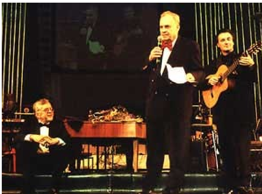
Ил. 4. А. Петров и Э. Рязанов. Гала-концерт "Браво, Петров!" 22 декабря 2000 года в БКЗ "Октябрьский"

композиторов СССР (1969). В 1989 г. Петров был избран депутатом Верховного Совета СССР. А в 1992 году, когда произошло возрождение музыкально-общественной организации России – Филармонического общества Санкт-Петербурга, Андрей Павлович (совместно с Д. Лихачевым, Ю. Темиркановым, Ю. Львовым, М. Бяликом, Б. Березовским) входит в него, становится председателем, а затем – президентом. В 1996 г. его избирают почетным доктором Санкт-Петербургского гуманитарного университета профсоюзов.