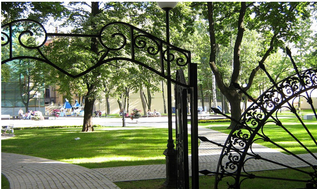
Ил. 5. Санкт-Петербург. Сквер имени А. Петрова

На Каменоостровском проспекте, между домами 26–28 и 32 разбит сквер им. Андрея Петрова. Когда-то этот участок, считавшийся в 1990-е строительной лакуной, а в 2001 г. предназначенный под застройку, был озеленен силами горожан при личном участии композитора. 29 января 2007 г. ему присвоено имя Андрея Петрова.