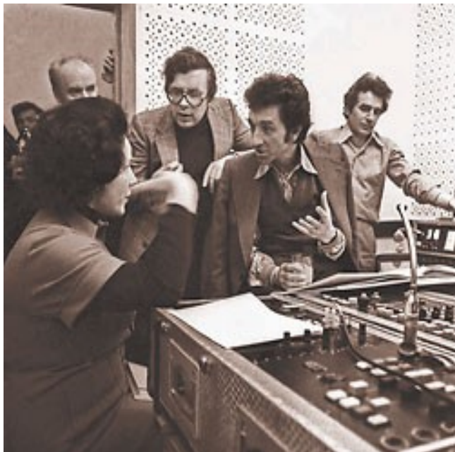
Ил. 3. Андрей Петров и Юрий Темирканов