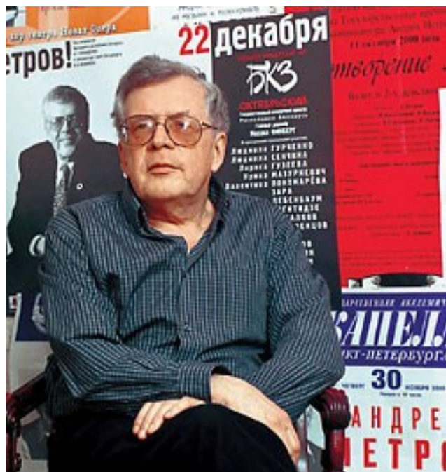
Ил. 1. Петров Андрей Павлович (1930–2006).

Один из наиболее ярких композиторов XX века, Андрей Петров (1930–2006) нашел путь к сердцу своих современников незабываемыми мелодиями киномузыки, глубиной сочинений академических жанров. «Общительность» и привлекательность его музыки неотрывна от незаурядной личности музыканта.