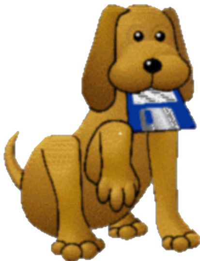
Ил. 3. Символ-талисман Фидонета

Неудивительно, что названием столь демократичного коммуникативного сервиса стала популярная в США кличка беспородной собаки – «Фидо» – аналога русских Шариков, Бобиков и Тузиков, а графическим символом-талисманом сети стала собака с дискетой в зубах.