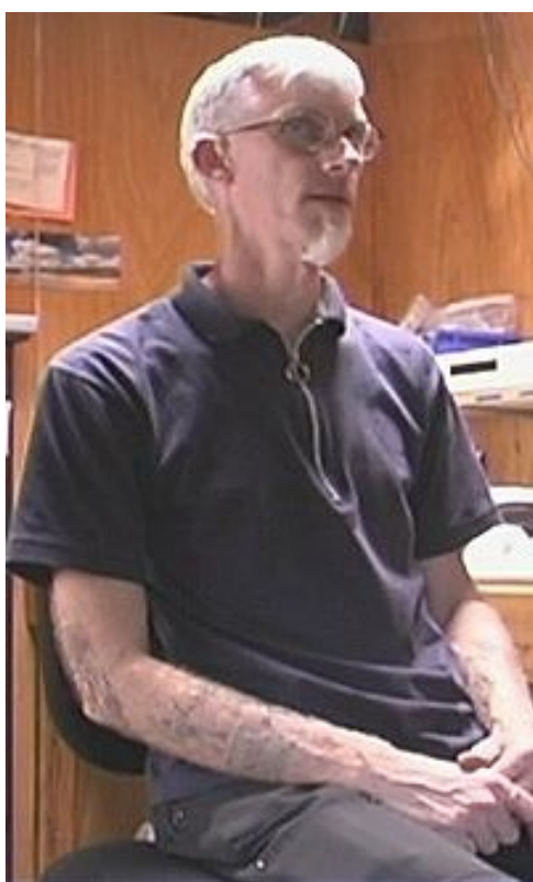
Ил. 2. Создатель сети Фидонет (англ. Fidonet) Том Дженнингс, р. 1955 (англ. Thomas Daniel Jennings).