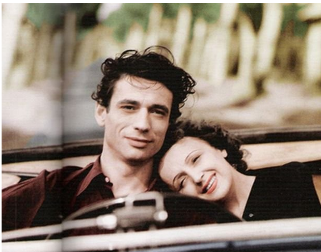
Ил. 4. Эдит Пиаф и Ив Монтан.

певец. Я готова заняться тобой». Усилием воли смилив мужскую гордыню (Пиаф была всего на 6 лет старше Монтана), он согласился.