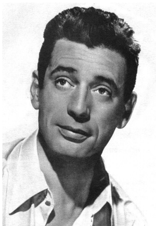
Ил. 3. Ив Монтан (Ivo Livi). (1921–1991).