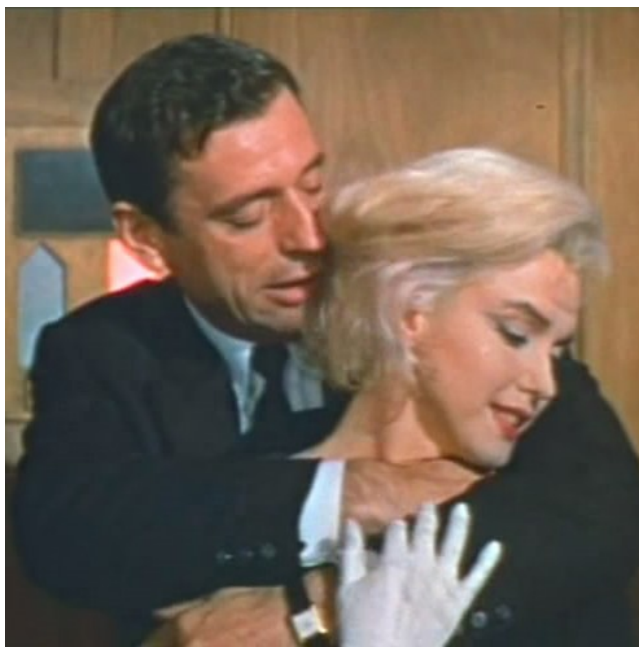
Ил. 8. С Мерилин Монро в фильме «Давай займёмся любовью», реж. Джорж Кьюкор (1960)

Журналисты не упускали возможности взять интервью у оscarоносной, острой на язык парижанки. Синьоре оправдала их надежды – счастливая, уверенная в себе актриса удивила американок заявлениями о том, что её не привлекает «статус кинозвезды», не страшат проблемы возраста. «Я знаю одну актрису, – с юмором поведала она журналу «Look», – которая двадцать четыре часа в сутки следит за своим лицом, телом и счётом в банке. Могу спорить, что её очаровательному мужу приходится предварительно записываться к ней «на приём», чтобы исполнить супружеские