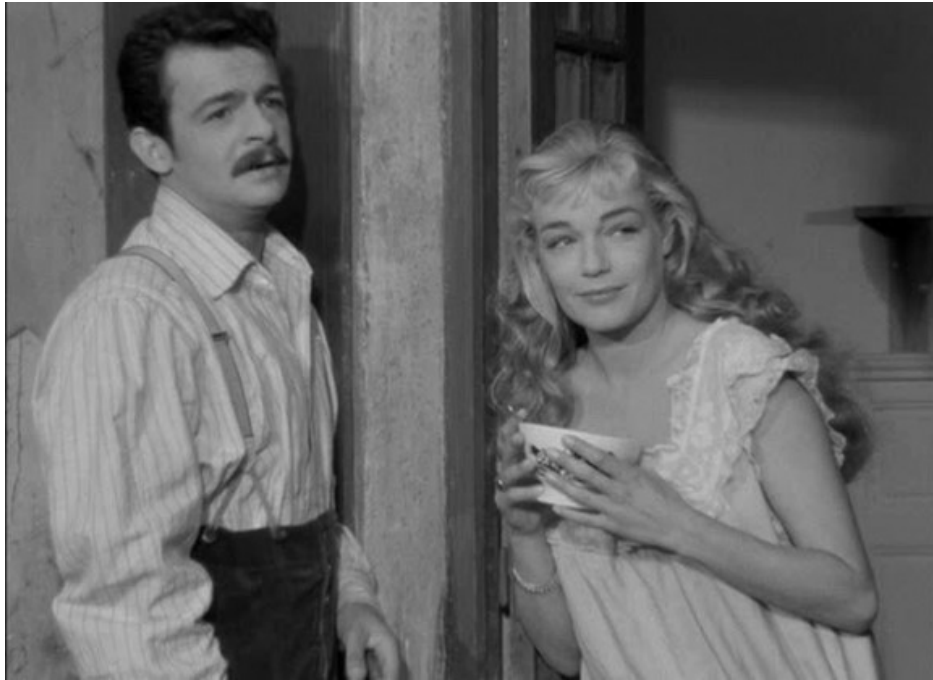
Ил. 6. С Сержем Реджани в фильме «Золотая маска».

Разъезжая по миру, Симона занималась вместе с мужем общественной и политической деятельностью. До сих пор в архиве французских спецслужб хранятся досье на Синьоре («В кинематографической среде считается особой, связанной с коммунистической партией») и Монтана с отчётами о слежке и язвительными психологическими характеристиками. «Во всех своих фильмах, – написано об актрисе, – Синьоре играла преимущественно женщин легкомысленных или проституток. Говорят, что эти роли отвечают её темпераменту» [8].