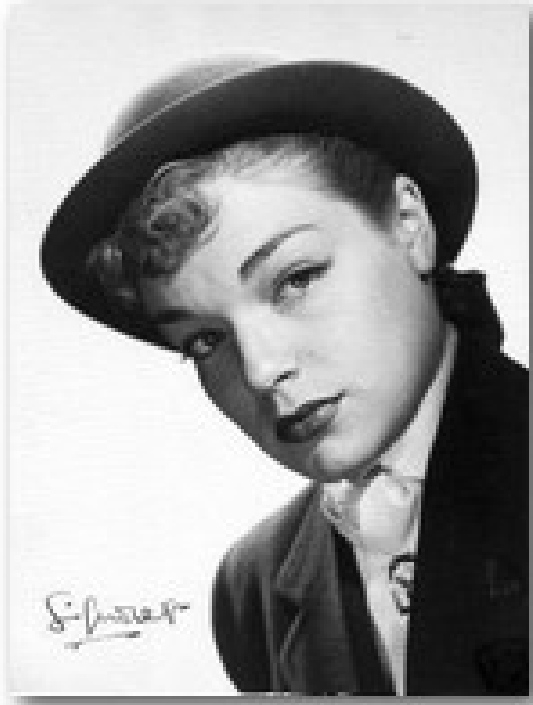
Ил. 2. Симона Синьоре (Simone-Henriette-Charlotte Kaminker). (1921–1985)

На новом месте немецкоговорящей девочке пришлось всерьез заняться французским. Помогла ей в этом феноменальная слуховая память. Впоследствии, став актрисой, Симона и роли учила на слух, с голоса ассистента. Дочке передались лингвистические способности отца: она свободно владела немецким, французским и английским языками. У нее был хороший слог, а сочинения всегда оказывались лучшими в классе. Когда Симона начинала «изображать» кого-нибудь из знакомых, все покатывались со смеху, называя маленькую Каминкер «артисткой». Её действительно влекла к себе сцена, особенно с тех пор, как отец стал работать у Дамура – известного владельца театрального рекламного агентства.