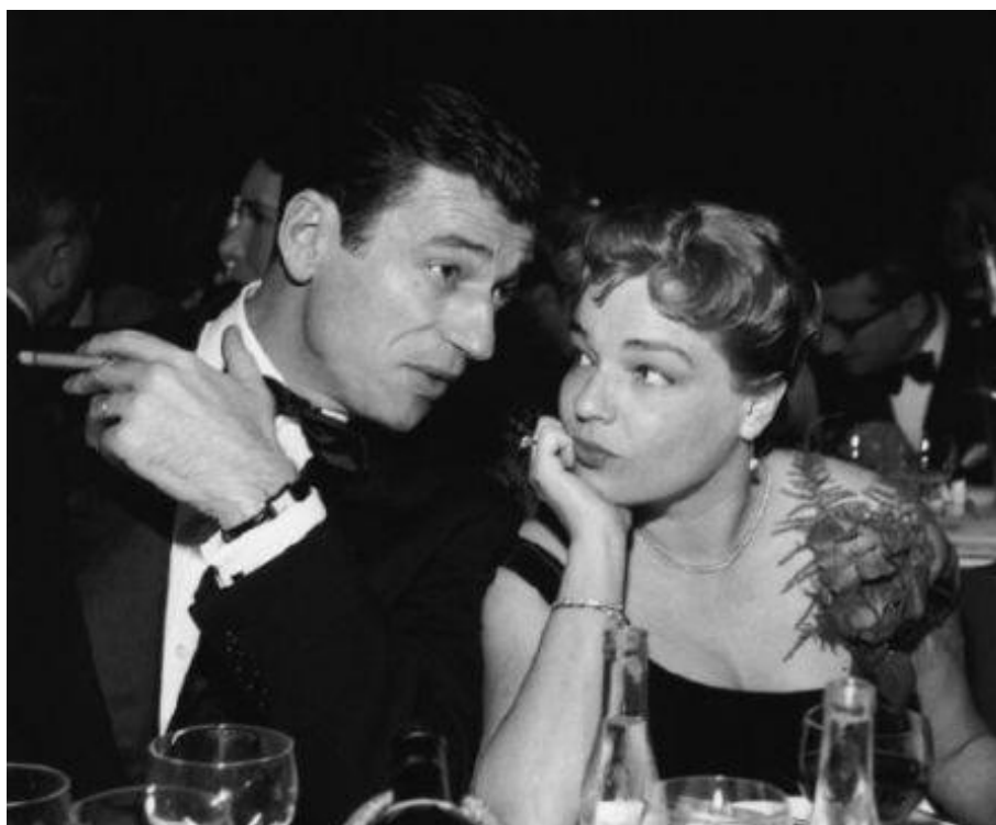
Ил. 1. Ив Монтан и Симона Синьоре