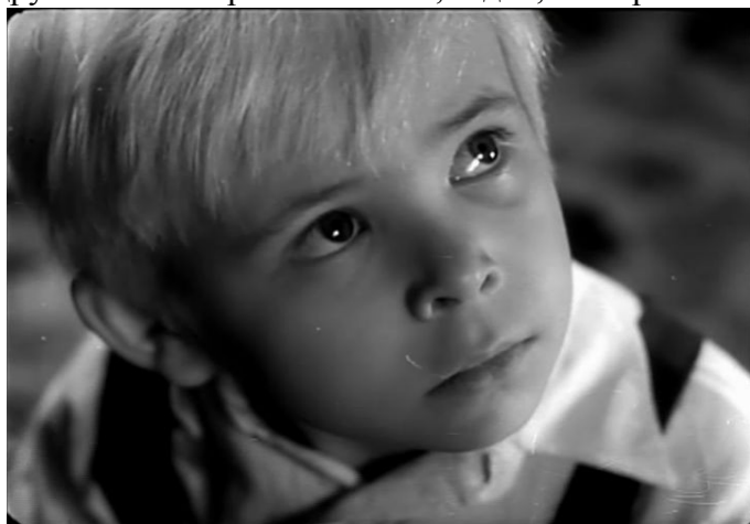
Илл. 9. Кадр из кинофильма «Серёжа», реж. Г. Данелия.

«Юность» прославленный режиссер-сказочник А.Л. Птушко и, позднее, А.Г. Хмелик. Первым фильмом, выпущенным объединением, стал «Каток и скрипка» (1960) – дебют начинающего тогда режиссёра А.А. Тарковского. Это было время, когда детское кино стало не просто интересным, но и подчас и значительным явлением, авторским в полном смысле этого слова. Достаточно сказать, что первыми фильмами таких талантливых режиссеров как, например, А. Тарковский, М. Калик, А. Митта, А. Салтыков, Э. Климов стали киноповести для детей и о детях. И уже эти первые киноленты сделали их создателей известными. Скорее всего, это не удивительно. Вчерашний мальчик имеет определенный душевный и духовный груз-размышление, множество вопросов и личных ощущений. Придя в творческую профессию, юноша свое внутреннее, невысказанное, требующее голоса и выхода наружу, облекает в некий кинематографический рассказ-посыл, невольно проводя своеобразный мостик к своему последующему творчеству, доверяя маленькому или юному герою и свое потаенное. Только после этого возникнут другие новые размышления, идеи, которые воплотятся уже в новом взрослом кино.