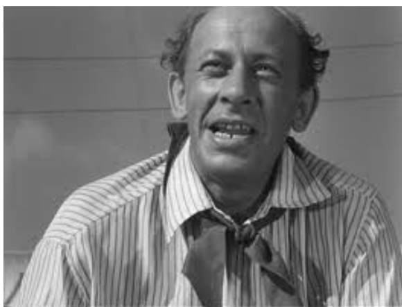
Илл. 11. Кадр из кинофильма «Добро пожаловать, или посторонним вход воспрещен!», реж. Элем Климов.