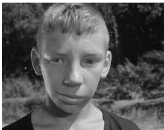
Илл. 12. Кадр из кинофильма «Добро пожаловать, или посторонним вход воспрещен!», реж. Элем Климов.

Хотя названные фильмы шли в основном на детских сеансах, это были уже не просто «взрослые» детские фильмы и даже не просто фильмы так называемого авторского кино. Это были свидетельства намечающегося разлада стройной некогда идеологической модели, ее все усиливающегося несовпадения с реальностью. Почти все вышеуказанные режиссеры детского кино 1960-х годов по своим убеждениям представляли либерально-«шестидесятническое» направление в киноискусстве, делая акценты на острых недостатках советской системы воспитания, но не предлагавших путей решения назревших проблем. Тем не менее,