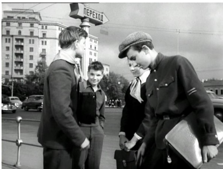
Илл. 10. Кадр из кинофильма «Друг мой, Колька!» реж. Александр Митта, Алексей Салтыков.

Постепенно, вначале робко, кинематограф начинает атаку на те явления советской жизни, которые потом получают наименование «негативных». Почти во всех фильмах, герои которых дети, решаются проблемы весьма актуальные и преимущественно нравственные. Таковы фильмы «Друг мой, Колька!» А.Н. Митты и А.А. Салтыкова (1961); «А если это любовь?» Ю.Я. Райзмана (1962); «Дикая собака Динго» Ю.Ю. Карасика (1962); «Звонят, откройте дверь!» (1966) А.Н. Митты; «Девочка и эхо» (1965) Арунаса Жебрюниса (Литва) и многие другие.