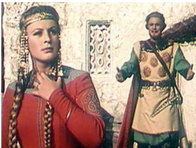
Илл. 6. Кадр из кинофильма «Садко», реж. Александр Птушко.

работы как актерского состава, так и искусства операторского, музыкального, художественного. Все делалось на очень высоком уровне именно потому, что делалось для детей и делалось это с любовью. И даже в военные годы, когда производство детских фильмов сократилось, оно не прекращалось ни на один год, оставаясь важным форпостом идеологии: патриотическим духом были проникнуты и киносказки военных лет («Волшебное зерно», 1942, реж. Ф.И. Филиппов; «Кашей Бессмертный», 1945, реж. А.А. Роу).