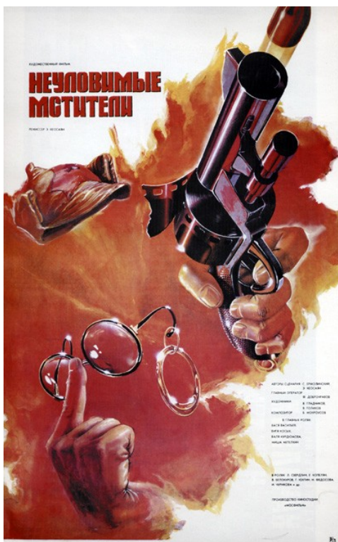
Илл. 16. Афиша фильма «Неуловимые мстители», реж. Эдмонд Кеосаян.

В эти годы по-прежнему важной составляющей патриотической пропаганды среди школьников являлись кино- и телефильмы, повествующие о революционном прошлом страны, первых пионерах и комсомольцах, жизни советской молодежи 1920–30-х годов. Среди фильмов на эту тему преобладали телеэкранизации: так, по произведениям А.П. Гайдара сняли фильмы «Судьбу барабанщика» (1976), «Школу», (1981), далее по А.Н. Рыбакову – «Кортик» (1973), «Бронзовая птица», (1974), «Последнее лето детства» (1975), по В.А. Каверину – «Два капитана» (1976), по В.А. Осеевой – «Раннее-раннее утро» (1982). Особой популярностью у юных зрителей пользовалась кинотрилогия «Неуловимые мстители» (1968), «Новые приключения «неуловимых» (1969), «Корона Российской империи» (1972), повествующая о подвигах юных борцов за революцию.