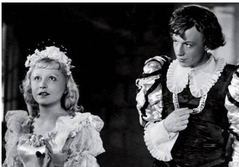
Илл. 8. Кадр из кинофильма «Золушка», реж. Надежда Кошеверова, Михаил Шатиро.

этапов в детском кино начался с создания в 1959 г. на студии «Мосфильм» объединения детских и юношеских фильмов «Юность» и с приходом туда молодых режиссеров. Это был подлинный расцвет детского кинематографа, его настоящий «золотой век», который пришелся на период 1960-х – первой половины 1980-х годов. Детская литература, не устававшая открывать новые имена, по-прежнему щедро делилась с кинематографом превосходными «первоисточниками» – старыми и новыми. Возглавили