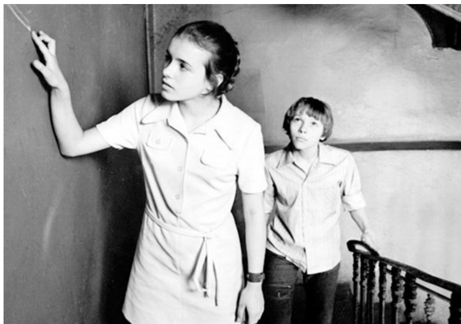
Илл. 13. «Не болит голова у дятла», реж. Динара Асанова