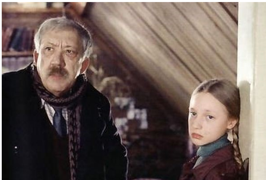
Илл. 14. Кадр из кинофильма «Чучело», реж. Ролан Быков.

Проблемы молодого поколения (цинизм и потеря идеалов, разрыв со старшим поколением) наиболее остро и бескомпромиссно были поставлены в лентах кинорежиссера Динары Асановой («Ключ без права передачи», 1976; «Пацаны», 1983; «Милый, дорогой, любимый, единственный», 1984). Большой общественный резонанс в середине 1980-х получили эти фильмы Д.К. Асановой, а также картина Р. Быкова «Чучело» (1985). Каждый из фильмов содержал в себе определенный «нравственный идеал». В «Пацанах» это был воспитатель Паша, пожертвовавший карьерой ради того, чтобы стать другом, опорой, защитой «трудным подросткам», выпрямить и очистить их искореженные и растоптанные души. В фильме «Чучело» нравственный идеал воплотился в лице 13-летней девочки Лены Бессольцевой, сохранившей и отстаившей свое человеческое достоинство перед жестокостью и цинизмом своих одноклассников.