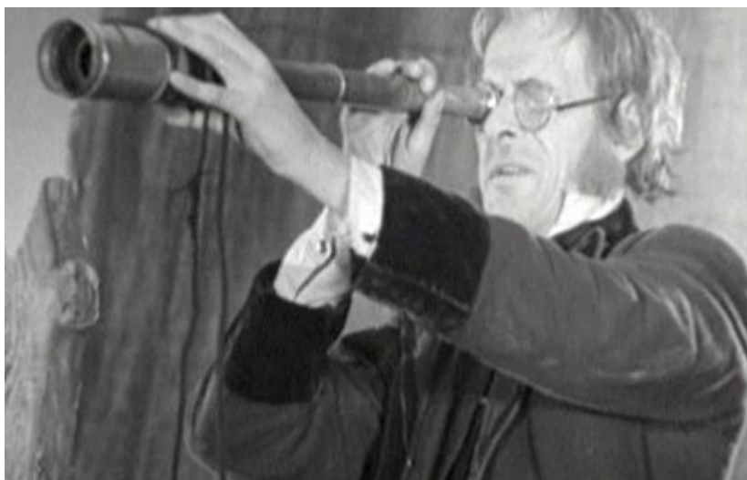
Илл. 5. Кадр из кинофильма «Дети капитана Гранта», реж. Владимир Вайншток

Любопытно, что все эти фильмы до сих пор смотрятся и любимы. Ведь кроме определённой идеологической «окраски», эти фильмы учили подростков товариществу, самопожертвованию, верности долгу, любви к родной земле, чувству прекрасного, т. е. самым высоким человеческим качествам. И, конечно же, эти произведения представляли собой качественные и мастерские