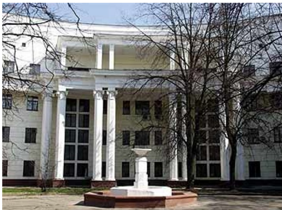
Илл. 3. Центральная киностудия детских и юношеских фильмов им. М. Горького