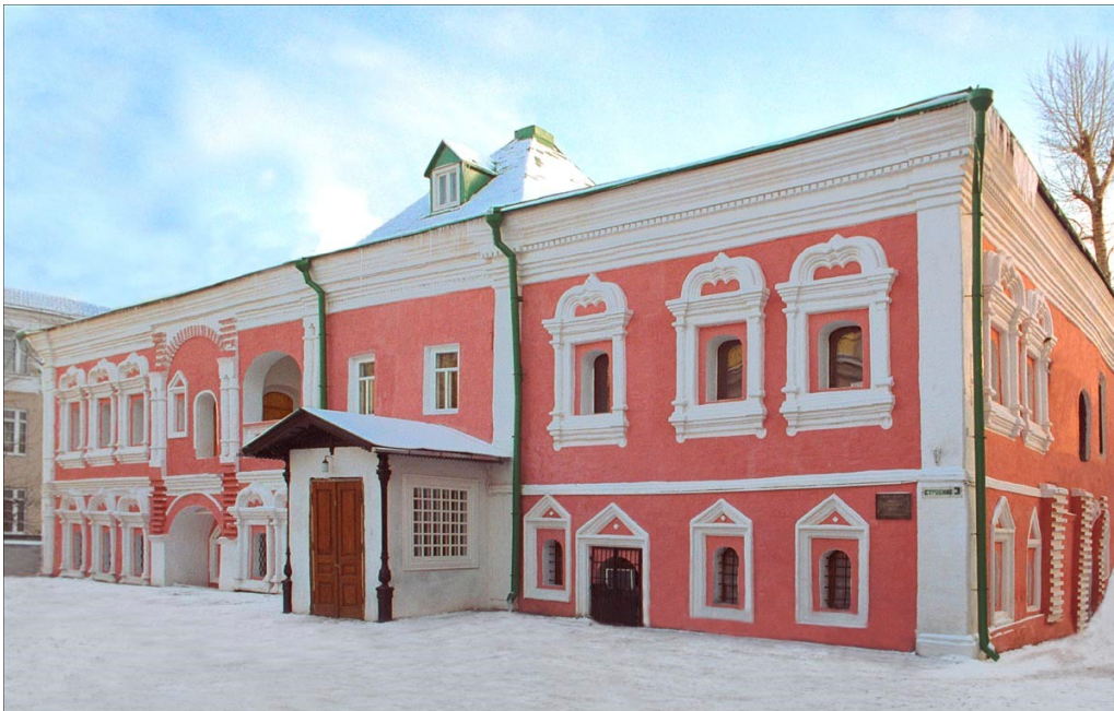
Илл. 1. Государственный Российский Дом народного творчества Сверчков переулок, дом 8, стр. 3, г. Москва

Для историков, культурологов, социологов немалый интерес представляет любительское искусство народов СССР, получившее в советское время официальное наименование «художественная самодеятельность». Без преувеличения, тут наша страна была, как и «в области балета, впереди планеты всей». Ни в одной стране мира любительское творчество не пользовалось таким авторитетом, нигде не существовало подобной массовости, нигде дело не было поставлено так же серьезно, масштабно и профессионально, как в СССР.