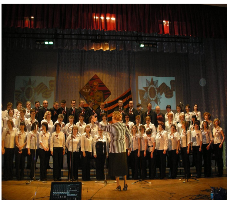
Илл. 5. Второй фестиваль, посвященный 65-летию Победы в Великой Отечественной войне 2008–2010 гг.

Однако в начале 1980-х годов государство меняет свое отношение к фестивалям.