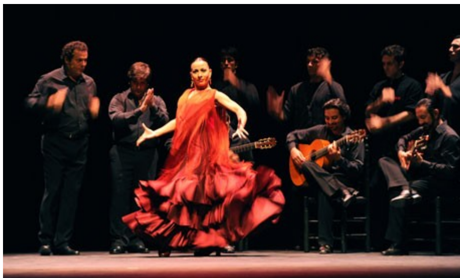
Ил. 9. Национальный балет Испании

Помимо концерта звезд Большого и Мариинского театров, в Испании выступит балет Новосибирского театра оперы и балета и Санкт-Петербургского балета под руководством Бориса Эйфмана. В ответ Россию посетят Национальный балет Испании и несколько трупп подлинно народного испанского танца фламенко. С нетерпением ожидают в Испании и выступление Российского национального филармонического оркестра под управлением Владимира Спивакова и ансамбля «Солисты Москвы» Юрия Башмета.