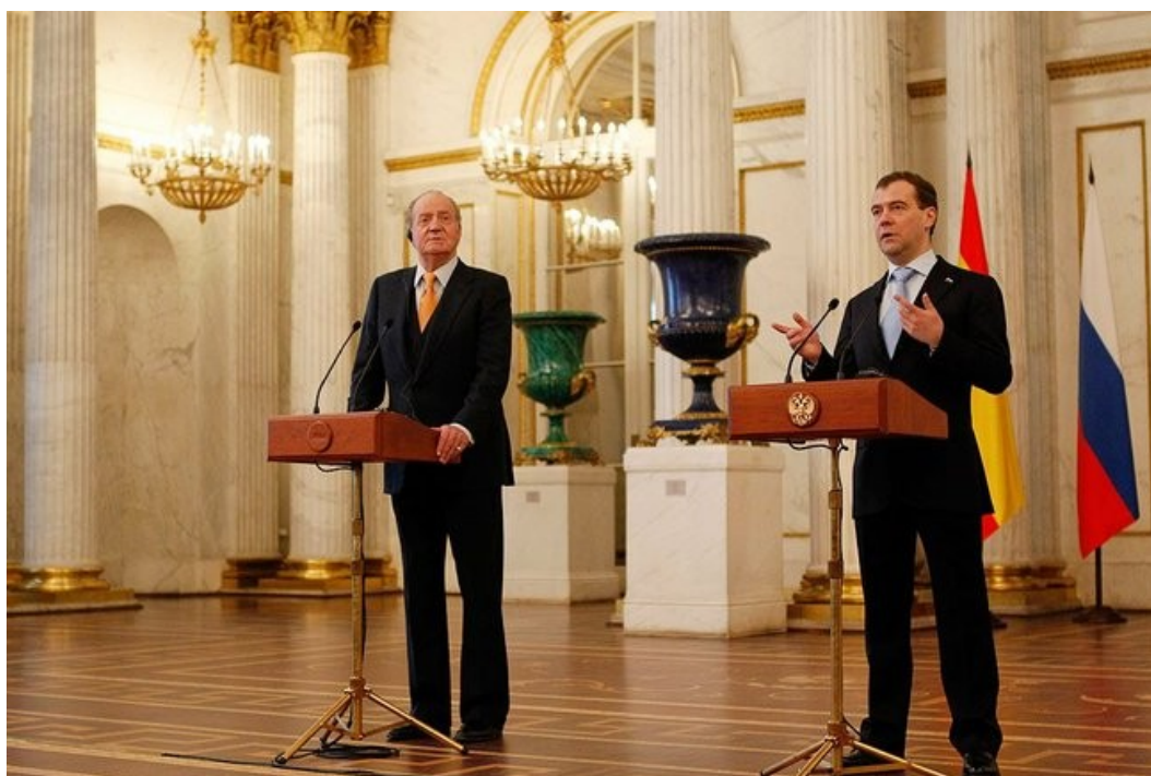
Ил. 6. 25 февраля 2011 г. Президент России и король Испании объявили об открытии Года Испании в России (Санкт-Петербурге)

Расхожий стереотип – известная поговорка о том, что российско-испанские отношения «пахнут нефтью». Это намек на то, что в основе экономического сотрудничества лежат поставки российских энергоносителей. Пора уходить от этих клише. Испания – признанный лидер в Европе по скоростным железным дорогам (их протяженность в Испании – самая высокая в Европе), и по столь популярным ныне возобновляемым источникам энергии. Подписание соответствующих соглашений уже запланировано на ближайшее время. Это будет хорошим подспорьем России в осуществлении проектов модернизации, о которых часто говорит президент Медведев.