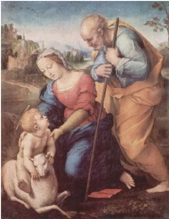
Ил. 8 «Святое семейство с агнцем» Рафаэля Санти, 1507 г. Мадрид, Прадо.

Два натюрморта Луиса Мелендеса и большой картон для шпалеры «Сбор винограда» Гойи также предстанут перед публикой. Выставка продлится до конца мая. Очевидно, что она станет одним из самых значимых событий Года Испании в России.