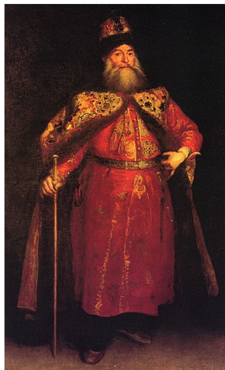
Ил. 2. Портрет Петра Потемкина работы Хуана Карреньо де Миранды, 1681–1682.

Говоря о таком важнейшем культурном мероприятии, как «Перекрестный год», уместно вспомнить об истоках контактов между Россией и Испанией. Несмотря на то, что по образному выражению испанского мыслителя Ортеги-и-Гассета, эти две страны находятся «на противоположных концах европейской диагонали» [1], они связаны общностью исторической судьбы. Отсчет дипломатических контактов принято вести с XVI века, когда оба государства стали едиными и сильными. Первый визит российского посольства в Испанию состоялся в 1525 году. Однако последующие полтора столетия Россию сотрясали катаклизмы, вызванные репрессиями Ивана Грозного и Смутным временем, и установленные дипломатические связи не поддерживались. Точкой отсчета в истории регулярных российско-испанских контактов принято считать визит в 1667 году дьяка Посольского приказа Петра Потемкина в Мадрид, ставший к тому времени столицей испанских Габсбургов. В Испании Петра Ивановича спросили: «правда ли, что Россией татары владели, и русские до сих пор им дань платят?» Ему ничего не оставалось, как ответить вопросом на вопрос: «А правда ли, что Испания 600 лет под мавром была?» [1]. Известный испанский художник Карреньо де Миранда написал тогда портрет русского дипломата, который и сейчас украшает коллекцию мадридского музея Прадо.