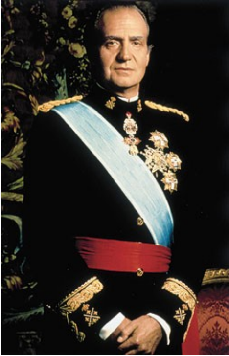
Ил. 4. Король Испании Хуан Карлос I

между двумя странами долго оставались, по сути, на нулевой отметке. Фигура дона Хуана Карлоса I, ставшего королем Испании после смерти Франко, оставалась неясной, прежде всего с точки зрения его политических взглядов, – вспоминает советский дипломат, бывший посол в Испании Ю.В. Дубинин [2]. В отношении Испании к Советскому Союзу сказывалась инерция франкизма. Обозначился четкий водораздел между сторонниками перехода к демократии и противниками этого процесса. И все-таки, несмотря на традиционный испанский консерватизм, постепенно начали открываться горизонты культурного двустороннего сотрудничества.