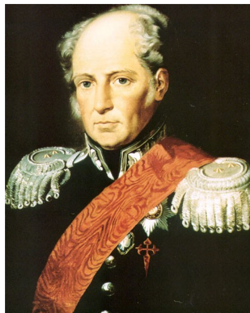
Ил. 3. Августин Бетанкур

По-настоящему активизировались деловые и геополитические связи между странами лишь в конце XVIII – начале XIX века. Заметный след в архитектуре России оставил гениальный инженер Августин де Бетанкур, один из авторов проекта и руководителей строительства Исаакиевского собора в Санкт-Петербурге, Манежа в Москве, комплекса павильонов Нижегородской ярмарки, первого арочного моста через Малую Невку. Бетанкур был весьма благосклонно принят императором Александром I и даже поступил в России на военную службу в чине генерал-майора.