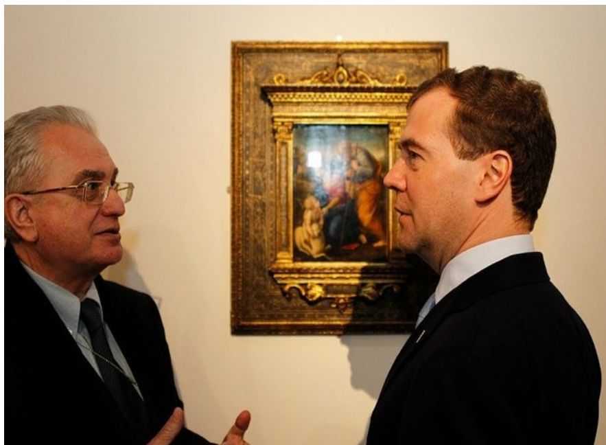
Ил. 7. С директором Государственного Эрмитажа Михаилом Пиотровским

Тициана, Якопо Тинторетто, Никола Пуссена, Эль Греко, Диего Веласкеса, Бартоломе Эстебана Мурильо, Франсиско Гойи и других гениев, позволит показать разнообразие и высочайший уровень собрания музея Прадо.