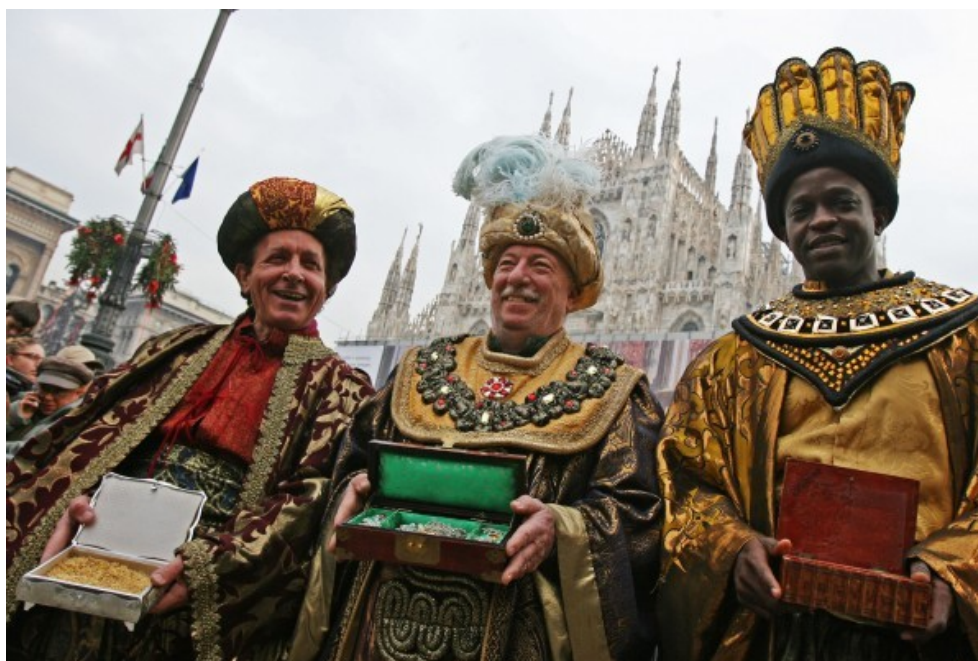
Ил. 2 Празднование Дня Эпифании.

любимых в стране праздников – День Эпифании (Богоявление), которым заканчивается череда рождественских и новогодних торжеств.