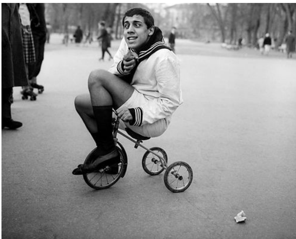
Ил 3. 18-летний Андриано Челентано – комедийный актер. Антикатолическое ёрничанье

1959-й год стал для Челентано годом двух важных дебютов: оглушительного и тишайшего. Невозможно считаться звездой, не победив на фестивале в Сан-Ремо. Молодой бунтарь отправился покорять его с песней «Двадцать четыре тысячи поцелуев», исполнил которую, повернувшись к жюри и залу мускулистой спиной. От такого нахальства публика ахнула, а жюри смертельно обиделось.