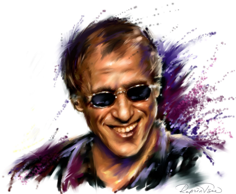
Ил. 1. Адриано Челентано (Adriano Celentano) (р. 1938).