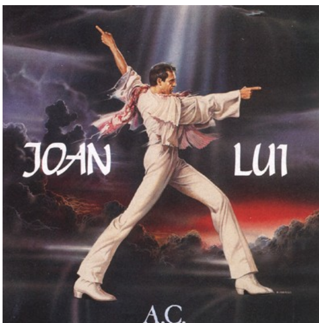
Ил. 10. Обложка к фильму “Джоан Луи: однажды в понедельник я приду на эту землю”

Зрелище, в котором Иисус–Челентано, вернувшись на землю после своего распятия, прорывается на телевидение и в окружении подтанцовки из наркоманов и проституток пытается с помощью зажигательного рок-н-ролла спасти человечество, оказалось не для слабонервных. А тут еще коварные прокатчики по собственной инициативе урезали фильм почти на сорок минут, так что зрители совсем запутались в сюжете. Картина с треском провалилась.