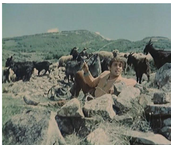
Ил. 8. Кадры из фильма “Серафино” (Serafino), 1968 год. Адриано Челентано в роли пастуха.

«Созданный им образ сродни персонажам народной комедии – он простоват и лукав, наивен и мудр одновременно, – удовлетворенно констатировал на премьере Джерми. – Челентано настолько уверенно работал на съемочной площадке, так старался вникнуть во все стороны кинопроизводства, что мне кажется, он скоро станет режиссером» [6]. Так оно и произошло. В 1975 г. Адриано продолжил режиссерские опыты в поставленном им фильме «Юппи Ду», эксцентричном, полном черного юмора и абсурда рок-мюзикле с сюрреалистическими видениями на тему любви и творчества. Критики назвали это творение певца «дуновением свежего ветра в итальянском кино». Но всё же гораздо чаще Челентано снимался как актер.