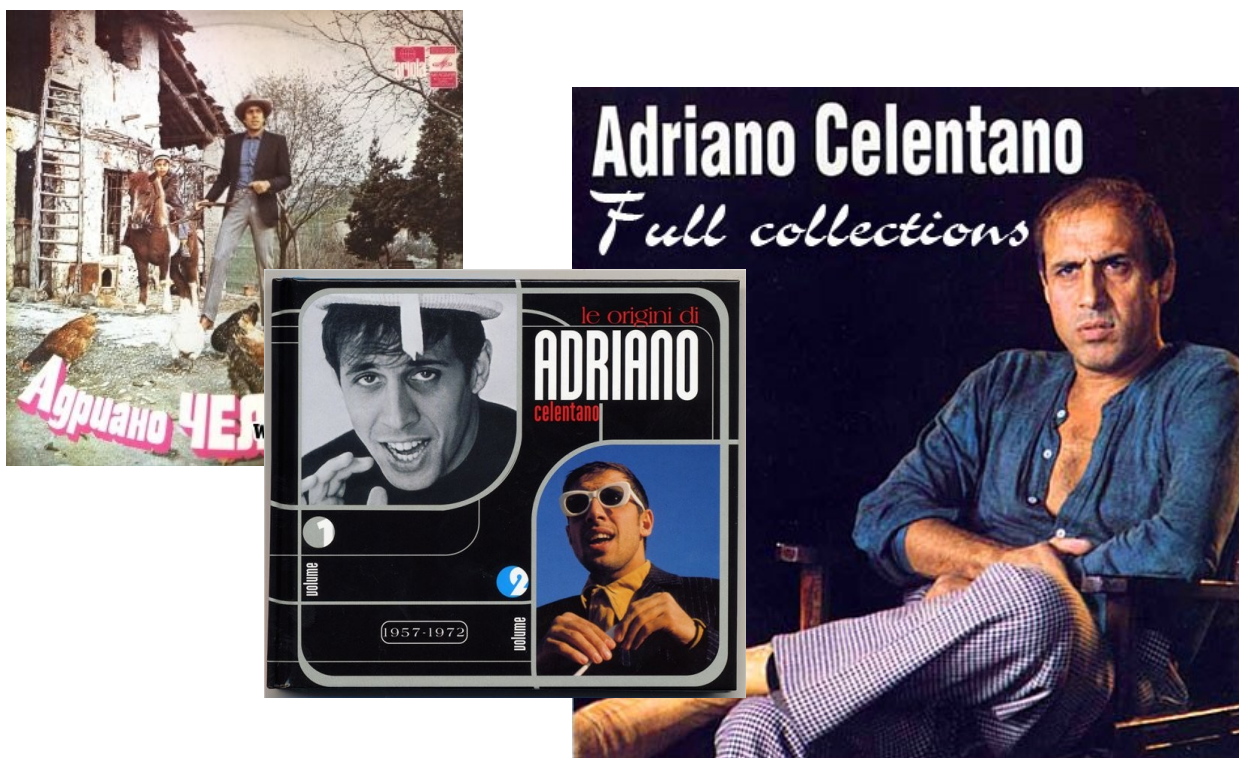
Ил. 12. Обложки некоторых альбомов Адриано Челентано, выпущенных в разные годы творчества