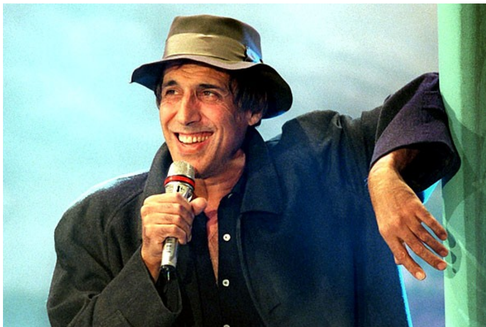
Ил. 13. В фильме «Джекпот» ( Jackpot ), 1992.

Время от времени музыкант появляется на TV с каким-нибудь новым, будоражающим общественное мнение проектом (например, «125 миллионов бредней» в 2001 г., « Rockpolitik » в 2005-м и др.), который бьёт все рекорды популярности.