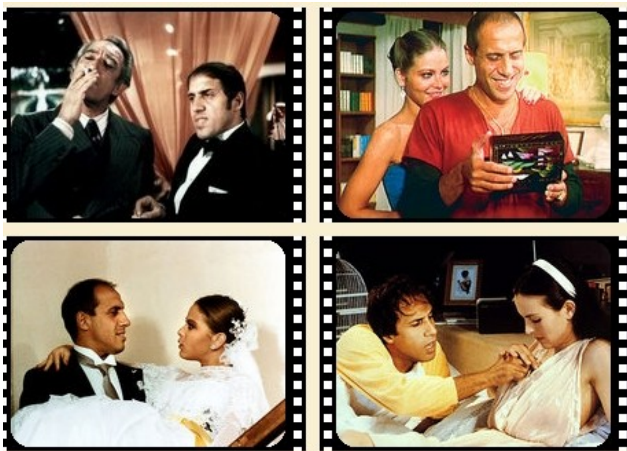
Ил. 9. Адриано Челентано и Энтони Куин в фильме “Блеф” (1976), с Орнеллой Мути в фильме “Укрощение строптивого” (1980), с Король Буке в фильме “Бинго Бонго” (1982).

Фильмы «Бархатные ручки», «Блеф», «Ас», «Укрощение строптивого», «Бинго-Бонго», «Гранд-Отель «Эксцельсиор» имели фантастический успех у зрителей и делали огромные кассовые сборы.