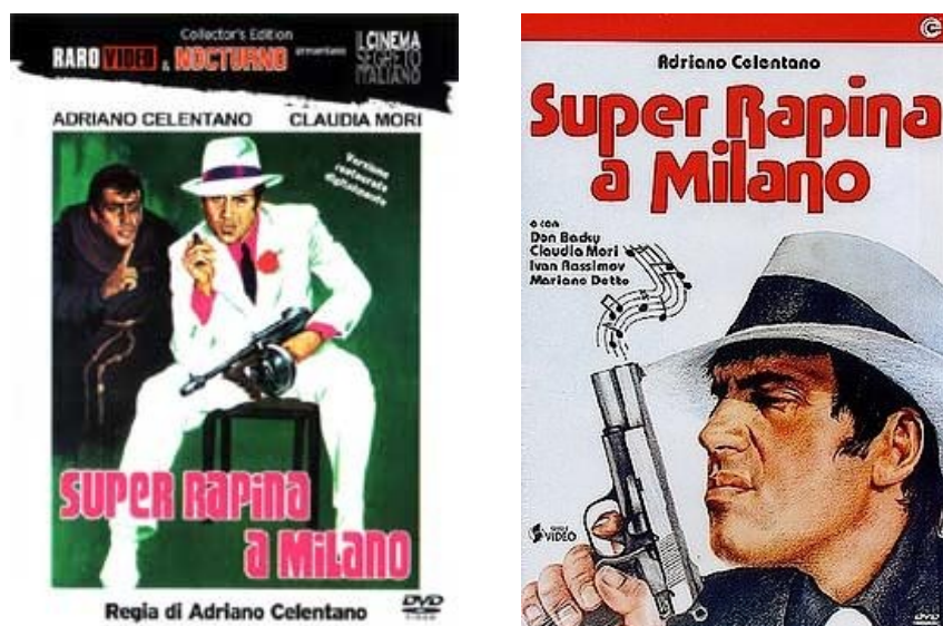
Ил. 6. Обложки к фильму “Суперограбление в Милане”

Певец оказался заботливым супругом и хорошим семьянином. Свою музу-жену, «единственную и незаменимую», он увековечил сначала в кино, затем в песне, а позже в скульптуре.