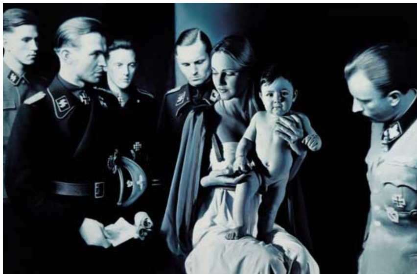
Ил. 2. Готфрид Хельнвайн. «Крещение I (Поклонение волхвов)»

Пожалуй, подлинным пионером шокирующего искусства был французский художник Марсель Дюшан. Обычный писсуар, помещенный им на выставку в 1917 г. под названием «Фонтан», вызвал тогда скандал. А в 2004 г., по результатам проведенного опроса среди пятисот художников и критиков, «Фонтан» был назван «самой влиятельной работой современного искусства».