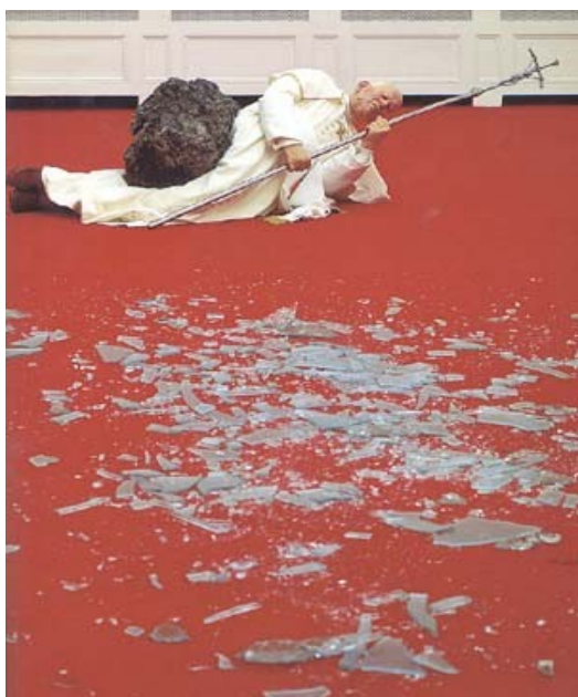
Ил. 8. Маурицио Каттелана. «La Nona Ora»

Ошибка Джулиани, по мнению ряда экспертов, состояла в том, что сердитое общественное обсуждение очередной работы с провокативным сюжетом только привлекает к ней внимание. Зачем давать «скандальным» художникам рекламу, публичность, которую они страстно желают? Следовало бы встретиться частным образом с администрацией музея и посмотреть, готовы ли они принять точку зрения мэра. С другой стороны, считают эксперты, и музейным кураторам, получающим муниципальное финансирование, следовало бы дважды подумать, прежде чем выставлять искусство, которое явно будет оскорблять значительную часть общества.