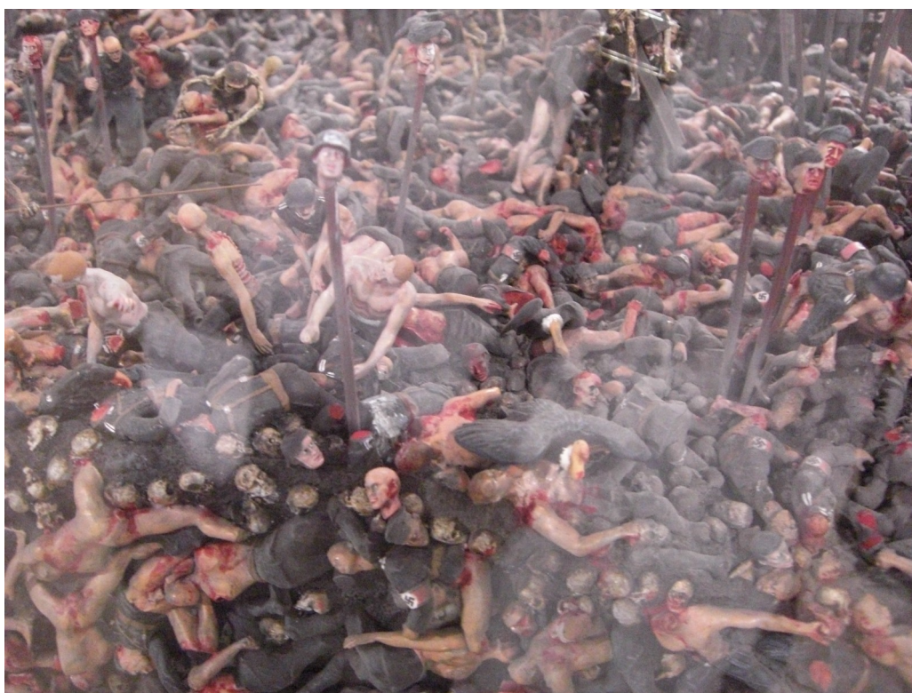
Ил. 9. Дж. и Д. Чапмены. «Ад»

Демонстрировались отрывки из сексуальных сцен в видеофильмах, а также вновь «ударной группой» выступили братья Чапмены. Выложенная в форме свастики монументальная композиция из нескольких тысяч миниатюрных окровавленных фигур называется «Ад» и изображает жестокую схватку нацистских солдат. Подготовленные зрители восприняли её как своеобразный ответ на реконструкцию пейзажа Холокоста.