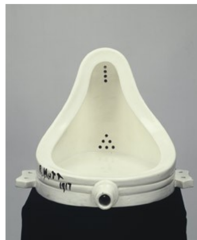
Ил 3. Марсель Дюшан. Фонтан (1917 г.)

В 1987 г. Андрес Серрано (Andres Serrano) фотографирует распятие, на которое он помочился (работа называлась “Piss Christ”). Проводились даже выставки «шокирующих» художников (в частности, молодых британских художников в 1988 г., Лондон, их же в 1995 г., США), однако эти выставки не попадали в центр общественного внимания, оставаясь где-то на его периферии. Ситуация резко изменилась, когда за дело взялся профессионал – рекламный магнат Великобритании и коллекционер Чарльз Саатчи. Саатчи оказался ловким изобретателем способов донесения провокативного творчества до широкой публики и сыграл определяющую роль в продвижении карьеры молодых британских художников. Он открыл свою галерею в Лондоне. По его инициативе многие произведения этих художников оказались затем на рынке и демонстрировались по всему миру.