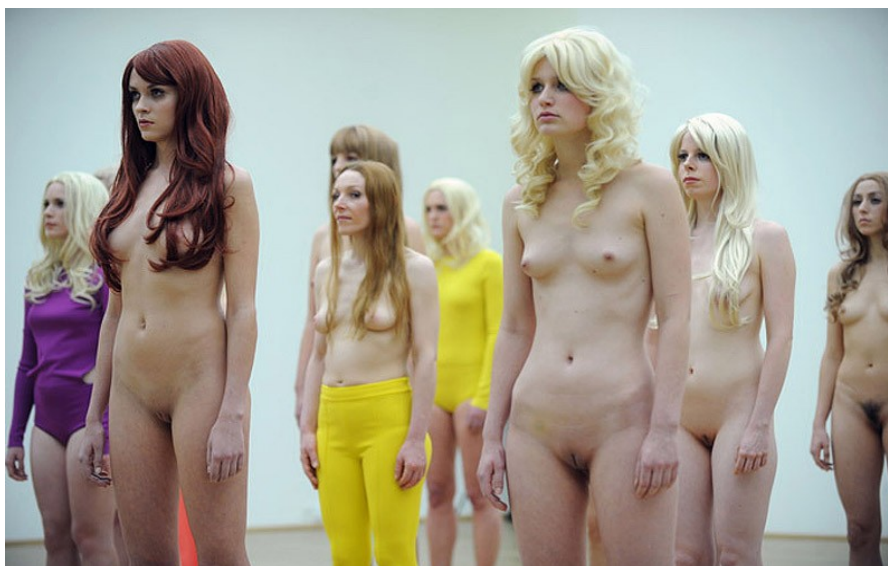
Ил. 11. Одна из инсталляций Ванессы Бикрофт

В ее работах часто появляются группы молодых обнаженных моделей с бессмысленными выражениями лиц. А на больших картинах Дженни Савий можно видеть фигуры бесстыдных обнаженных женщин, показанных с невыгодных точек зрения.