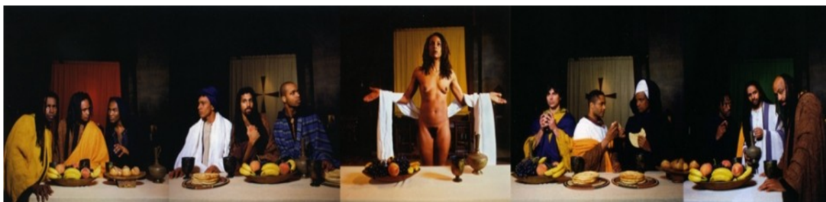
Ил. 6. Рене Кокс. “Yo Mama’s Last Supper”

Два года спустя после шумевшей «Сенсации» Рудольфо Джулиани и Бруклинский музей искусств снова столкнулись. На этот раз многие верующие были оскорблены фотографией, сделанной афроамериканкой Рене Кокс (Renee Cox) и выставленной в этом музее на выставке «Современная черная фотография». “Yo Mama’s Last Supper” – так называется работа Кокс – представляет собой фотомонтаж на сюжет известной картины Леонардо да Винчи «Тайная вечеря». Обнаженная черная женщина на месте фигуры Христа (самопортрет автора) вносит сексуальный мотив в сцену, которая многими воспринимается как богохульная. Автор объяснила, что в этой сцене она заявляет протест позиции католической церкви по женскому вопросу 2 (непонятно, впрочем, что общего фотография обнаженной натуры имеет с данной темой). Как Рене Кокс отреагировала бы, вопрошают критики, если бы явно расистская картина была помещена рядом с “Yo Mama’s Last Supper”? Ведь с формально-юридической точки зрения расизм тоже является проявлением свободы слова.