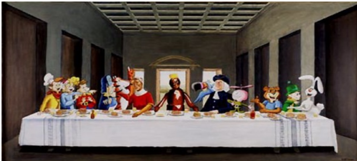
Ил. 7. Дик Децнер. «The Last Pancake Breakfast»

комиссию по этике (decency panel), которая рассматривала бы работы художников, претендующих на показ в учреждениях, получающих муниципальное финансирование (к последним относится и Бруклинский музей). Но существование такой комиссии только «подлило масла в огонь» 3 , т. е. ещё больше разожгло споры вокруг вопроса о том «что такое искусство?». Точнее, этот вопрос приобрел иное звучание: «Что является оскорбительным искусством?»