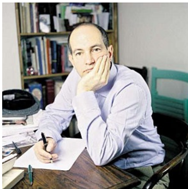
Ил. 4. Патрик Вайль.

Во Франции термин «мультикультурализм» был введен в обиход в 1971 г. словарем Пти Робер, который определяет его как «сосуществование множества культур в одной стране». Интеграция лиц – выходцев из заморских департаментов и территорий, с одной стороны, и коренного населения – с другой, ставит перед Францией серьезную проблему. Национальной культурной интеграции угрожает также довольно популярная сегодня экстремистская идея «французской нации», которая состоит в том, чтобы ликвидировать локальные, или «маленькие группы». В 80-е – 90-е годы прошлого века «ассимиляция во Франции, по замечанию Д. Шнаппер, оказалась сведена к ассимиляционизму» [4, р. 407], предполагающему механический и даже догматический подход к решению столь остро стоящих перед французским обществом интеграционных проблем. В итоге проблемы лишь усугубились, что привело к известным волнениям в пригородах французской столицы осенью 2005 года. Произошедшие беспорядки стали серьезным поводом для переосмысления политики интеграции в отношении все более этнически разнообразного населения страны.