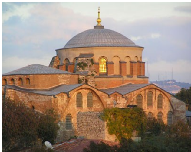
Илл. 1. Церковь святой Ирины, Стамбул

В этом году все мероприятия, связанные с проведением ежегодного Конгресса «Europa Nostra», отличались особенной торжественностью и имели для Турции символическое значение – ведь Стамбул является европейской столицей культуры–2010. Церемонию вручения наград возглавили исполнительный президент «Europa Nostra» и президент Общества наследия Франции Дени де Кергорлэ, еврокомиссар по образованию, культуре, мультилингвизму и делам молодежи Андрулла Василиу, министр культуры и туризма Турции Эртогрул Гюнай и член Европарламента Дорис Пак [2]. В стенах старейшей константинопольской церкви прозвучало видео-обращение нового Президента «Europa