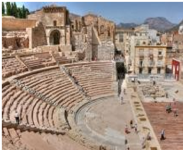
Илл. 3. Римский театр в Картахене (Teatro romano de Cartagena), Испания

В 2010 году на эту категорию традиционно пришлось три главных приза. Одну из высших наград получили испанские археологи и реставраторы за создание музейного комплекса на месте древнеримского театра в городе Картахена, другую – специалисты из Франции за реставрацию Коллежа Бернардинцев в Париже и организацию там культурного центра. Третьей награды были удостоены представители Германии за осуществление проекта по восстановлению практически уничтоженного в годы Второй мировой войны Нового музея в Берлине.