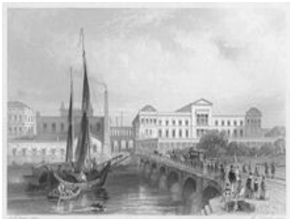
Илл. 9. Вид на Новый музей в Берлине. Гравюра. 1850 год

интеллектуальной элиты Франции. В годы Великой французской буржуазной революции для бернардинцев наступили тяжелые времена: здание коллежа было конфисковано и национализировано, а оставшиеся в нем монахи изгнаны. Впоследствии помещения коллежа переходили из рук в руки и использовались под самые разные, но явно не религиозные нужды. В них размещались и склад, и пожарная станция, и школа полиции [6].