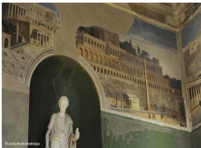
Ил. 13. Фрески в Римском зале. Новый музей, Берлин