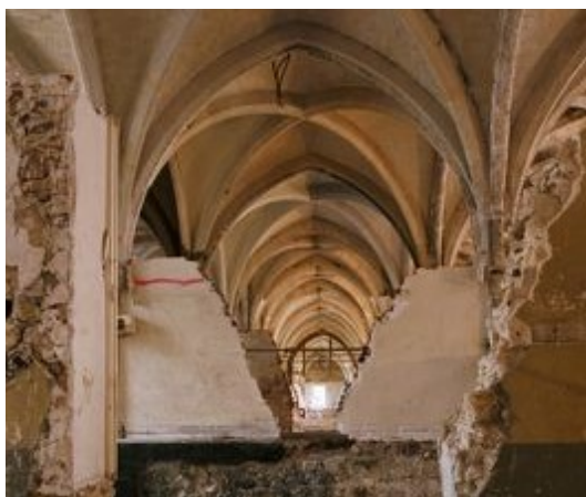
Илл. 7. Коллеж Бернардинцев. До реставрации

«Жюри восхищено реставрацией римского театра в Картахене, его прекрасной интеграцией в городскую структуру, методами его показа и использования в культурных и просветительских целях, – говорится в итоговом документе «Europa Nostra». – Этот проект, несомненно, будет способствовать духовному возрождению этого района Испании» [6].