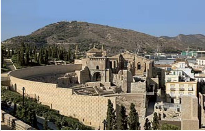
Илл. 4. Вид на Римский театр в Картахене

«сидячих» местах могли находиться около 6 тысяч зрителей. Фасад сены украшала двойная колоннада из розового мрамора, достигавшая 14,6 метров в высоту. Скульптурный декор был выполнен в императорских мастерских Рима из белого пентелийского греческого мрамора. Под сеной была устроена сеть канализационных каналов, отводивших дождевую воду [5]. Но театр просуществовал недолго, чуть более 100 лет. Уже в III в. н.э. на его месте появилась рыночная площадь, а к XVI в. этот район был окончательно