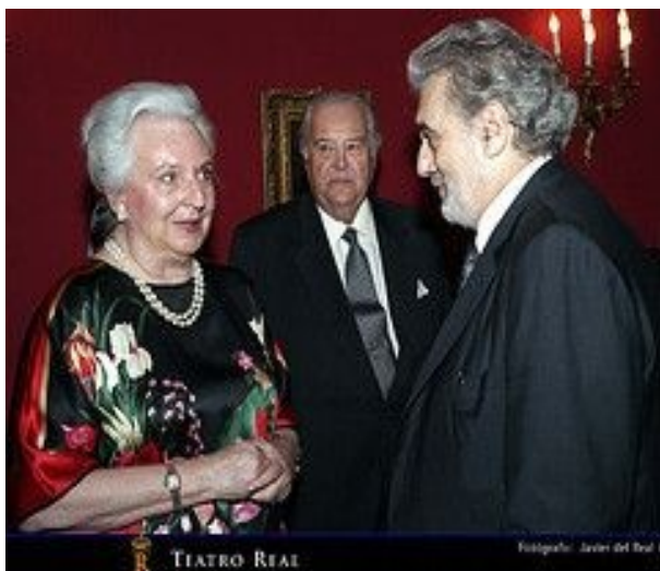
Илл. 2. Церемония передачи Президентства. Пласидо Доминго и Дона Пилар де Борбон