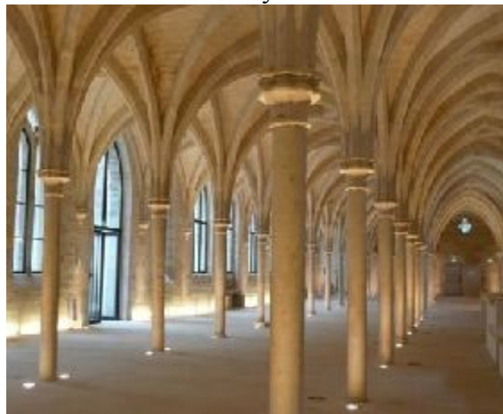
Илл. 8. Коллеж Бернардинцев после реставрации

Здание Коллежа Бернардинцев является настоящей достопримечательностью столицы Франции. Его история восходит к 1245 году, когда с согласия Папы Иннокентия IV в Париже был создан монастырь цистерцианцев, в котором монахи должны были обучаться теологии,