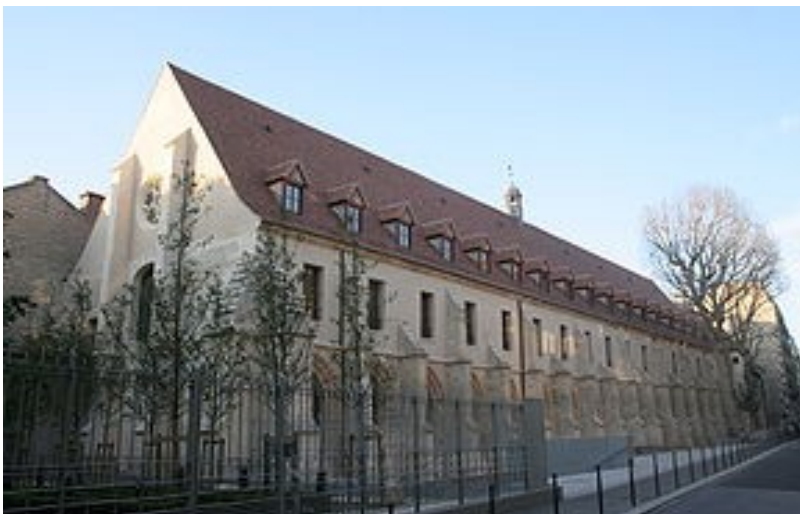
Илл. 6. Коллеж Бернардинцев в Париже (Le Collège des Bernardins, Франция)