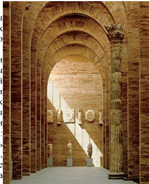
Илл. 5. Один из залов музейного комплекса в Картахене

В 1987 году городские власти приняли решение реконструировать район, чтобы разместить в нем региональный ремесленный центр. Тогда же встал вопрос о необходимости проведения предварительных археологических изысканий, во время которых и были обнаружены остатки древнеримских строений. Власти организовали общегородской референдум: жителям Картахены предлагалось проголосовать либо за продолжение раскопок и, как следствие, снос мешавших зданий, либо за прекращение работ. Горожане однозначно высказались за дальнейшие археологические исследования, восстановление римского театра и создание нового музейного комплекса, призванного привлечь в город туристов [6]. В 1999 г., после фактического окончания раскопок и мощных финансовых вложений, осуществление