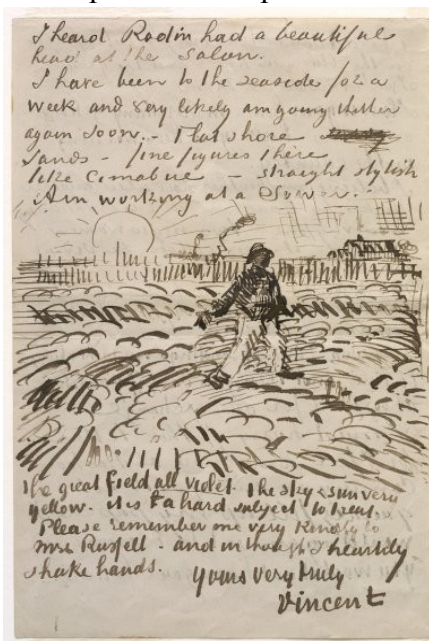
Илл. 14. Одно из писем Винсента Ван Гога

В первой категории была отмечена кропотливая, длившаяся 15 лет, работа